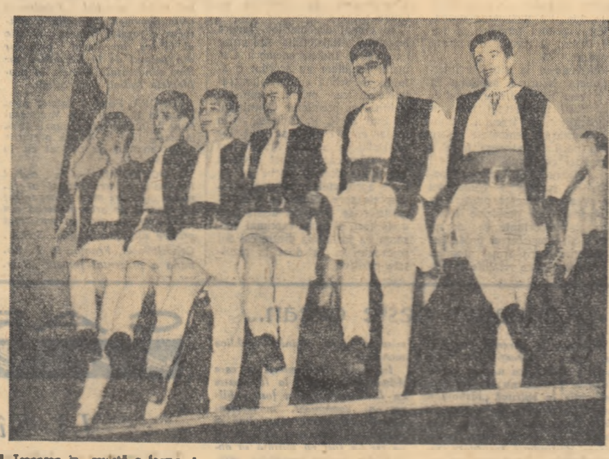
Trecerea în revistă a formațiilor artistice de amatori studențesci care s-a desfășurat pe scena Casei de cultură a studenților „Grigore Preoteasa” din București, ne-a oferit această imagine dintr-o suită muntănoasă prezentată de studenții Institutului Medicco-farmaceutic.

nu se mai obținuseră nici pe la și nici prin împrejmuriri. Cum se explică producția dublă de pe cele 5 ha? În vreme ce pe 45 ha, au fost aplicate numai cîte 200 kg. îngrășăminte chimice, pe cele 5 ha au fost aplicate cîte 800 kg. Aceasta a demonstrat limpede ce mare valoare au îngrășămintele. Pe lângă ce au realizat țona de porumb la un preț de 270 lei, în loc de 614 lei, cit fusese planificat, ei au contribuit la sporirea veniturilor gospodăriei cu apreciable suma de 300.000 lei. Odată câștigată această experiență, ea a trebuit generalizată. Conducerea gospodăriei de stat a hotărât ca anul acesta să cultive cu porumb irigat suprafața de 400 ha. Iar băieții care anul acesta vor lucra pe cele 400 ha, vor iriga și suprafața de 4000 kg. la hectar stabilă de gospodărie. E intr-adevăr un fapt deosebit de semnificativ pentru ceea ce înseamnă adevăratul fruct al recoltelor bogate, care întăresc încrederea, nu se sperie de „limite” și pornește curajos la luptă, înarmat cu știința agricolă, pentru a smulge pămîntului recolte tot mai mari.