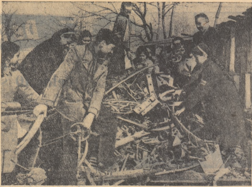
Elevi al Școlii elementare din comuna Dragodina, raionul Călărași, stringind fier vechi.