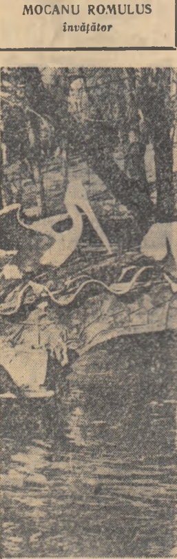
Policenii își fac toaleta matinală.