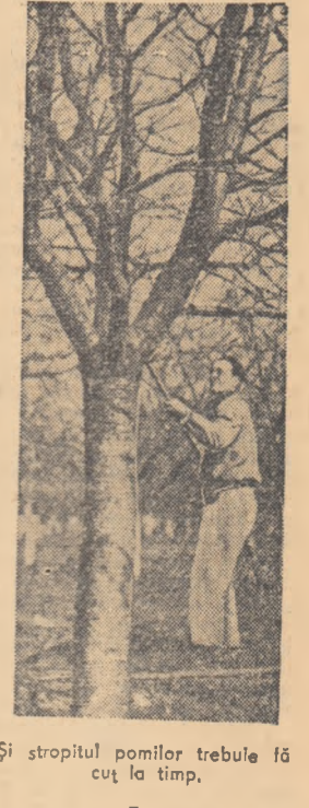
Și stropitul pomilor trebuie făcut la timp.

CONSTANTIN DABUJA vice-președintele Comitetului Executiv al statului popular al orașului Bacău