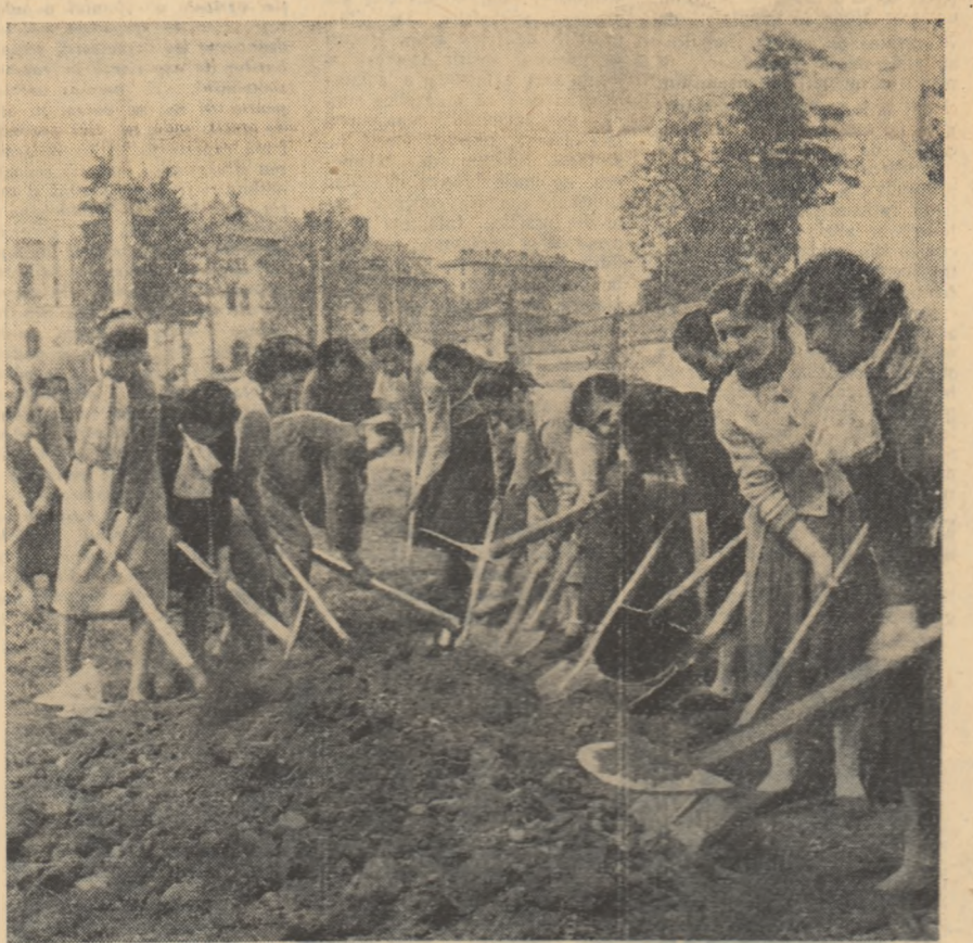
O brigadă utemistă de muncă patriotică a elevilor școlii de surori de cruce roșie din Preșbiș lucrînd la reamenajarea parcului din centrul orașului.

V. MAȘEK Concurs: „Cel mai bun inovator din întreprindere” TG. MUREȘ (de la corespondența noastră). — În aceste zile dinaintea Congresului partidului, la întreprinderea „Encsel Mauriciu” din Tg. Mureș mișcarea de inovații și raționalizări se extinde necontenit. Numai în primele 4 luni ale acestui an, la cabinetul tehnic s-au înregistrat peste 115 propuneri de inovații și raționalizări. Valoarea economică a acestor inovații se ridică la peste 193.000 lei. Sub conducerea organizației de partid, organizația U.T.M. a inițiat de curînd întreceri între toate brigăzile de producție ale întreprinderii din întreprindere pentru a extinde și mai mult mișcarea de inovații și raționalizări. În acest scop s-a organizat un concurs de inovații cu tema: „Cel mai bun inovator din întreprindere”. Un colectiv format din 8-10 ingineri și tehnicieni dau zilnic tinerilor la locul de muncă explicațiile necesare și consultații în vederea realizării propunerilor lor.