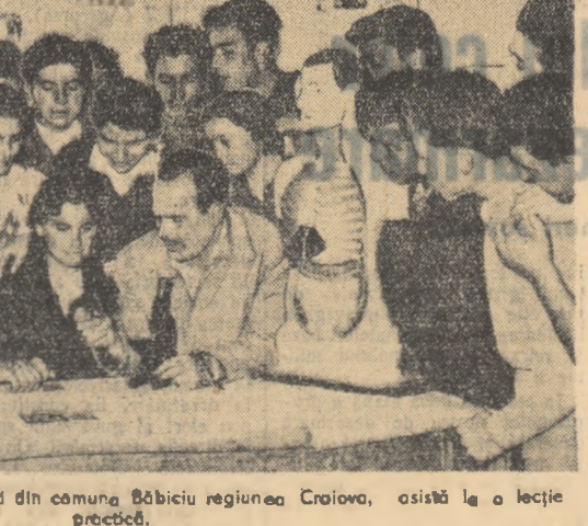
Membrii cercului tinerilor naturalisti din comuna Băbiciu regiunea Craiova, asistă la o lecție practică.