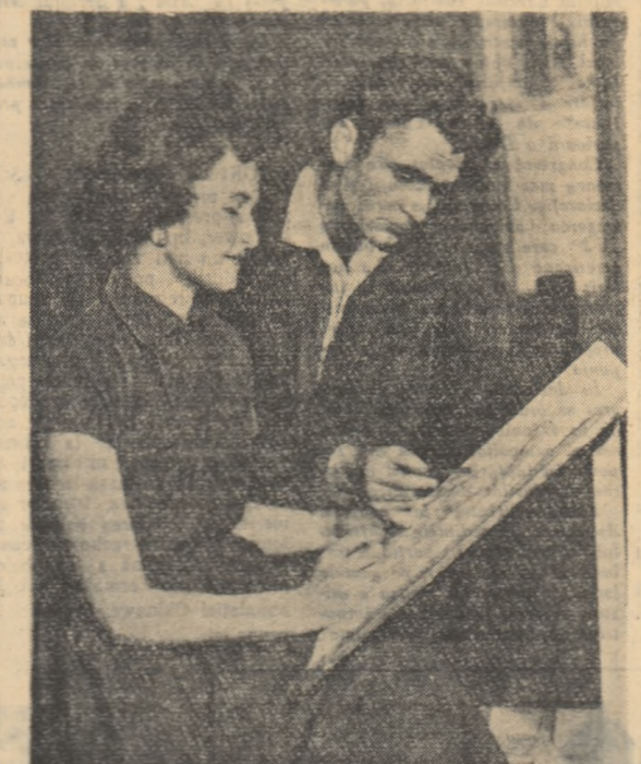
În atelierul artiștilor plastici amatori de la Școala Populară o Artă din Arad.