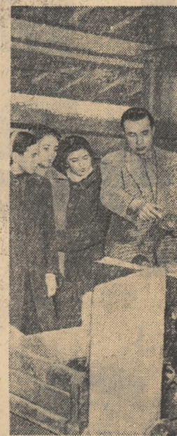
Un grup de elevi de la Școala de meserii din Mediaș în vizită la Uzinele „Vitrometan”.