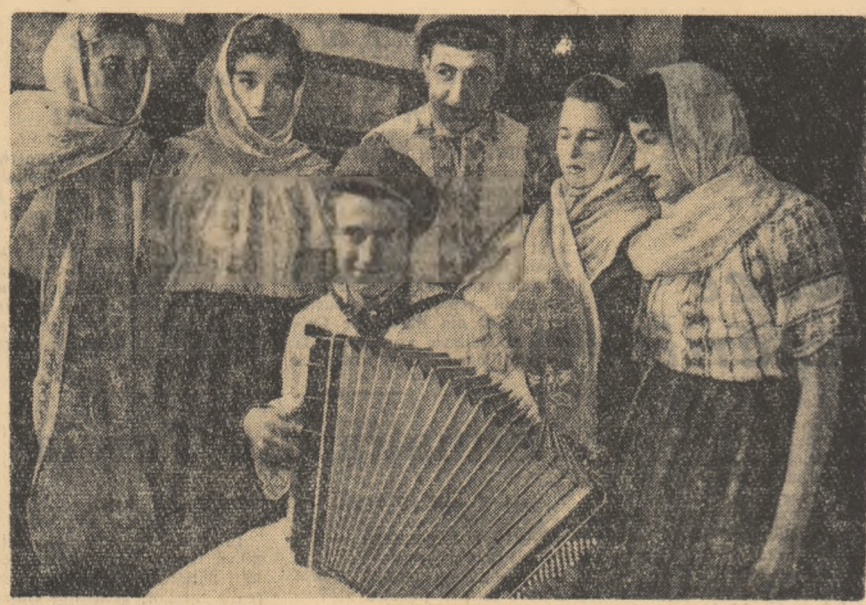
Brigada artistică de agitație a căminului cultural din comuna Dragalina, raionul Călărași, pregătind un program artistic cu tema „În sat la noi”.

Consiliul Central al Sindicatelor va organiza în mod permanent controlul asupra felului în care sînt deservii oamenii trimiși la odihnă și tratament.