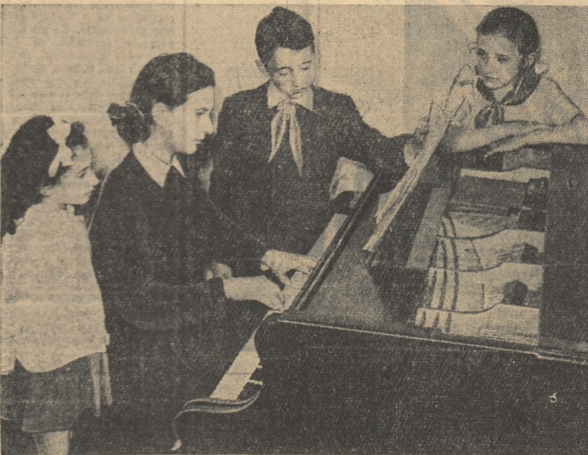
Școala elementară de muzică din Galați. În fotografie: un aspect de studiu la clasa de pian.

Prăjila a II-a în speca de zahăr a fost terminată în Raionul Segarcea, regiunea Craiova, iar la floarea-soarelui este aproape de sfîrșit. O atenție deosebită acordă țărânii muncitori în acest an lucrările de îngrijire a culturilor de porumb pentru boabe și siloz. Prima prăjilă la aceste culturi a fost executată pe 20 la sută din suprafețele cultivate, iar prăjila II-a este începută pe însemnate suprafețe. (Agerpres)