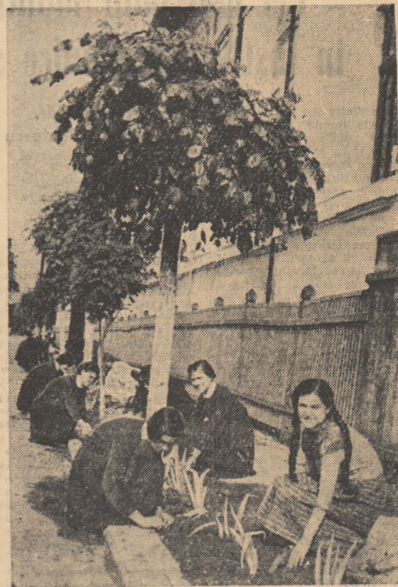
Să facem orașele și satele patriei cit mai frumoase! Sub această chemare numeroși tineri și tinere din Cimpina participă la acțiunile de îngrijire a spațiilor verzi.