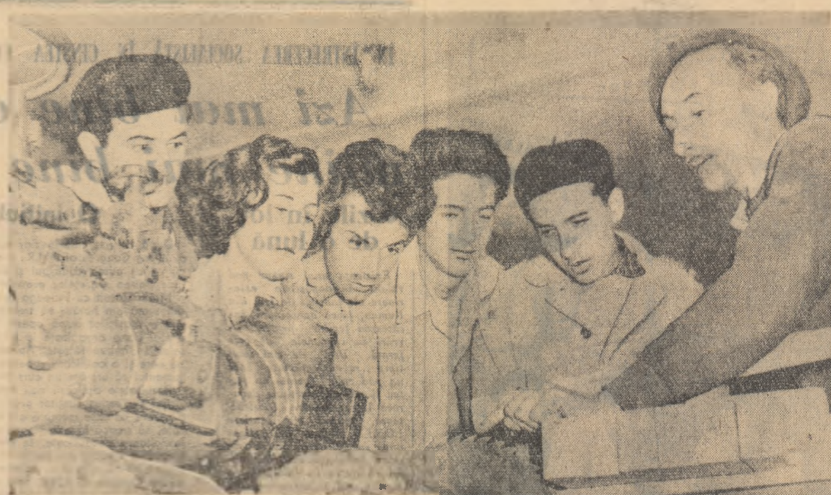
Un grup de studenți alinați în practică la I.P.R.O.F.I.L.-Măgura Codlei, primind explicații la locul de muncă.

Pînă la examenul de admitere în facultăți mai este doar puțină vreme. De aceea, preocuparea de a completa numărul candidaților la acest examen cu cei mai mulți tineri muncitori cred că ar trebui soluționată cel mai curînd. Ar fi bine ca institutele de învățămînt superior să se lege de conducerea uzinelor, cu comisiile de selecționare, să-și trimită cadrele didactice pentru a participa la activitatea acestor comisii Tinerii care vor fi recruțați pentru învățămîntul superior trebuie să aibă posibilitatea să participe la cursul de pregătire. Pentru ei ar fi bine să se formeze noi grupe de studiu cu cadrele didactice cele mai bune, astfel ca aceștia să facă față la concursul de admitere, la exigențele sporite ale acestor concursuri și să fie o preocupare permanentă, nu numai pentru acest an universitar. Treptat, în institutele de învățămînt superior vor trebui să intre mereu mai mulți tineri care au trecut prin școala producției.