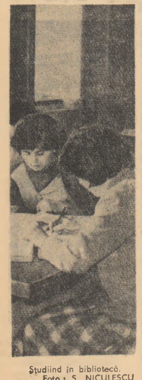
Studiu în bibliotecă.