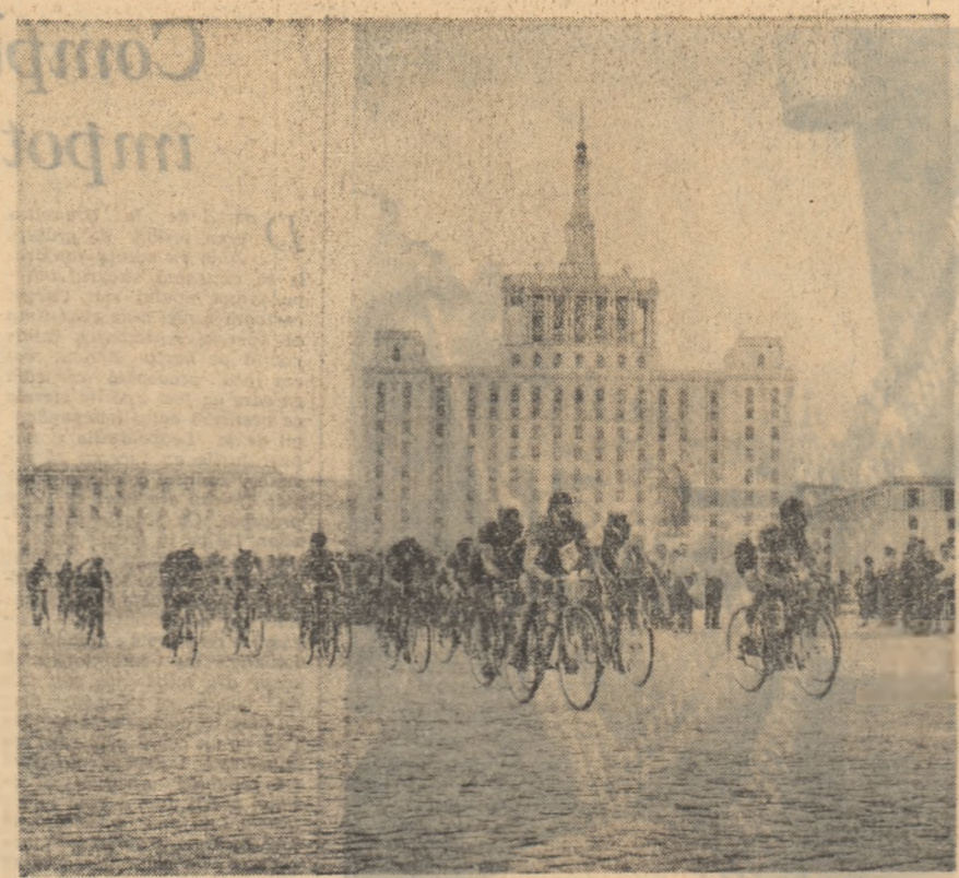
Start, în cea de a XIII-a ediție a „Curselor Școlii”

Festivitatea s-a încheiat printr-o reuniune studențească.