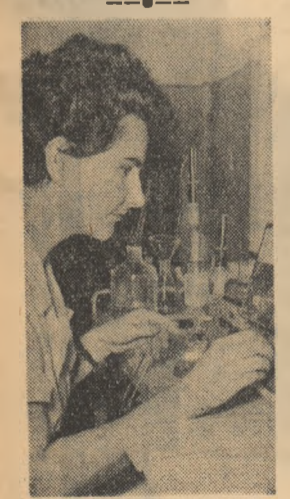
Intr-unul din laboratoarele Institutului de endocrinologie din Capitală.

A fost aprobat proiectul de irigație a unui sector experimental din stepă, cu o suprafață de aproximativ 1,5 mil hectare și schema răspîndirii în viitor a acestei experiențe în vederea irigației unei mari suprafețe din porțiunea secetoasă a stepii Kulunda. În viitorul 20 de ani se prevede să se irige o suprafață de 1.000.000 ha.