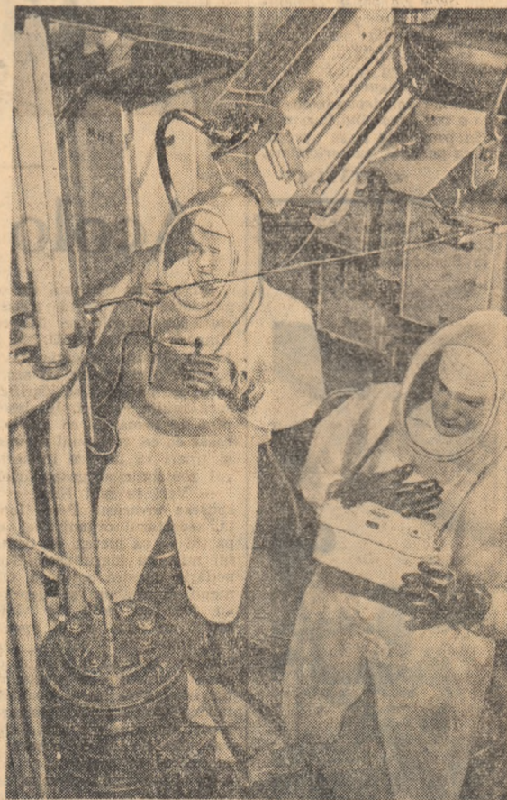
Doi tehnicieni dozimetriști în costume speciale, măsoră radiațiile dintr-una din încăperile spargătorului de gheață atomică.