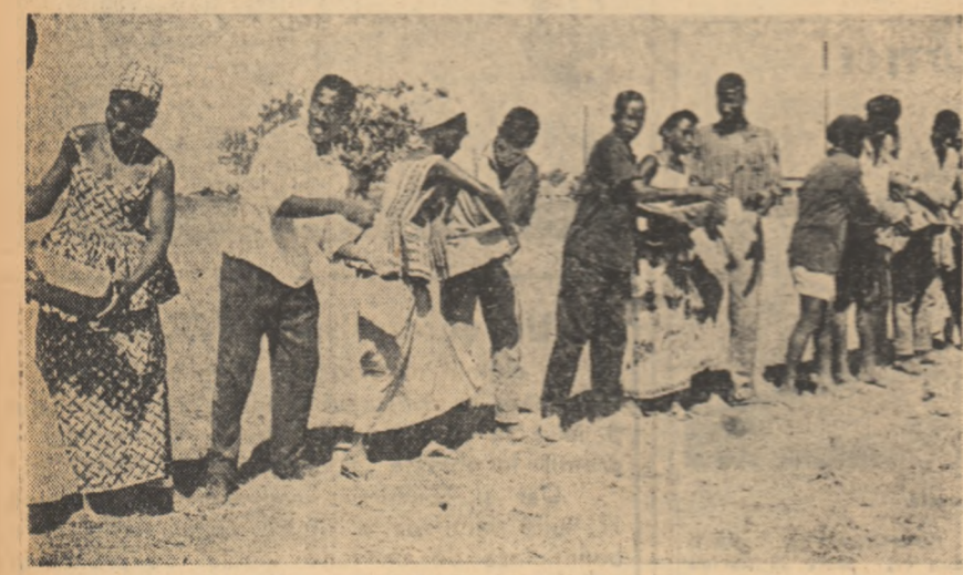
Un grup de membri ai organizației de tineret din Guineea și-au contribuit la construcția țării.

LONDRA. — La 13 iulie a înțeles din viață în vârstă de 67 de ani în urma unui atac de cord Ernest Brown, cunoscut fruntas al mișcării muncitorești din Anglia, unul din întemeietorii Partidului Comunist din Marea Britanie.