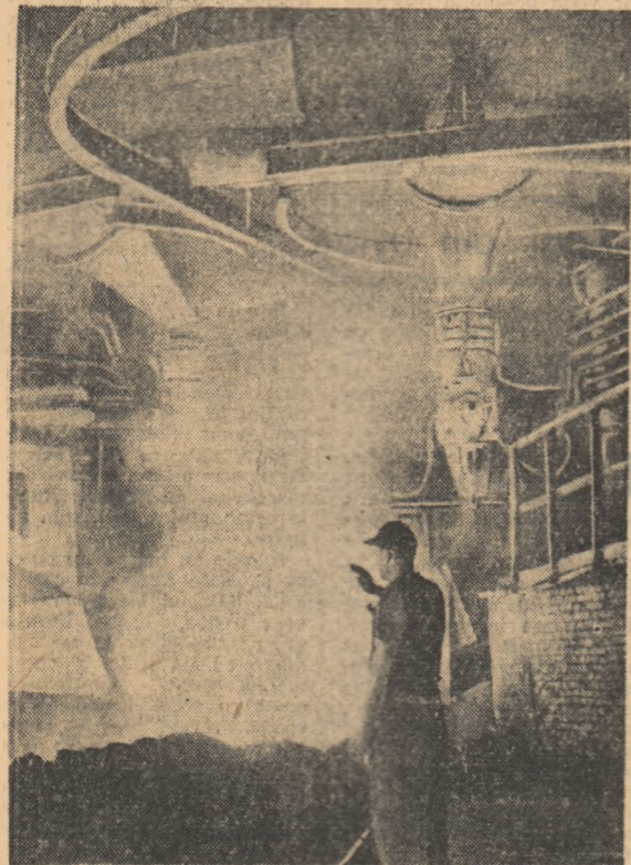
O nouă sarjă la Furnalul nr. 5 din Hunedoara.

Biblioteca Centrală Regională Hunedoara-Dej