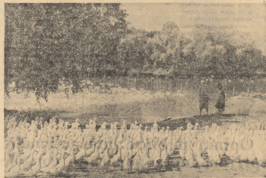
Pe arșiță, o baie prinde bine... (În sectorul avicol al G.A.S. Minăstirea, rolanul Oltenița).

La Turda se construiesc noi blocuri de locuințe La Turda au început zilele trecute lucrările de construcție la cinci blocuri care vor cuprinde 205 apartamente formate din 2-3 camere și dependințe. Tăvălaș a început construcția unei centrale termice care va asigura încălzirea așilor blocuri. (Agerpres)