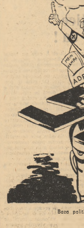
Boza politică Bonn-ulul. Desen de pictorul SURIA din ziarul cubanez „Noticias de al”

A fost prezentată cu mult succes în fața unei săli arhiple, piesa Luciei Demetrius, „Trei generații”. Atît autoarea cît și artiștii au fost răsplătiți cu vit aplauze.