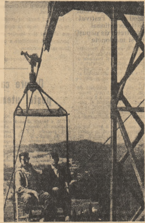
Este plăcută urcarea cu telefericul la Poiana Stalin 1