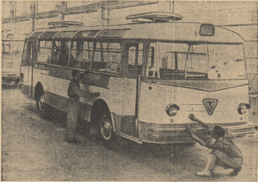
Noul autobuz „T. V. 2U”

Printre mulțimea mașinilor care circulă pe străzile Capitalei a apărut în aceste zile și un autobuz cu inițialele „T. V. 2U”. Acesta face parte din grupul noilor tipuri de mijloace de transport puse în fabricație de serie de muncitorii, tehnicienii și inginerii de la Uzinele „Tudor Vladimirescu” din Capitală.