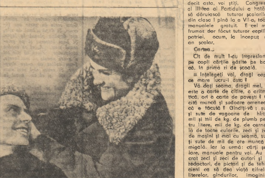
Scenă din filmul „Normandie Niemen”