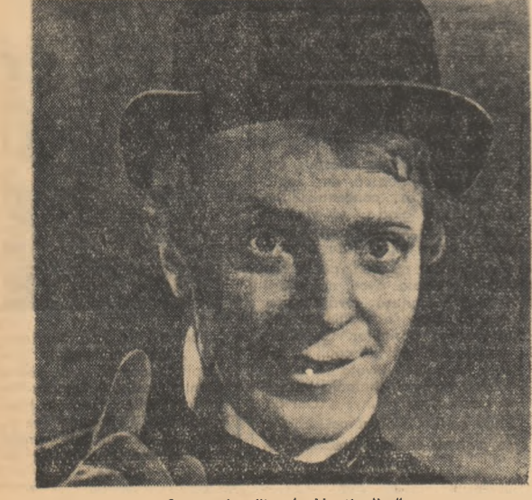
Scenă din filmul „Nopti albe”

Nuvela „Nopti albe” a fost scrisă de către F. M. Dostoievski încă înaintea arestării și deportării sale. De aceea, ea e străbătută mai mult decît alte opere ale sale de prospețime și elan romantic, de încredere în dreptul omului la