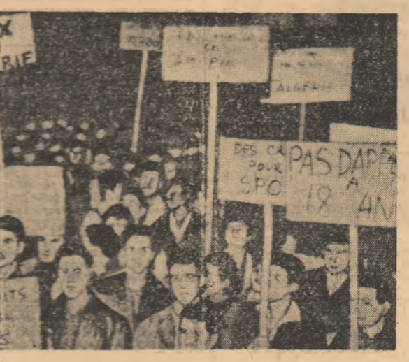
Demonstrația a tineretului muncitor din Paris prin care se cere să se pună capăt războiului colonialist din Algeria

Delegația guvernamentală romînă s-a interesat deosebit de procedeele de elaborare a oțelului în convertitor cu oxigen de noue tipuri și de construcția de mașini de sudură turbomare transformatori și generatoare electrice.