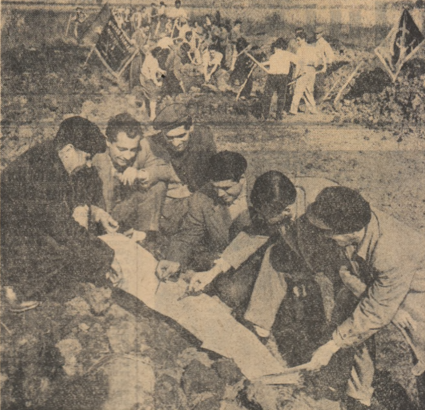
Muncă intensă pe șantiere de desecări de la Rîlov, regiunea Ploiești. Tinerii brigadieri din comuna Buda-Polonica, Rîlov și Bercești au efectuat pînă în prezent peste 1000 m. cubi de săpături.

economice pe care și le-au luat la începutul acestui an, să facă cu acest prilej un prim bilanț în legătură cu ceea ce au realizat și ce o mai rămâne de îndeplinit. Aproximativ alegând organelor conducătoare U.T.M. trebuie să constituie un imbold pentru toate organizațiile U.T.M. de la sate pentru a lua toate măsurile pentru ca aceste angajamente să fie realizate în întregime. Pagina de față își propune să împărtășească din experiența unor organizații U.T.M. de la sate în mobilizarea tineretului la îndeplinirea angajamentelor economice.