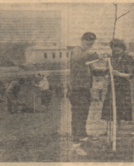
Parcul pe care-l amenajează acum tinerii din comuna Timpani, raionul Poltava va schimba mult aspectul satului lor.

În primăvară tinerii au transportat pe tarlele gospodăriei 500 de tone de gunoi de grajd și mranită. Mai apoi au trecut la întreținerea culturilor de pe loturile experimentale. Au dat ajutor duminică la procurarea materialului și la construcția propriu zisă a steluțelor de timpuri. Steagul brigăzii a fluturat însă și în afara gospodăriei. La acțiunea de reconstruire a cîmînului cultural, de înfrumusețare a comunei au fost prezenți și membrii brigăzii din G.A.C. Obiectivele principale ale brigăzii au fost și rămîn încă cele din marea lor familie: gospodăria agricolă colectivă. În ultima vreme steagul brigăzii a fluturat zile în șir pe locul unde se pregătea „păgunea de iarnă” a animalelor proprietate obștească 720 de tone porumb siloz, din cele 800 planificate pe gospodărie, au înșozat prin muncă patriotică tinerii gospodăriei. După terminarea acestei lucrări, tinerii brigadieri au fost fotografiați de către responsabilii brigăzii. De unde aveau aparatul? L-au primit drept premiu din partea Comitetului raional U.T.M. Domnești, pentru rezultatele deosebite pe care le-au obținut în acțiunile patriotice. D. NICUȚA