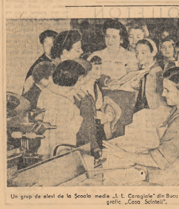
Un grup de elevi de la Școala medie „I. L. Caragiale” din București în vizită la Combinatul Poligrafic „Casa Scînteii”.

În procesul întrecerii socialiste s-a dezvoltat mișcarea inovatorilor — expresie a creșterii conștiinței socialiste a oamenilor muncii eliberată de exploatare și asuprire. În lupta pentru îndeplinirea obiectivelor economice puse de partid, tot mai mulți muncitori, ingineri și tehnicieni, mobilizați de organizațiile sindicale, și-au consacrat energia creatoare pentru perfecționarea procesului de producție, pentru folosirea judicioasă a utilajelor. În ultimii patru ani, prin aplicarea în producție a circa 160.000 inovațiilor s-au realizat economii post calculate de peste un miliard lei.