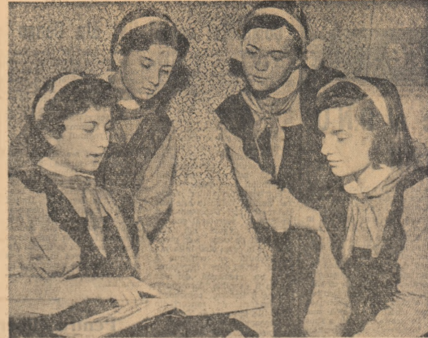
Probleme mai grele înlătuite în decursul studiului individual se clarifică mai ușor în colectiv.

Odată cu construcția centralelor electrice, în țara noastră s-a dezvoltat puternic industria electrotehnică caabilă să facă față cerințelor ritmului rapid de electrificare a țării. Industria electrotehnică, creată la regimul nostru democratic popular, produce astăzi motoare electrice sincrone cu puteri pînă la 1.250 kW, transformatori de forță de 20.000 kVA și 110.000 V, cabluri electrice pînă la 6.000 V, aparate automate, electrocasnice etc. Produsele noastre electrotehnice se bucură tot mai mult de aprecieri pozitive pe plan internațional.