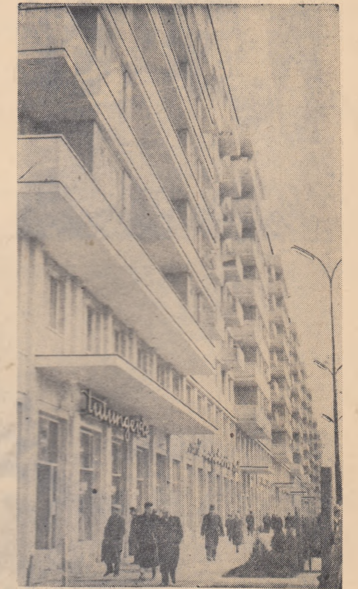
Pleșco nou în raionul „Grivița Roșie”.