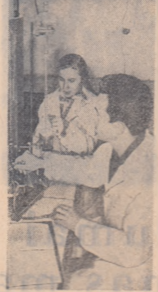
Lucrări practice într-unul din laboratoarele Institutului agronomic din Craiova.

La școala educației colectivistice, disciplina de bază - MUNCA