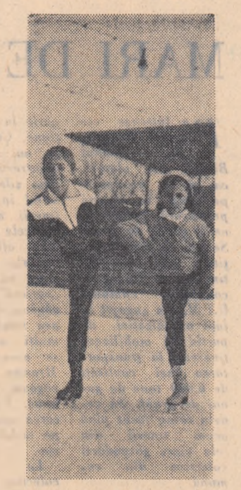
Antrenament pe patinoarul „23 August”.

Numărul cetățenilor din orașul și regiunea Iași care au întreprins excursii în țară în primele 45 de zile din acest an este de aproximativ de trei ori mai mare decît al celor din perioada corespunzătoare a anului trecut.