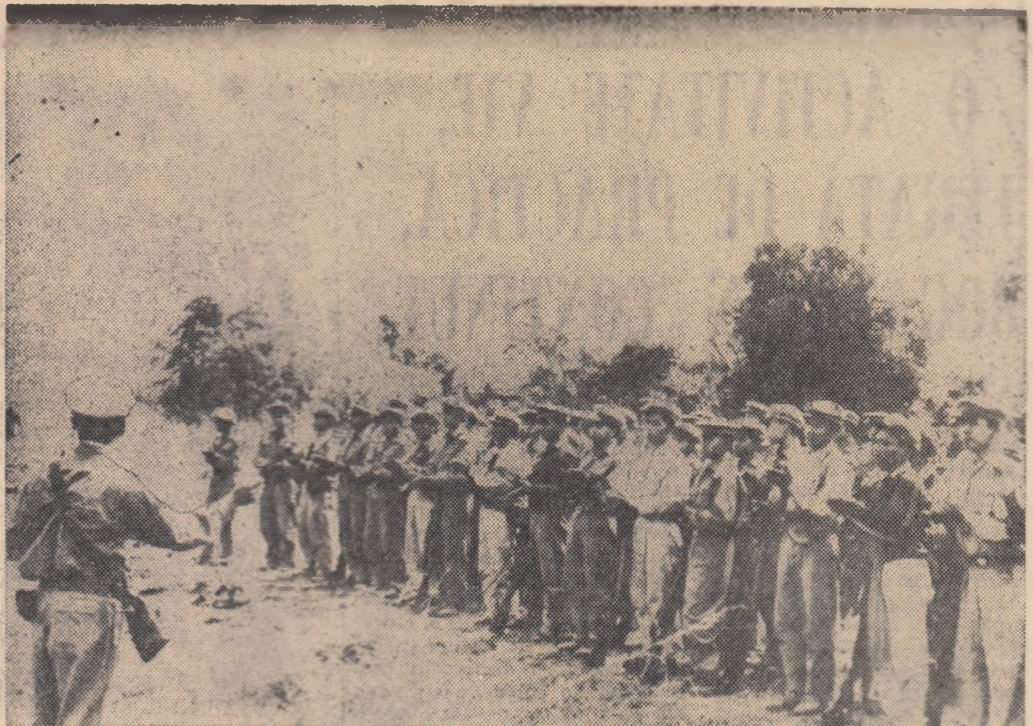
Luptători dintr-o unitate a forțelor Patet-Lao în Valea Uclioa-elor.

Au mai luat cuvîntul reprezentanți din Venezuela, Porto Rico, Paraguay, Guatemala și alții.