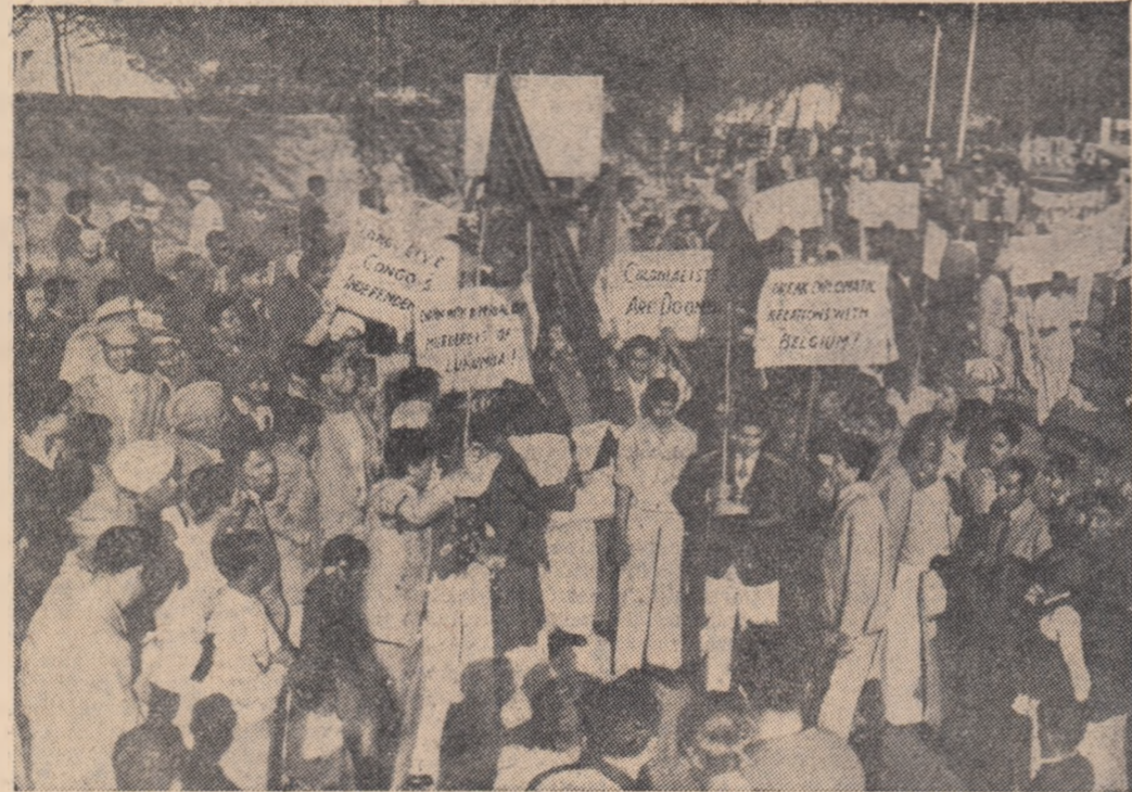
Lo Delhi, capitala Indiei, a avut loc recent o puternică demonstrație a muncitorilor și studenților împotriva crimelor săvîrșite de colonialiștii în Congo.

WASHINGTON 8 (Agerpres). — În cadrul unei conferințe de presă pe care a ținut-o la 7 martie ministrul Muncii al S.U.A., Arthur Goldberg, a anunțat că în cursul lunii februarie numărul șomerilor americani a crescut cu încă 320.000, ajungînd la totalul de 5.705.000. Ministrul american a subliniat că procentul șomerilor americani a ajuns acum la 6,8 din totalul forței de muncă. În ce privește noua creștere a șomajului în cursul lunii februarie Goldberg a arătat că „ea este de trei ori mai mare decît se aștepta de obicei pentru această perioadă a anului”.