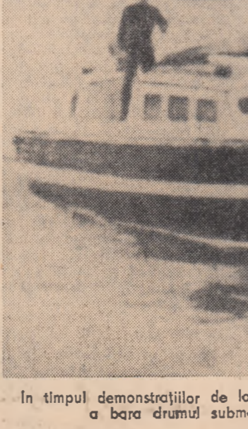
În timpul demonstrațiilor de la Holy Loch, cîțiva manifestații care s-au aruncat în apă pentru a bara drumul submarinelor atomice americane, sînt arestați de poliție.

BEIRUT. În noaptea de 6 spre 7 martie a avut loc o tentativă de atentat la viața primului ministru al Libanului, Saeb Salam.