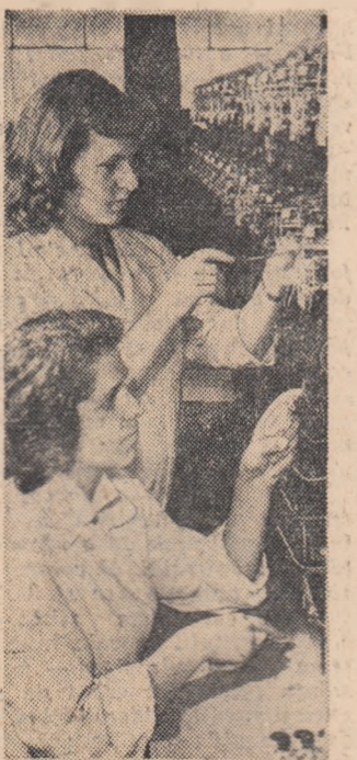
Tineretele Dimbol Elena și Soos Elena de la Uzinele „Grigore Preoteasa” din Capitală, lucrează la etalonarea cantorilor. Lucrul executat de ele este de cea mai bună calitate.