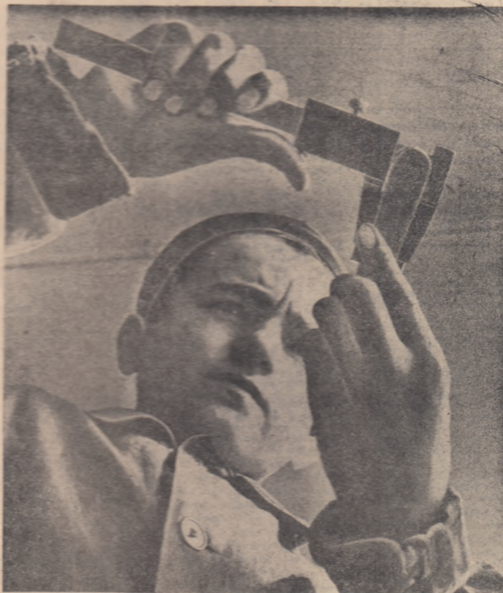
La începutul meseriei...