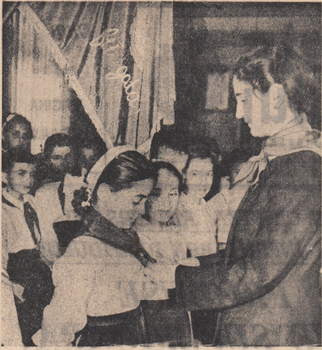
În Muzeul de istorie a partidului, într-un cadru solemn, au fost primii în organizația de pionieri...