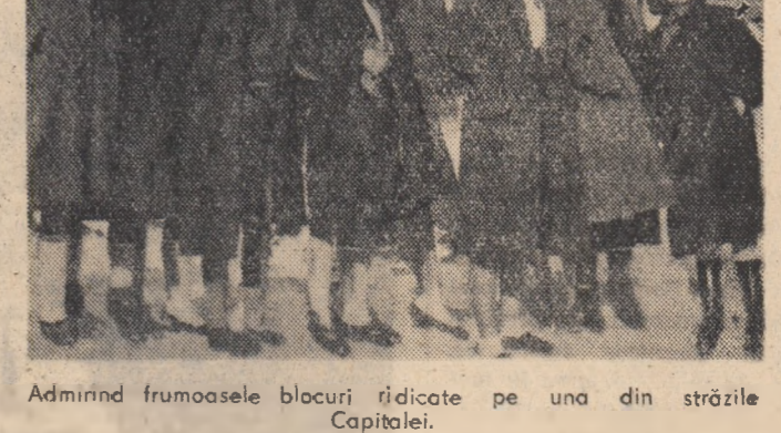
Admirând frumoasele blocuri ridicate pe una din străzile Capitalei.