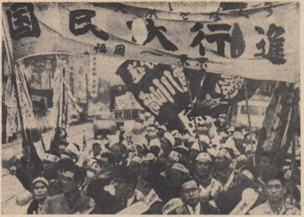
La 4 martie a.c. s-au întrunit la Tokio circa 70.000 de mîneri pentru a lua parte la deschierea acțiunii unite a muncitorilor în vederea mării salariilor și îmbunătățirii asigurărilor sociale. În fotografie: Sosirea la Tokio a unui grup de mîneri din Kyushu.

● Combinatul industrial, unul din cele mai mari întreprinderi industriale din R.P. Mongolia, va da anul acesta o producție în valoare de 89,4 milioane de tugrici. În comparație cu anul trecut producția globală a combinatului industrial va crește cu 36,6 la sută. În cinstea celei de-a 40-a aniversări a revoluției populare colectivei combinatului industrial și-a luat angajamentul să producă suplimentar 15.000 metri de pîisă, 18.000 perechi de cisme de piele, 9.000 metri de țesături etc.