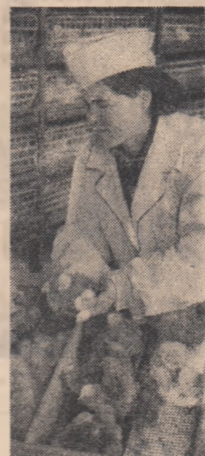
Tînăra Dumitru Tîncea de la Centrul avicol Mihăilești, raionul Drăgănești-Vlașca, regiunea București, se ocupă cu grijă de creșterea puilor în boteții.

• Gospodăriile agricole de stat din regiunea Oltenia au înșămîntat cu culturi din epoca I peste 70 la sută din suprafețele prevăzute. Semănarea mazării și ovăzului a fost terminată. Concomitent cu înșămîntările se desfășoară intens și celelalte lucrări agricole de primăvară. În gospodăriile agricole de stat a fost arată peste jumătate din suprafața prevăzută, lucrările de îngrijire a ogoarelor de toamnă au fost executate în proporție de 90 la sută, iar la semănturilor de toamnă de 60 la sută. • Colectivii din regiunea București au terminat înșămîntarea mazării, orzului și