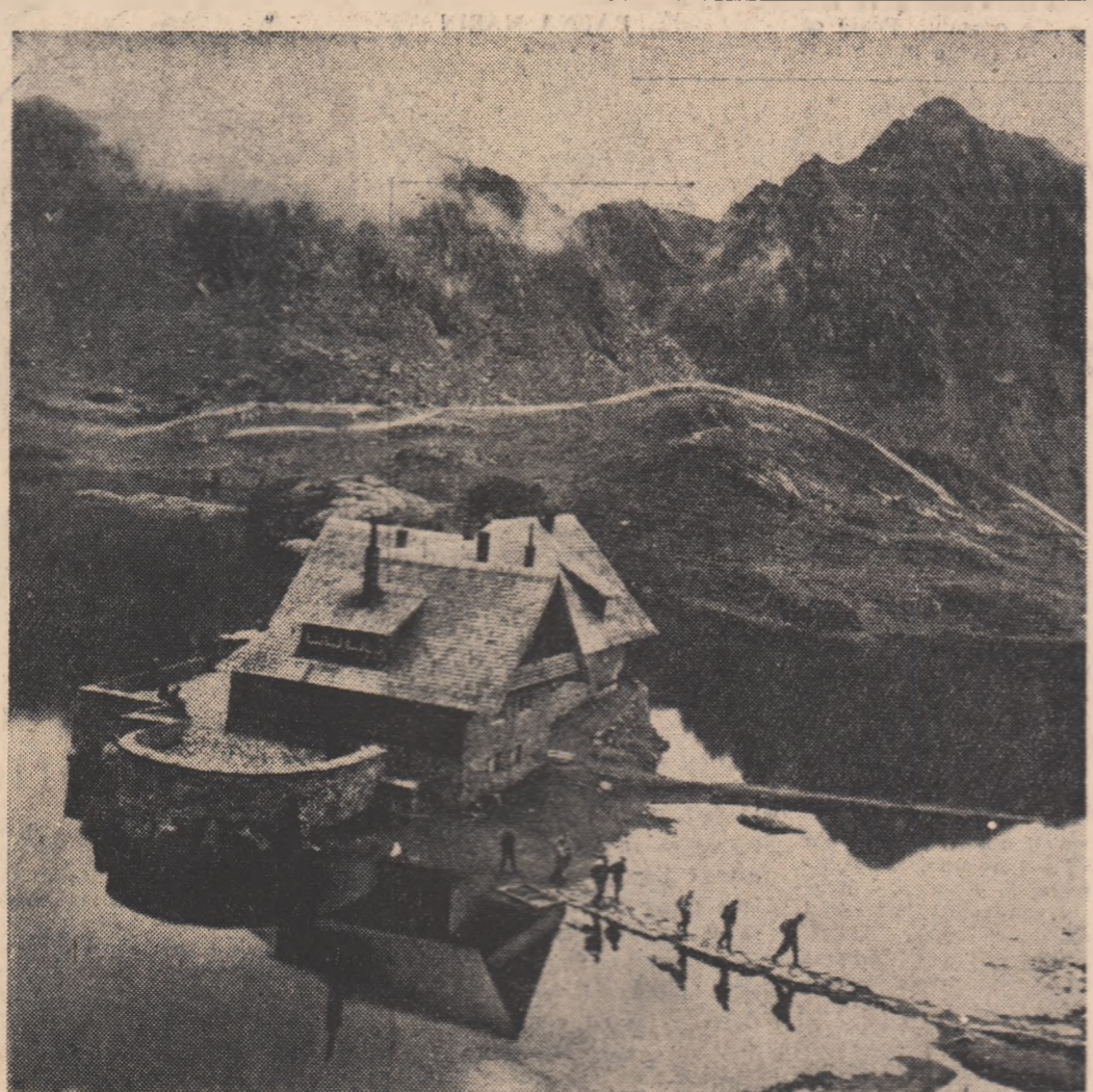
Cabana - Bileu - loc (Munții Făgăraș).

La secția forjă a Uzinelor „Wilhelm Pieck” a fost extinsă în ultimul timp forjarea în matrițe. Peste 150 de repere sint acum forjate după acest modern procedeu care prezintă multe avantaje economice. Așa, de pildă, forjarea în matrițe permite obținerea la fiecare reductor de 600 Kw o economie de metal de peste 2000 kg; calitatea pieselor este superioară celei obținute prin forjarea liberă. Această metodă este aplicată acum la forjarea tuturor pieselor necesare excavatorului de 0,3 mc. Ca urmare a folosirii metodelor noi de muncă, forjorii de la Uzinele „Wilhelm Pieck”, realizează acum produse de calitate mai bună, iar economiile peste plan realizate în luna februarie se ridică la 70.000 de lei.