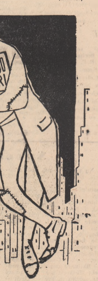
NOUL GULLIVER - Desen de V. VASILIU

Pe zi ce trece, crește numărul șomerilor în S.U.A. (Ziarele)