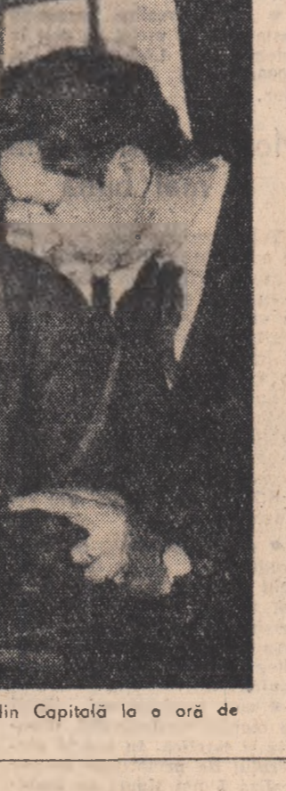
Elevii de la Școala profesională a întreprinderii „Electroaparataj” din Capitală la o oră de practică.