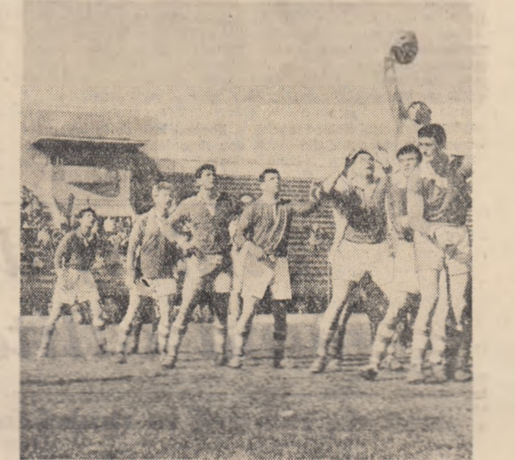
Întîlnirea de rugbi: Rapid-Dinamo, desfășurată pe stadionul Giulești, a fost apreciată de spectatori pentru valoarea tehnică, dar mai ales pentru disciplina exemplară a jucătorilor celor două formații.

contribuția la victoriile reputeate în ultima vreme de către handbalul românesc. — Cum a fost apreciată evoluția și victoria handbalistelor bucureștene de către publicul spectator? — În general bine. Am primit un sprjin real din partea celor peste 100 de turiști români prezenți la întîlnire, care ne-au încurajat și susținut frenetic de-a lungul întregii partide și îndeosebi atunci cînd eram conduși. Aș putea spune chiar că „galeria” noastră a învins „galeria” pragheză. — Specialiștii în handbal prezintă la această ultimă partidă a competiției cum apreciază victoria echipei Știința? — Cu toții sînt unanimi în afirmarea că am realizat o victorie meritată. FRANTISEK BOCEK, președintele federației de handbal din R. S. Cehoslovacie, de pildă, a avut numeroase cuvinte de laudă la adresa handbalistelor bucureștene, declarînd: „Cupa Campionilor Europeni se află în mîni bune și de nădejde. Această victorie este o măriturie elocventă a progresului înregistrat de handbalul în 7 în Republica Populară Romîni. Dacă veți merge pe aceeași linie și mai departe, veți obține, fără îndoială, alte succese de prestigiu.”