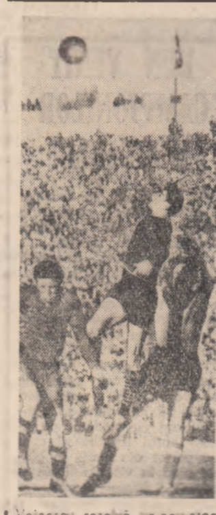
Valeșcu rezolvă un nou atac al formației conștanțene „Farul”.

Prima etapă a returului campionatului de fotbal a adus pe stadioane un mare număr de spectatori. Iată o imagine concludentă în acest sens de pe stadionul „23 August” din București.