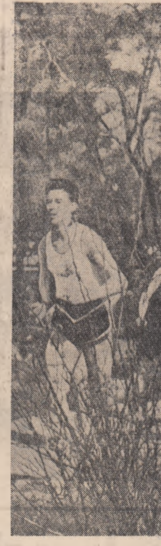
Stadionul Tineretului a găzduit duminică o interesantă întrecere de curs dotată cu „Cupa Școlarului”. Imaginea noastră vă prezintă finiișul probei rezervată juniorilor de categoria I.A.