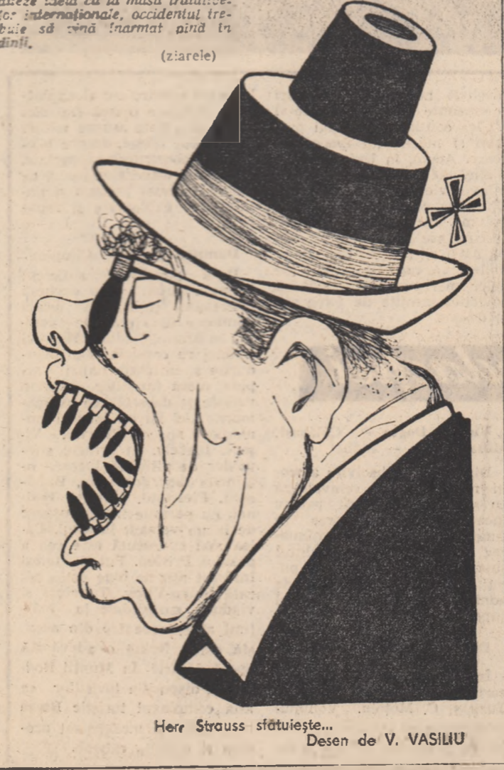
Herz Strauss sfîștiește... Desen de V. VASILIU

Mitingul a fost organizat din inițiativa „grupului celor 13”, grup de fruntași ai vieții publice și politice, care se pronunță împotriva stocării armei atomice pe teritoriul Norvegiei.