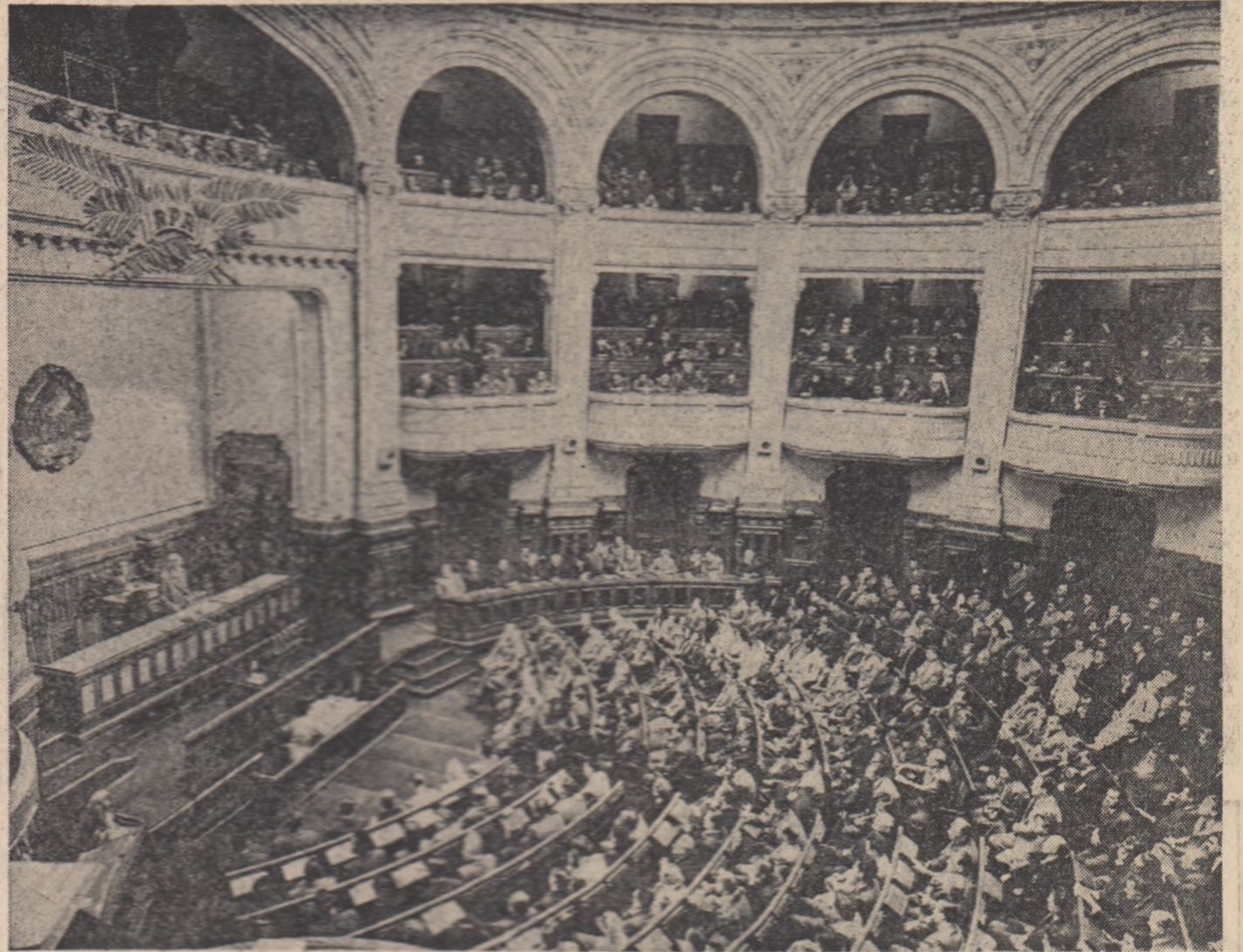
Un aspect din sesiă