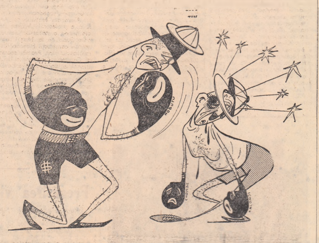
În biiciul marionetelor colonialiste din Congo. Desen de V. VASILIU