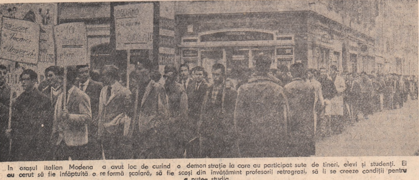
În orașul italian Modena a avut loc de curînd o demonstrație la care au participat sute de tineri, elevi și studenți. Ei se creează condiții pentru reformă școlară, să fie scoși din învățămînt profesorii retrograzi, să a pteag studiu.

IERUSALIM 3 (Agerpres). — Procesul criminalului de război nazist Adolf Eichmann a continuat miercuri cu audierea martorilor acuzării. Au fost evocate noi crime monstruoase ale nazistilor, precum și rezistența eroică din ghetoul Varșoviei și din alte ghetouri și lagăre de exterminare. Martora Zvia Lubotkin-Zuchermann, a subliniat că ideea rezistenței împotriva călăilor nazisti a apărut în ghetoul Varșoviei atunci cînd o imensă speranță s-a născut datorită ofensivei Armatei Sovietice. Martorii și-au exprimat totodată recunoștința pentru faptul că au fost eliberați din ghiarele fiarei naziste de către glorioasa Armată Sovietică. Tribunalul a hotărât să ceară autorităților din Germania occidentală să culegă mărturiile în legătură cu rolul jucat de Eichmann în exterminarea a milioane de oameni de la criminalii de război nazisti Alfred Six, Max Merten și Hermann Krume, care dacă ar veni pe teritoriul israelian ar risca să fie arestați pentru crime de război. Primii doi trăiesc nestingheriți în Germania occidentală, iar cel de-al 3-lea a fost arestat cu puțin înainte de începerea procesului Eichmann. Observatorii prezenți la proces au remarcat faptul că în