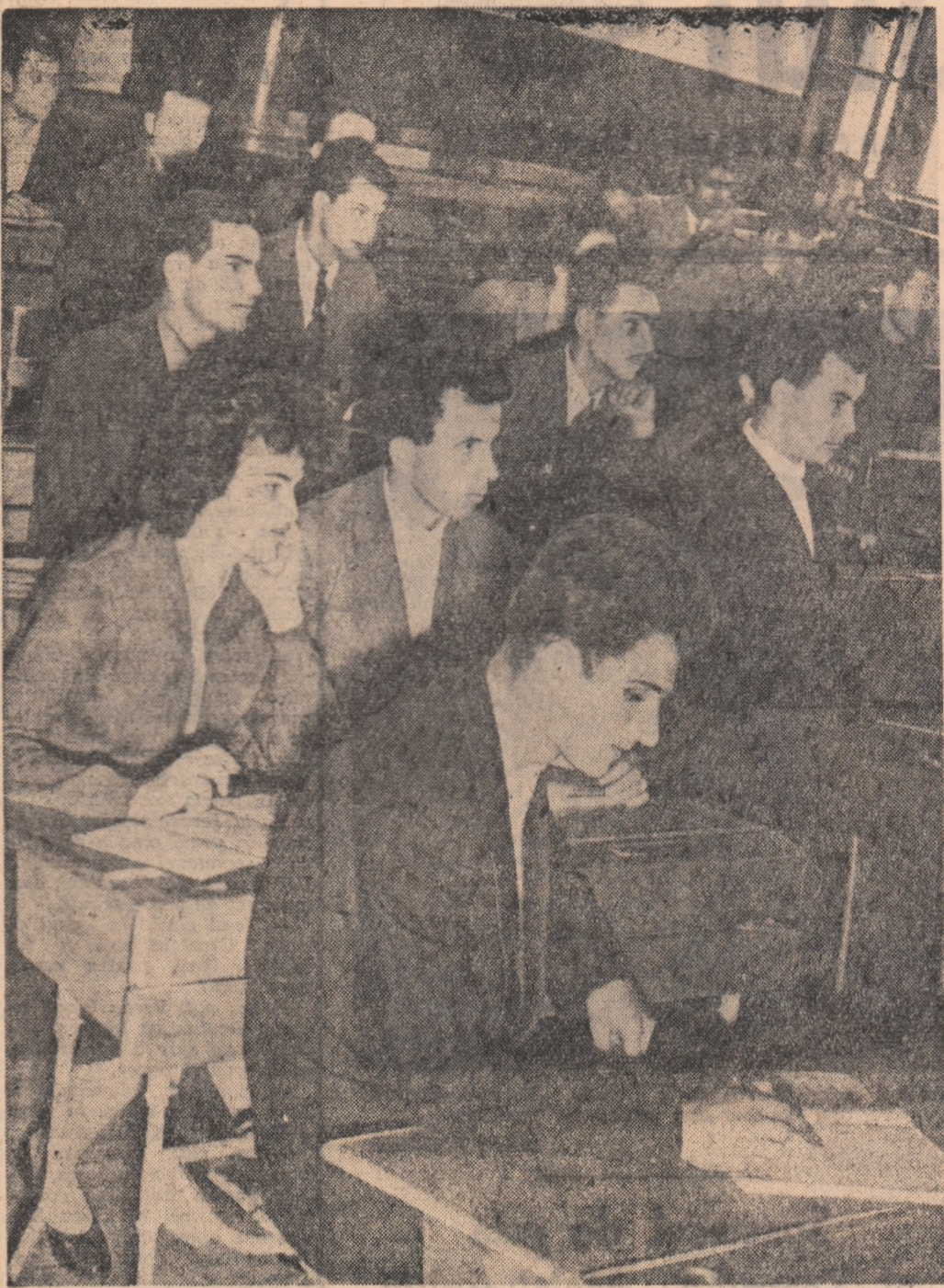
Tineri muncitori la cursul de pregătire de la Institutul politehnic din București