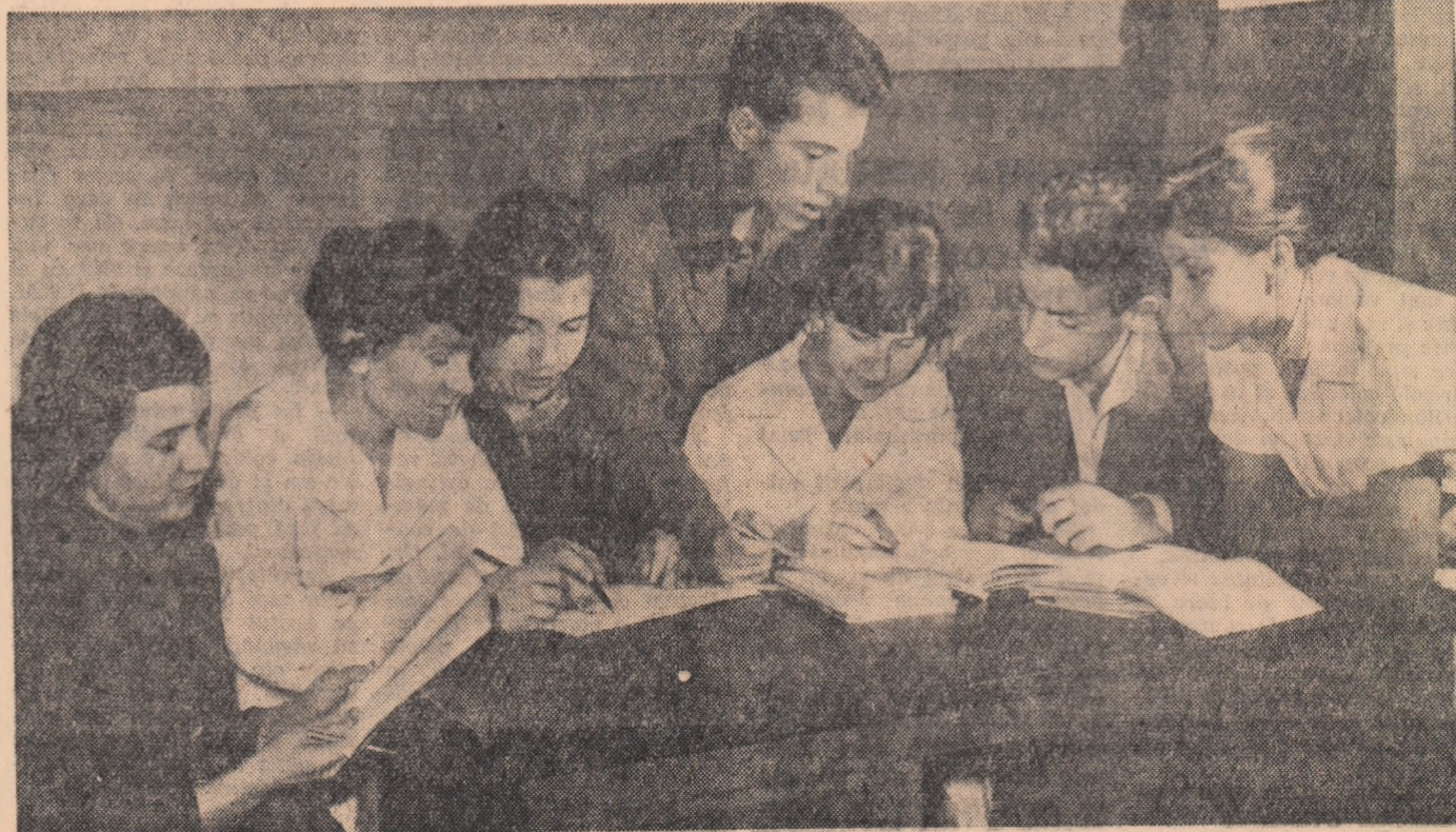
Pregătiri în Uzinele „Grigore Preoteasa” din Capitală pentru intrarea la școala medie serală