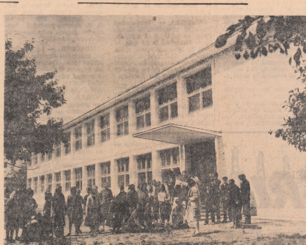
Noua școală medie mixtă din Filiași, regiunea Oltena.