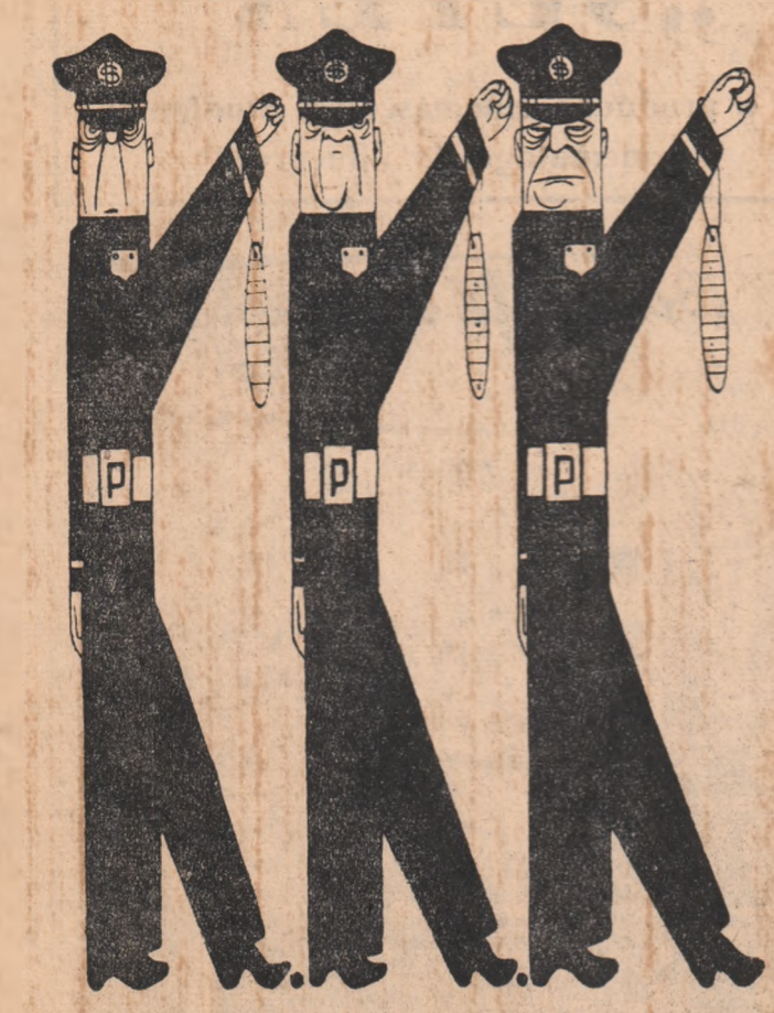
POLIȚIA AMERICANĂ DIN ALABAMA ÎN EXERCITIUL FUNCȚIUNII (desen de V. VASILIU)