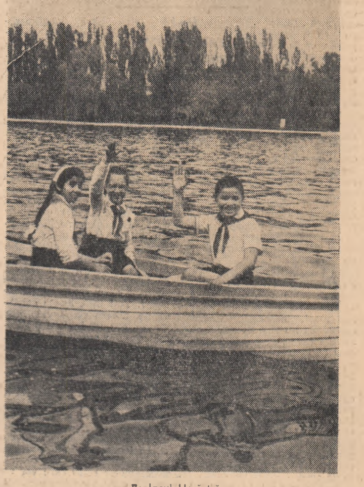
Pe lacul Herăstrău.