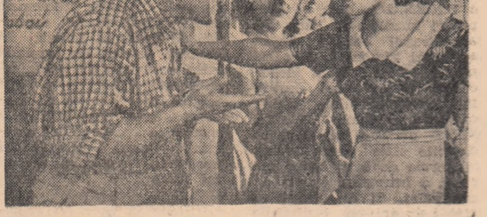
O producție a studioului „A. Dovjenko” din Kiev