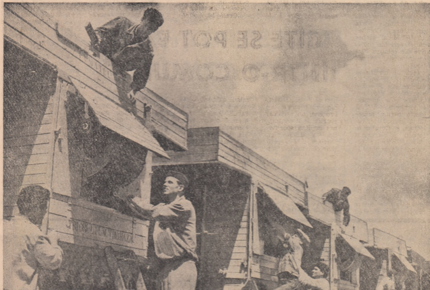
La S.M.T. Grădiște, raionul Uzicieni, s-au terminat reparările mașinilor agricole care vor lucra în campania de recoltare. În fotografie: ultimele revizii după modelul botozelor