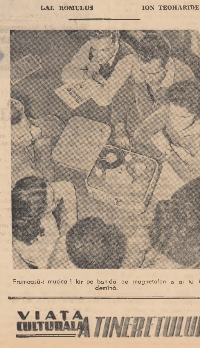
Frumosă-i muzica! Iar pe bandă de magnetofon o ai la îndemînă.