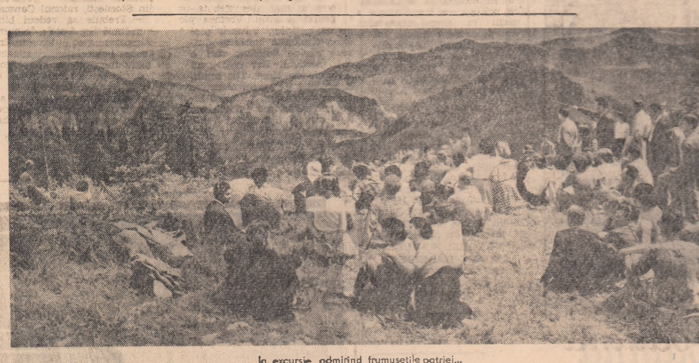
În excursie, admirînd frumusețile patriei...

portant în duminicile tineretului organizate de noi îl ocupă programele formațiilor artistice. O parte din aceste programe vă prezentăm azi. Cîntecele închinat patriei și partidului cu și cîntecele populare, programul brigăzii artistice de agitație au plăcut într-adevăr mult nu numai pentru precizarea cu care au fost interpretate ci și pentru conținutul lor bogat și educativ.