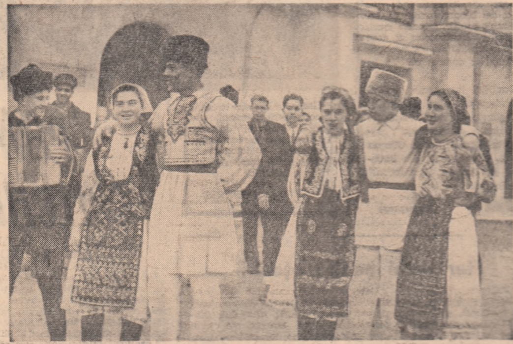
Comuna Slobozia Mîndra: tinerii se întorc de la un spectacol.