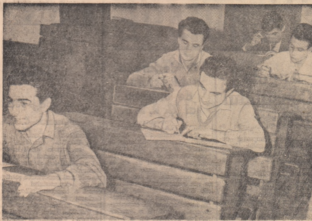
Pentru examenul de socialism științific studenții anului I de la Institutul politehnic din Copăceni s-au pregătit cu seriozitate