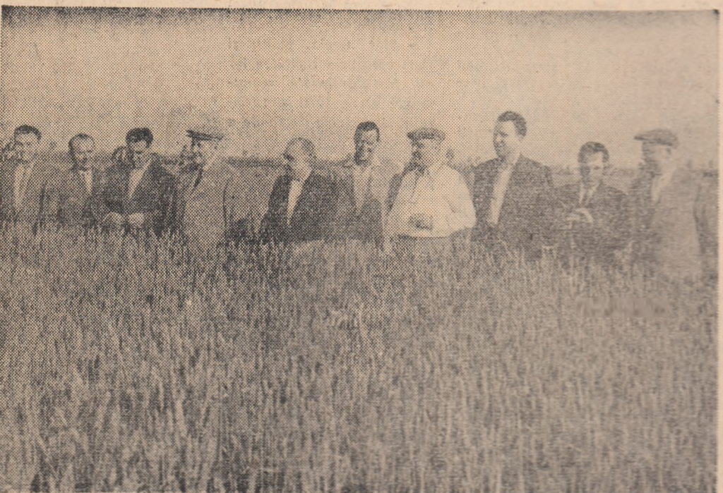
La Gospodăria agricolă de stat = Grobăț