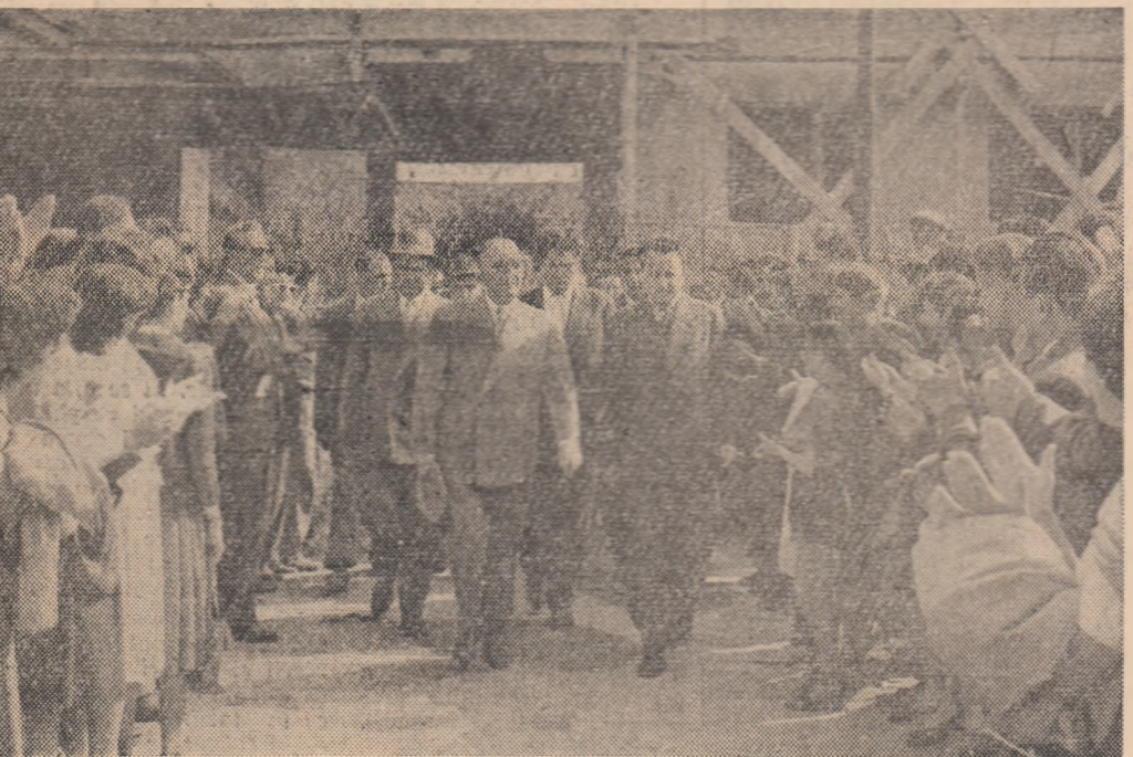
Vizitând șantierul de construcții de locuințe din Arod.