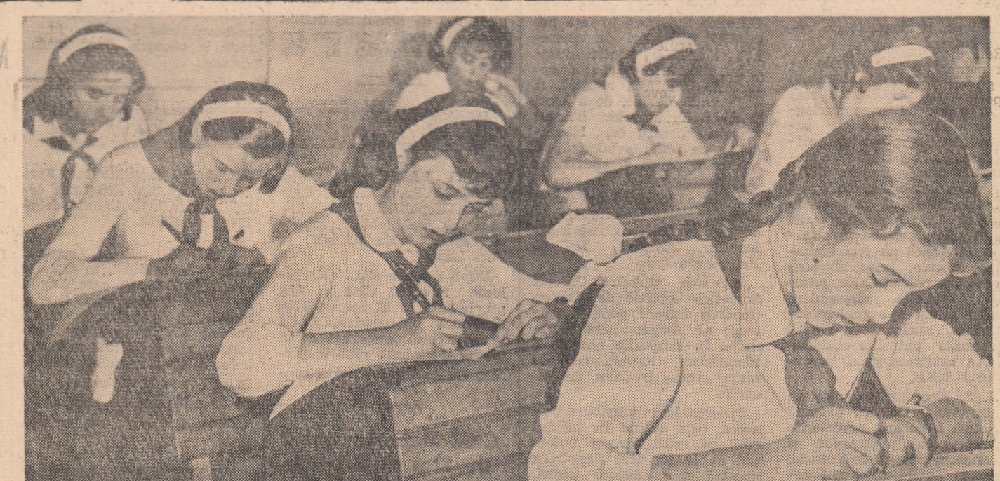
Duminică a început examenul de admitere pentru clasa a VIII-a a școlilor medii. În fotografie, un aspect de la lucrarea scrisă la matematici de la Școala medie nr. 18 „Mihail Eminescu” din Capitală.