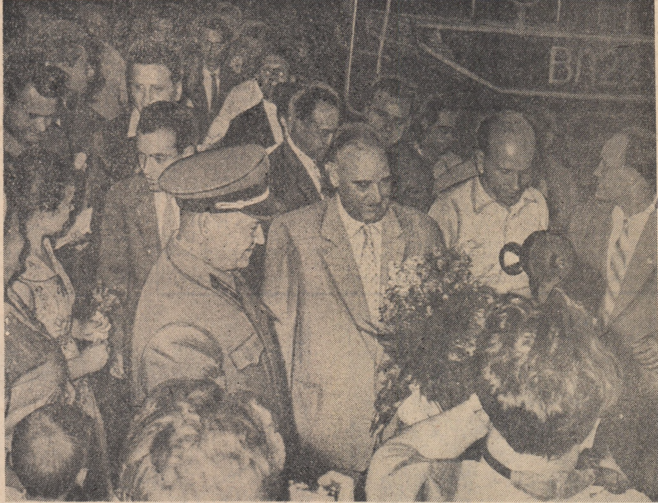
În timpul vizitei la depoul de locomotive „Moscova-Triași”