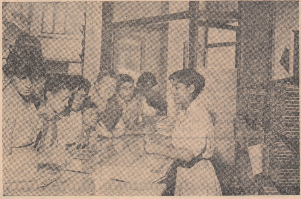
Au sosit noile manuale școlare.

La Forum, tineri din 105 țări ale lumii s-au pronunțat. Pentru unitate în apărarea păcii! Mesajul participanților la Forum adresat tineretului lumii Marea întâlnire a tineretului lumii a luat sfârșit.