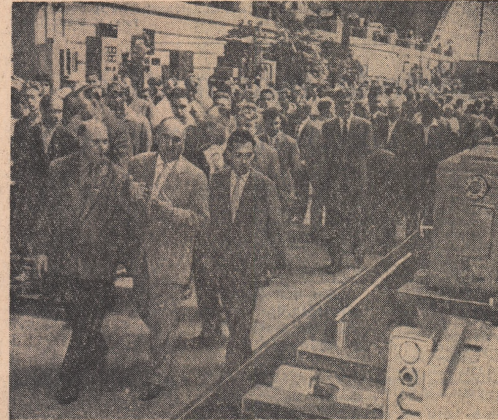
Delegația de partid și guvernamentală a R. P. Romine în vizită la unul din pavilioanele Expoziției.