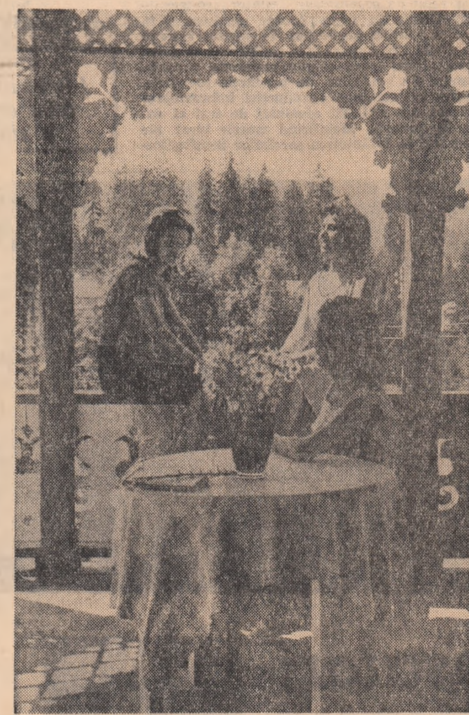
Borsec: studenți la odihnă.