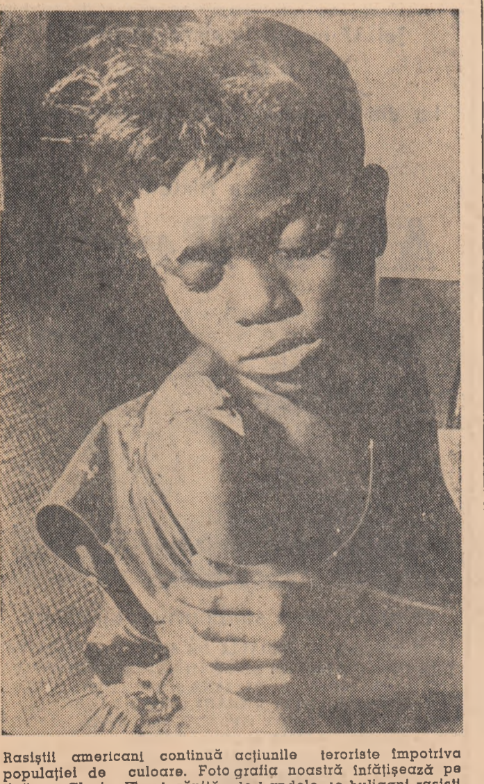
Răsiștii americani continuă acțiunile teroriste împotriva populației de culoare. Foto grafică noastră înfățișează un înăra Glosa Floyd rănită de bandede de huligan răsiști

La această părere s-a raliat conducătorul ad-interim al delegației Partidului Neo Lao Haksat, generalul de brigadă Sipasat. El a subliniat că Partidul Neo Lao Haksat a sprijinit și va sprijini politica de pace și neutralitate promovată de prințul Suavana Fumma.