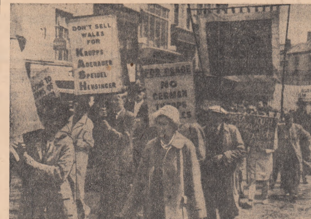
Demonstrație în Anglia împotriva hotărîrii guvernului de a pune la dispoziția trupelor Bundeswehrului terenuri pentru instrucție.

Festivitatea a fost încheiată prin cuvîntarea rostită de președintele Seku Ture.