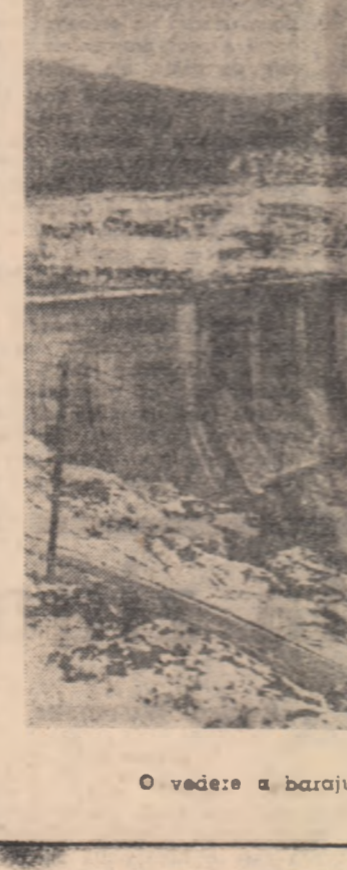
O vedere a barajului de la Orlik. Cea mai mare lucrare hidroelectrică din R.S. Cehoslovacă.