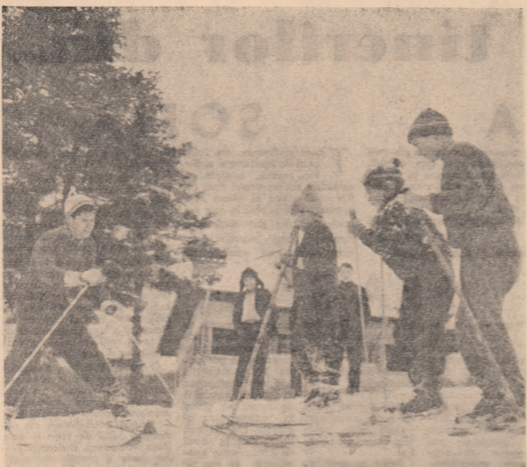
Elevii Școlii de 7 ani nr. 1 din Buzău: se antrenază astăzi pentru Sporiada de copii. Foto: GR PREPELITA

Sahia: Sonate; Fiecare: Abuz de încredere; Arta: Vîrsta dificilă; T. Vladimirescu: Copilul trupel; Miorița: Sosește circul; Munca: Cazacii; Popular: Nu te lăsa niciodată; Moșilor: Ultimul meu tango; 23 August: Sonate; Donga Simo: Ultimul meu tango; 16 Februarie: Defileul; M. Emineanu: Cerul infernului; I. Pintilie: Articolul 420; 8 Mai: Vîrsta dificilă; Volga: Cercul fără cupolă; Floreasca: Te iubesc viață; Libertății: Caidul; N. Bălcescu: Ivan cel Groaznic; G. Coșbuc: Cercul fără cupolă; G. Bacovia: Ultimul meu tango; Olga Bancu: Copilul trupel; Drumul serii: Cele 400 de lovitură; 30 Decembrie: Te iubesc viață; Aurel Vlaicu: Dragostea și pilotul secund; B. Delavrancea: Cînd primăvara e fierbinte/binte.