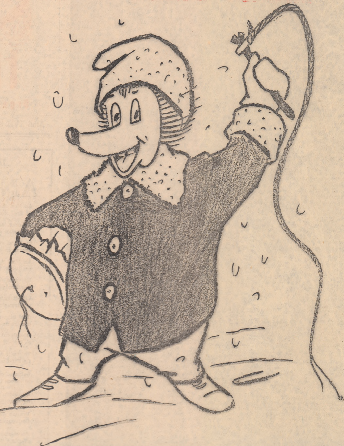
Desen de M. CARANFIL

Urăți și celor făcăți Care cresc turme de oi, Cirezi de vaci roșoare Ce dau lapte mult, kvocare! Care îngrijesc „grășun” Pentru țară tocmăci buni, Care cresc și mil de pui, Gata pentru frigăral! Bun cuvînt și celor care, De pe arie de hectare, Vor să scoată, pe cîi șîi, La porumb, spor curia! O asemenia comoză O aruncă buncăoară, Megîndînd c-aicea-l sporul Căruia-l dau cu piciorul! Alții de-alcăva „bolesc”, Dacă laptele-l înbesc, Și deși hrînză la placă, Au ei un nărav și pace: Pe la grajd n-ar face-o pas Să nu-i supere... la naz Ce-ar fi, cit mai repede, Ast nărav să-și lepede? Agronomii țineri, frate, Cînd pomesc din facultate, Duc dilanța pe ogor Să-l facă mai roditor. Și dau sprijin rodului Chiar la țara localul. Dar, celor străini de țară, Le urăm ca-n nou an Să se-ndrepte spre cîmpie Sub cîntec de clocețe, Unde combina și plugul Zilnic pregătesc belșugul. Să-i dea muncii țînc nou, Iar nu sfatur... din bîra. Să pună mina virtos, La treabă, ca-ș-a-i frumos! Minați măi, Voinici făcăți, Hăi, hăi!