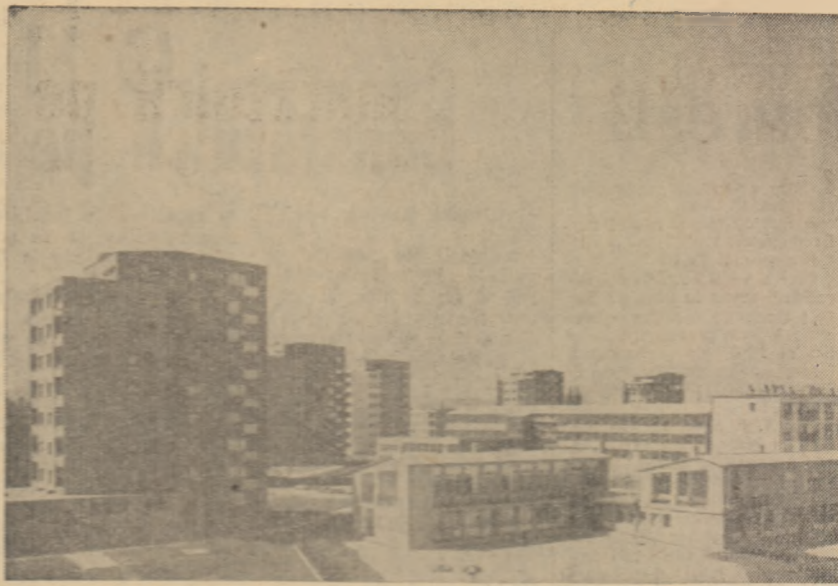
După ce a fost înălțat înălțimea sa, acest modern bloc de locuit cu război pe strada Ullol. Asemenea lor stau multe construcții în capitala ungară

Relevind în continuare că în cei peste 100 de ani care au trecut din momentul apariției „Manifestului comunist” al lui Marx și Engels în lume s-au petrecut schimbări enorme în domeniul științei, tehnicii și dezvoltării societății, N. S. Hrușciov a subliniat că esența capitalismului, ca societate bazată pe exploatarea omului de către om, a rămas neschimbată, iar contradicțiile interne proprii capitalismului au devenit și mai ascuțite.