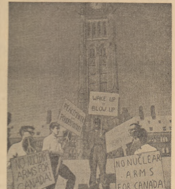
Fotografia de mai sus reproducă după revista canadiană „Advance” reprezintă un aspect de la o manifestație a tineretului împotriva cursei înarmării, a armelor nucleare pe pămîntul Canadei, pentru dezarmare generală și totală, pentru pace

În comentariile sale presa siriană ajunge la concluzia asemănătoare. Ziarul „Al Nasr” arată că lovitură de stat a fost pregătită în urma unei înțelegeri între Camille Chamun, partidul popular social și ambasadorul britanic la Beirut. Eșecul rebeliunii din Liban constituie o nouă lovitură dată imperialiștilor, arată ziarul.