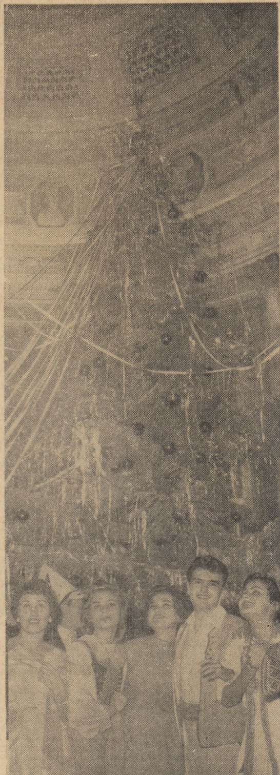
Te întîlnim cu bucurie și optimism, An Nou! Vom munci mai mult și mai bine și viața noastră va fi mai bogată, mai fericită!

(La Carnavalul de la Palatul Republicii, lângă bradul de An Nou)