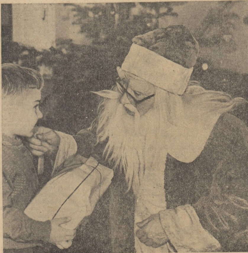
Mil de Moși Gerilă au sosit cu toba plină în aceste zile. În fiecare casă, pretutindeni, Echipa noastră de reportaj l-a înfrînștat prima dată la Cluj

ION GHEORGHE MAURER Președintele Consiliului de Miniștri al R. P. Romine