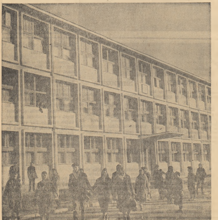
O nouă școală medie în orașul Iași