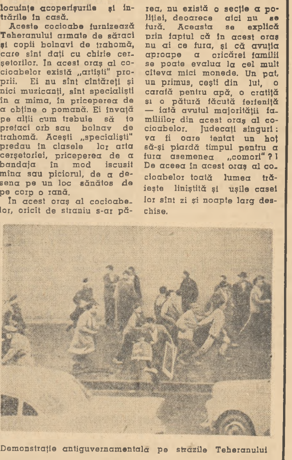
Demonstrație antigvernamentală pe străzile Teheranului

SAARBURUCKEN. — Agențiile de presă relatează că miercuri dimineața la mina de cărbuni „Luisenthal” din Voelkingen în bazinul Saar a avut loc o puternică explozie. Potrivit ultimelor știri în acest tragic accident, care s-a produs din cauza lipsei măsurilor de protecție, și-au găsit moartea 110 mineri, 85 au fost răniți, iar numeroși alții sînt dați dispăruți.