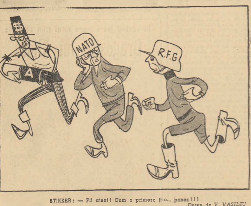
STIKKER: — Fii atent! Cum o primesc și-o... pazez!!! Desen de V. VASILU

rea, nu există o secție a poliției, deoarece aici nu se fură. Aceasta se explică prin faptul că în acest oraș nu ai ce fura, și că avaria aproape a oicărui familii se poate evalua la cel mult cîteva mici monede. Un pat, un primus, cești din lut, o carafă pentru apă, o cratiță și o pătură făcută din țesătură — iată avutul majorității familiilor din acest oraș al cociabelor. Judecați singuri: va fi oare tentat un hoț să-și piardă timpul pentru a fura asemenea „comori”? De aceea în acest oraș al cociabelor toată lumea trăiește liniștită și ușile caselor lor sînt zi și noapte larg deschise.