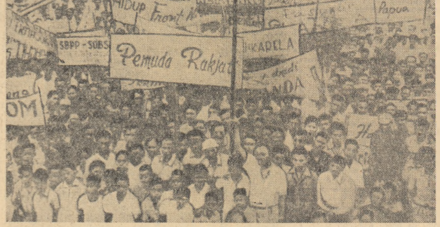
În crăiele și satele indonezilor: cu loc mîngurii ale populației care își exprimă hotărârea de a lupta cu orice preț pentru eliberarea țării de sub dominația imperialistă. În fotografia: aspect de la un mare miting al populației din Surabaya.

Președintele parlamentului Rodopoulos a anunțat că propunerea E.D.A. „va fi studiată și supusă la timpul potrivit discuției în parlament”.