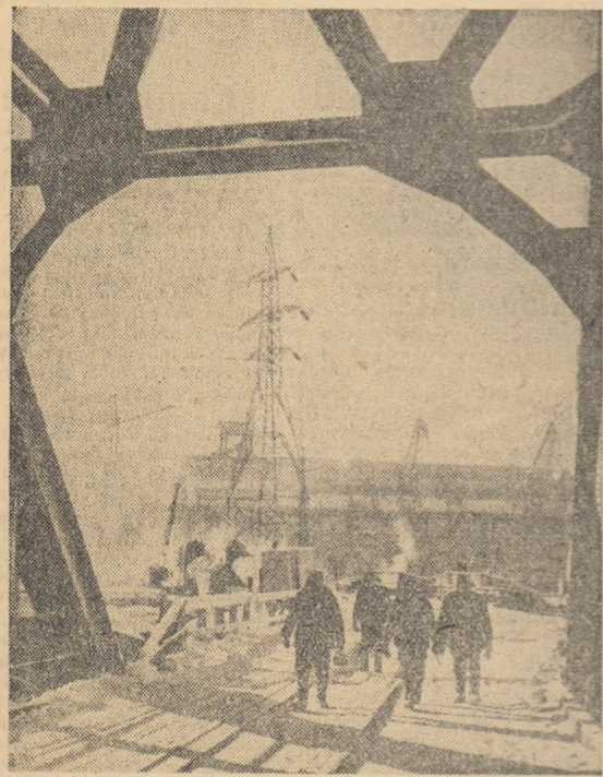
Un nou succes al constructorilor hidrocentralelor de la Buhărin: a fost dat în funcțiune cel de-al 6-lea agregat al acestei mari hidrocentrale care a furnizat până acum circa 900 milioane de k.W/h