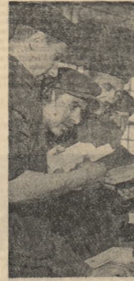
— S-au luat de pe acum măsurile necesare?

— S-au luat de pe acum măsurile necesare? — Da, încă din prima lună a acestui an ne-am îngrijit să avem 3.200 găini matcă ouătoare. Am amenajat cinci puiernice, cu o capacitate de 1.200 pui fiecare, avem cupatoare de încălzit, spații pentru crescătorie. Vom mai construi 2 complexe avicole model. La sfîrșitul acestui luni, celor 3.000 pui care deja au fost scoși li se vor mai adăuga 8.000. În ceea ce privește rasa păsărilor ne-am îngrijit ca