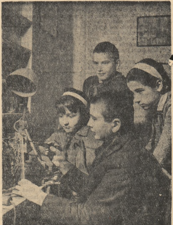
Radioamatori din Școala elementară de 7 ani din comuna Domnești, regiunea București, își petrec multe din ceasurile libere descifrînd tehnica radioului

circumscripție la muncă patriotică pentru înfrumusețarea împrejurimilor stațiunii. Data trecută a fost 50 tovarășii. Acum 100. — Spuneam eu bine că treaba asta de deputat nu-i ușoară. Azi, trecînd pe strada Dumitru Marinescu am fost