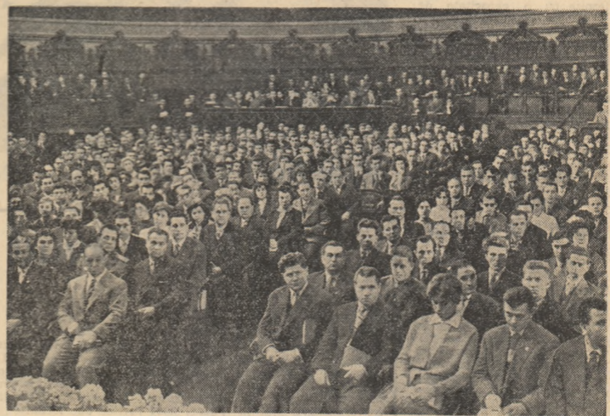
Aspect de la deschiderea Conferinței pe țară a U.C.F.S.