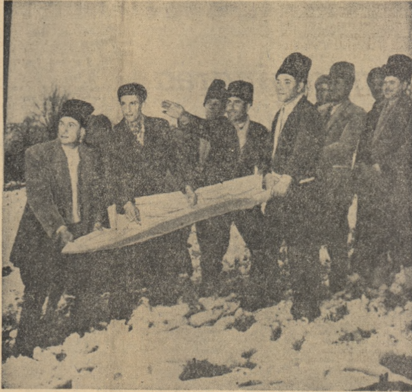
Satul colectivizat își ardește planturi. Din prima zi, membrii noii gospodării agricole colective „3 Mai” din comuna Sîngăroasa, raionul Strehleț, cu hectar și organizate în anul acesta o livadă pe o suprafață de 28 hectare. În fotografie: cu planul la țara locului.