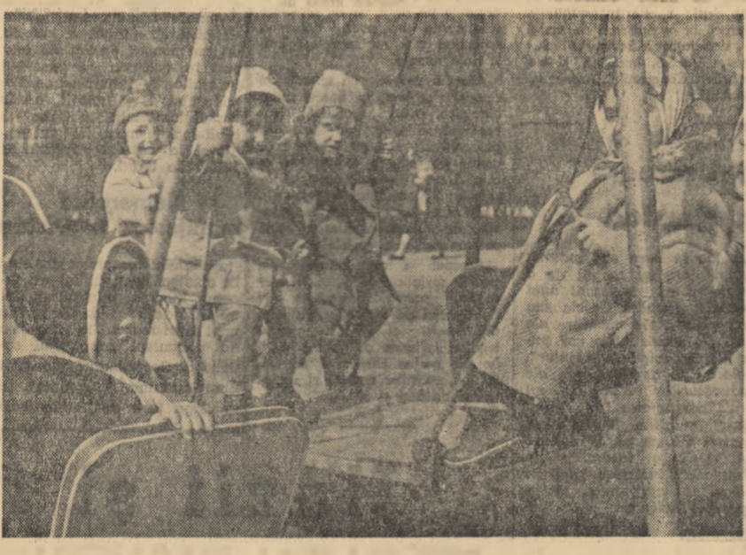
Primăvară în parcu