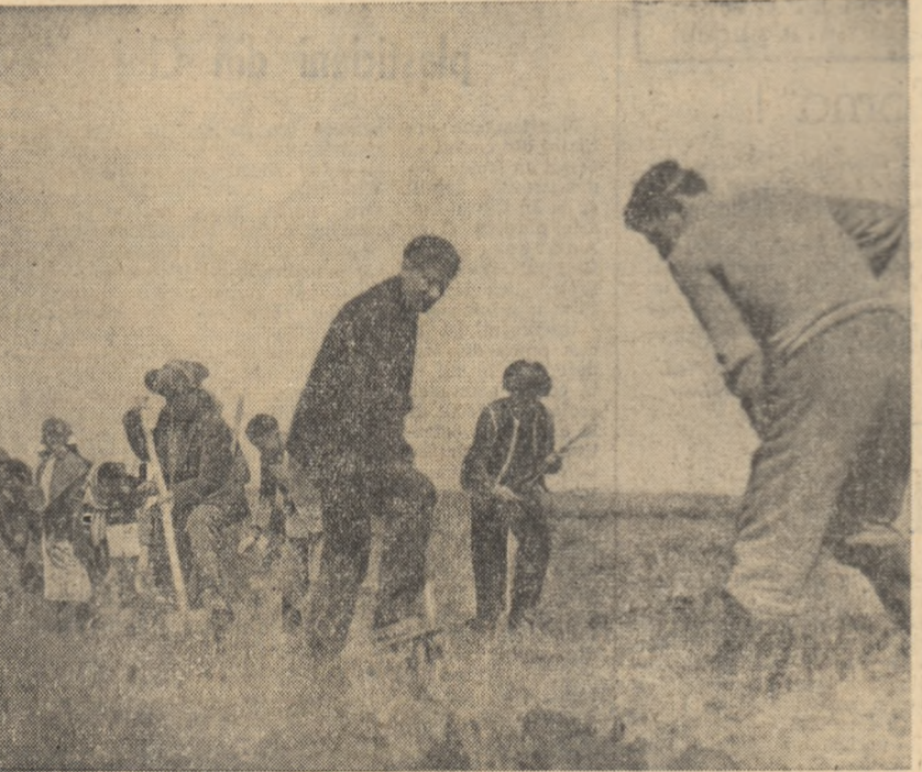
In cadrul acțiunilor de muncă patriotică, tinerii din comuna Tulucești (regiunea Galați) au lucrat la amenajarea plajei lacului Brateș, plantînd numeroși puiți.

Am mers la sediul gospodăriei colective. Paznicul ne-a spus: „A plecat din oraș, dar... A plecat din oraș, dar... A plecat din oraș, dar...”