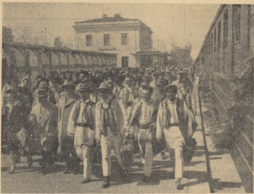
Sosesc invitații din regiunea Oltenia.

— Dar cu porumbul? — Cîi e ceasul? întrebă președintele la rîndul lui. Nouă jumătate. Vasăzică, 7 ori 5... da, pe la prînz sîntem gata. Asta am stabilit aseară în ședință opera-