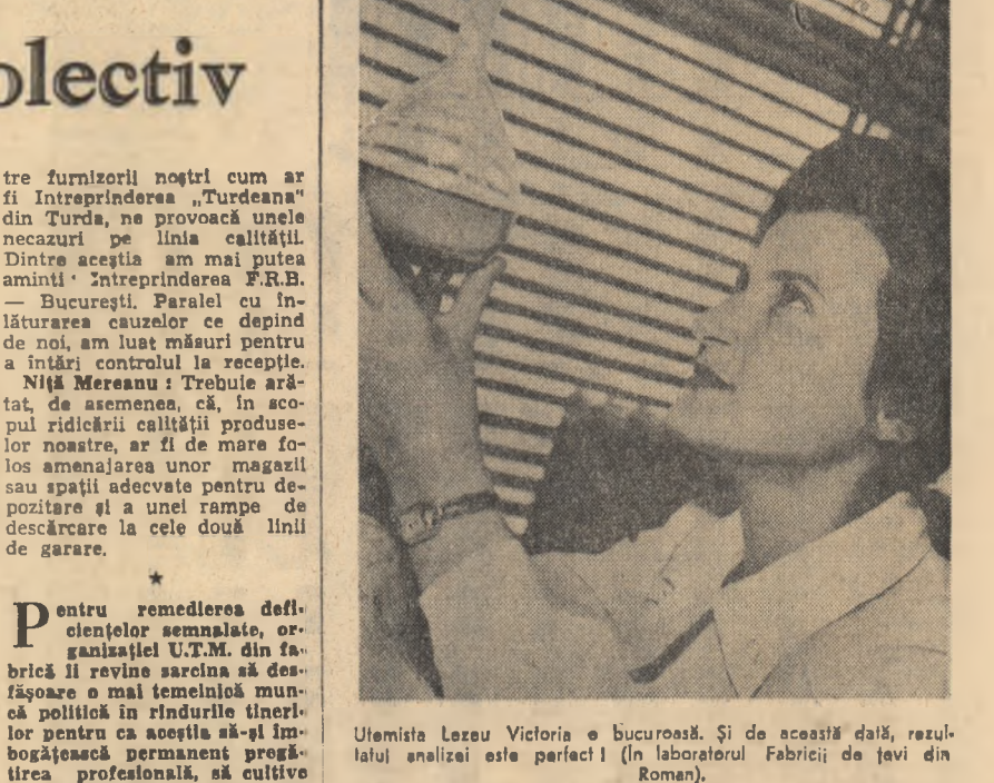
Utemista Lezeu Victoria e bucuroasă. Și de această dată, rezultatul analizei este perfect! (În laboratorul Fabricii de țevi din Roman).

CINEMATOGRAFE Post-restant: Patria, București, Gh. Doja, Volga; Abonament îndelungă: Republica, Elena Pavel, Alex. Sahia, 23 August; Între două iubiri: Magheru, I. C. Frimu; Milano: Florasaca, Libertății; Ultima repriză: V. Alecsandru, Lumina, Mosilor; Program special pentru tineret: Maxim Gorcki, V. Roață, G. Coșbuc; Mizerabilii (ambale serii); V. Roață; Casa sur- priselor: Central, Olga Bancic; Gardianul; Victoria Munca; Pîlciul vrăjitor; Timpuiri Noi; Program special pentru copii (dimineața) — Profesiona doamnei Warren (după amiază); 13 Septembrie; Procesul malmucilor; Tineretul; Expresul de seară; Înfrîngerea între poezie, Flacăra, Miorița; Profesiona doamnei Warren: 1 Mai, Arta.