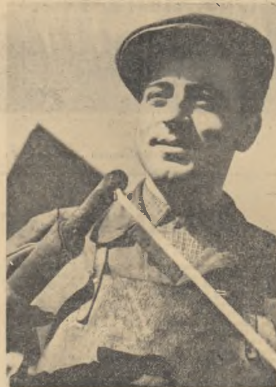
Sudorul Ion Dolofan de la întreprinderea de poduri metalice și prelabricate din Pitești este frunțas în întrecere. Calitatea sudurii executată de el este notată cu calificativul „foarte bine”.