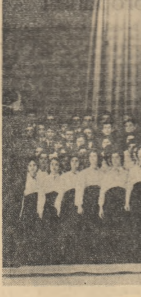
Corul Universității „M. L. Coza” din Iași

Atunci când condițiile impun o prășală mecanică în plus, peste cele trei prășale aplicate, este în interesul sportului producției să se execute și această lucrare.