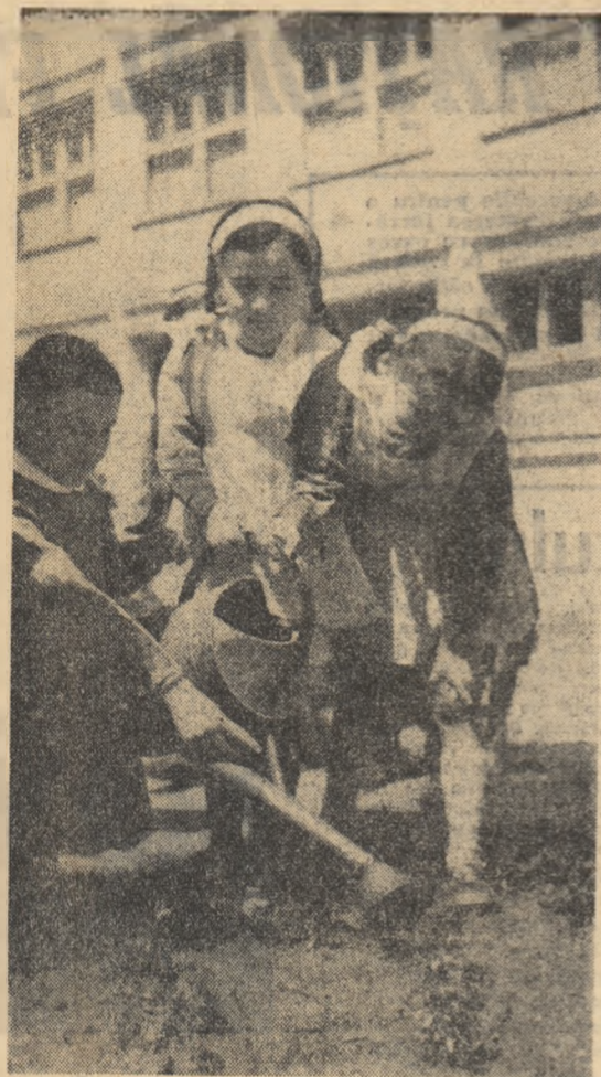
Cei mai mici elevi ai Școlii de 8 ani nr. 4 din Capitală îngrijesc cu drag florile din curtea școlii.

Să folosim rațional fiecare palmă de pământ! (Pagina tineretului de la sate)