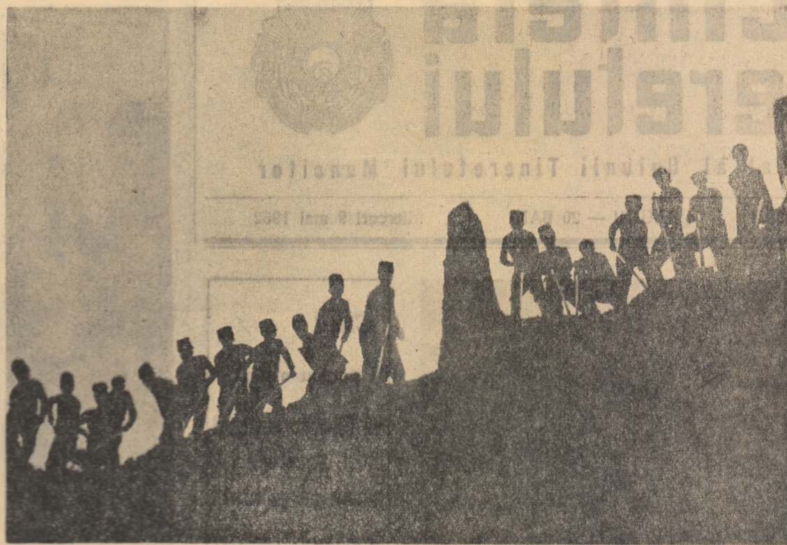
Lucrări de terasare a dealurilor erodate, în vederea cultivării cu viță de vie, la G.A.C. Coșereni, regiunea București.

Cu cît călătorești mai mult prin satele colectiviste ale partitului îți dai seama că hotărîțile partidului privind consolidarea din punct de vedere economic și organizatoric a gospodăriilor colective constituie pentru toți colectivizatorii, tinerii și vîrstnicii, înălțate chemări la noi acțiuni de spore a belșugului pămîntului.