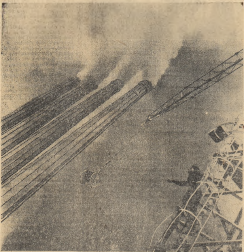
Nai linii tehnologice de fabricație la Fabrica de ciment „Victoria socialistă” din Turda. Constructorii toamă cimentul pe hala marilor.