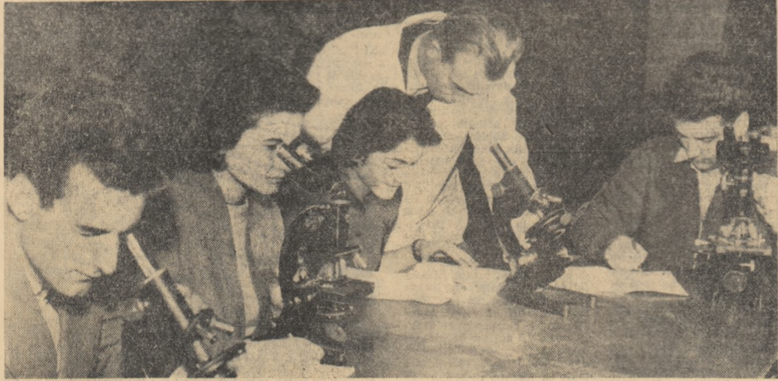
Oră de laborator. Studenții din grupa 111, anul I — agronomie de la Institutul agronomic din Craiova fac experiențe în laboratorul de microscopie.

(În pag. a III-a: conținutul listei câștigătorilor — mențiuni și abonamente).