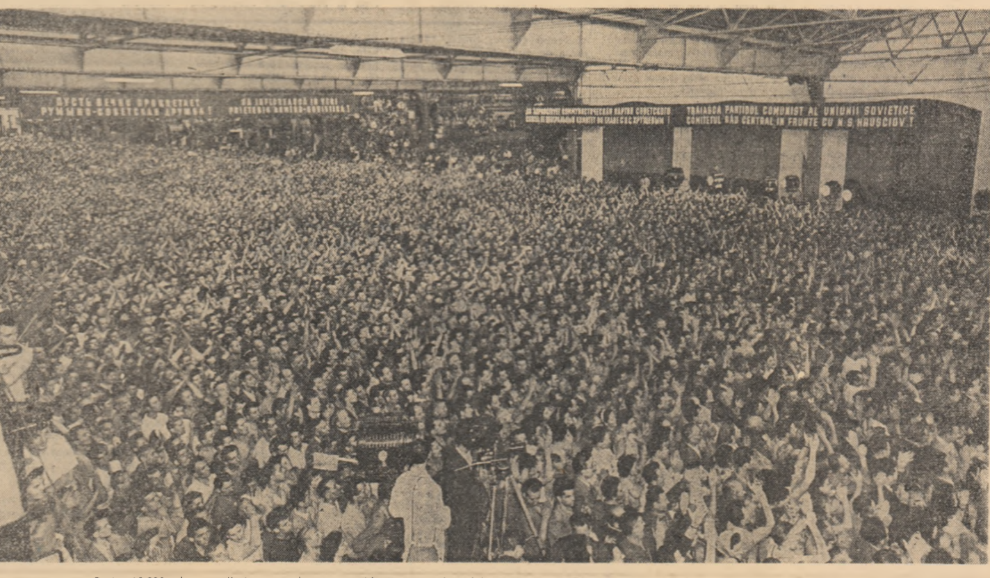
Peste 10000 de muncitori au ezclamat cu căldură pe membrii delegației de partid și guvernamentale a Uniunii Sovietice.