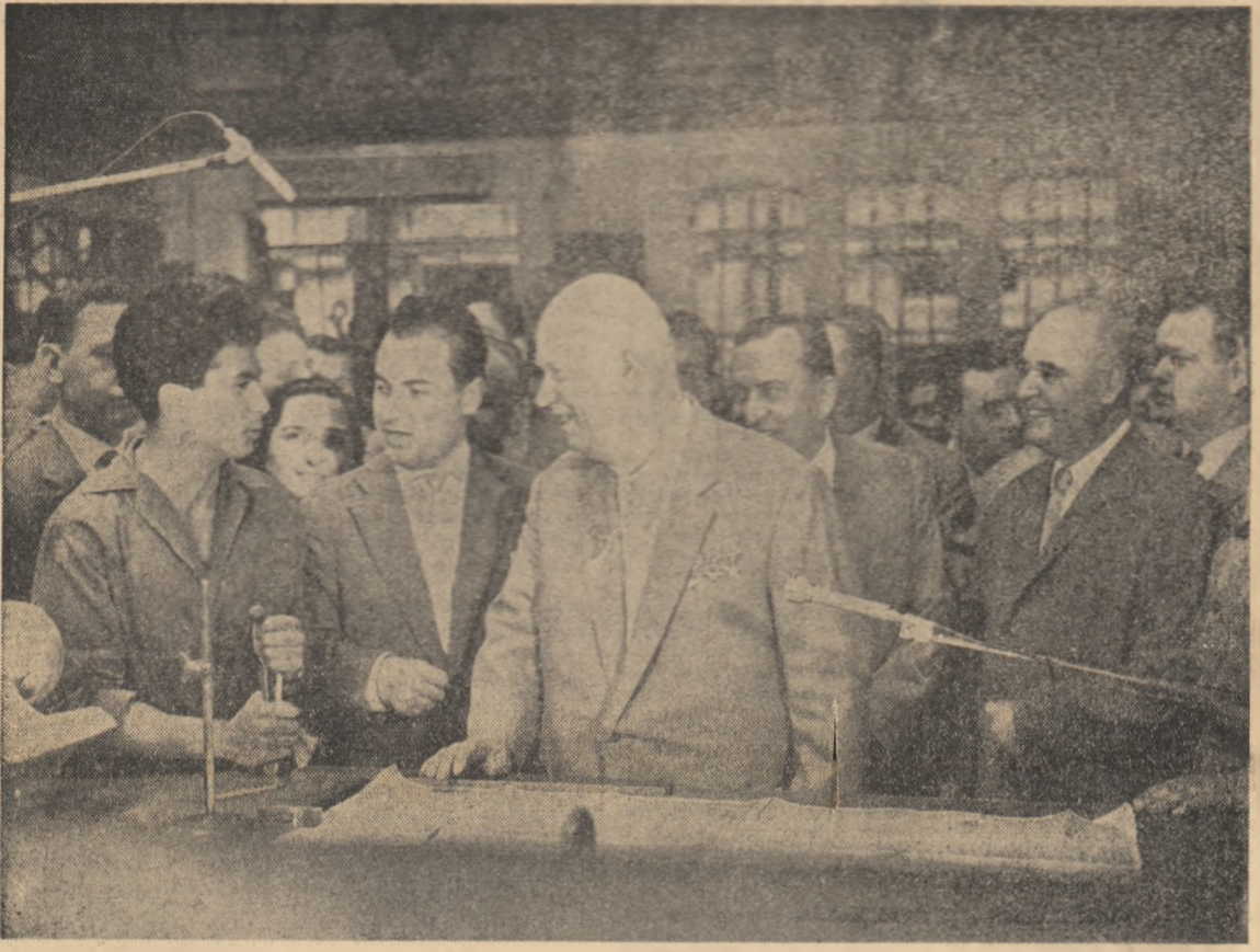
Tovarășul N. S. Hrușciov se interesează îndeaproape de munca și viața tinerilor muncitori de la „Grivița Roșie”.

leri, solii poporului sovietic, în frunte cu N. S. Hrușciov, au fost oaspeții muncitorilor de la Uzinele „Grivița Roșie”, lucrătorilor de la Institutul de Cercetări pentru cereale și plante tehnice de la Fundulea și ai colectivităților de la G. A. C. Ceacu