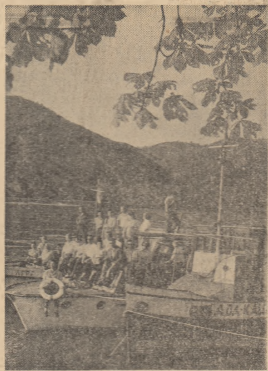
Excursie pe Dunăre