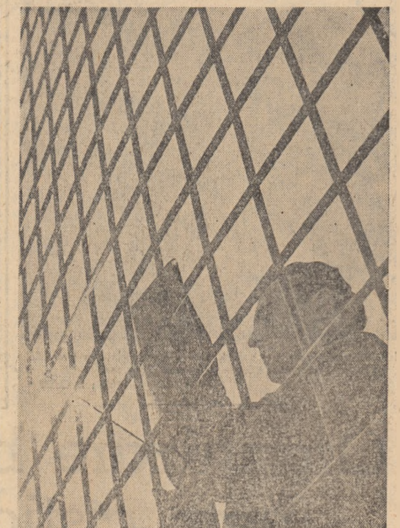
Vasile Rotaru, tînr muncitor la Uzina „Independența”-Sibiu pune în fiecare lucrare ca o execută toată pasiunea și cunoștințele sale. Poate fi de aceea pentru el întoarcerea la muncă din mîndrie cînd sudurile primesc calificativul „foarte bine”.

În dimineața zilei de 26 iunie exploatarea minieră din Lupeni și-a realizat sarcinile de plan pe primul semestru al acestui an. Minerii de aici au extras de la începutul anului și pînă în prezent cu 95.000 tone cărbune cocsificabil mai mult decît în perioada corepunătoare a anului trecut. În comparație cu aceeași perioadă a anului 1961, în acest an producția muncii a crescut cu 7,5 la sută, iar prețul de cost al cărbunelui extras a fost redus cu 3.400.000 lei. Cu o săptămîină înainte, adică la 25 iunie, au raportat îndeplinirea sarcinilor de plan pe semestru I al anului acesta și minerii din Petrița și Aninoasa. La exploatarea minieră