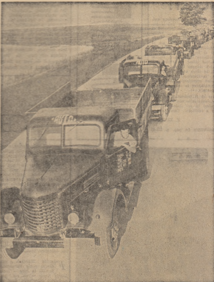
Coloana de autocamioane de la baza I.R.T.A. din Alexandria în drum spre locurile unde se dă bătălia seceriiului.