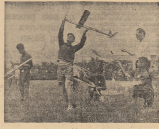
Concurs de aeromodellism pe aeroportul Băneasa.