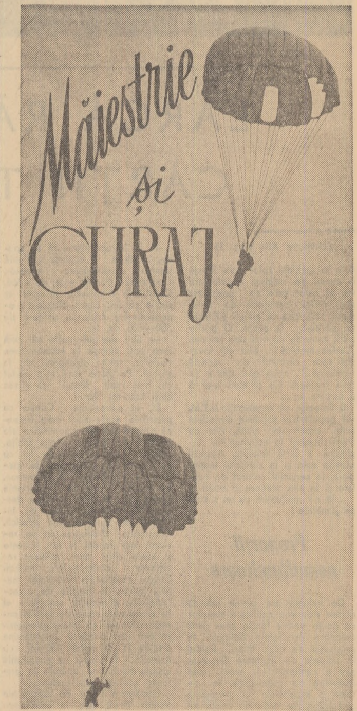
Citiți în pag. II un reportaj de la mîtingul aviativ desfășurat duminică pe aeroportul internațional Băncăsa.

ROMULUS ZAHARIA (Continuare în pag. a III-a)