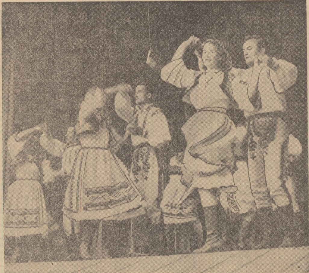
Un aspect din timpul fazei regionale a concursului „Cintec, joc și voie bună” ce s-a desfășurat duminică la Oradea

Spațioase, elegante, unele dintre ele iluminate fluorescent, aceste magazine au creat populației posibilitatea unei tot mai bune aprovizionări cu mărfuri. Numai în primele cinci luni și jumătate, de exemplu, prin rețeaua comerțului de stat și cooperatist au fost desfăcute în această regiune mărfuri a căror valoare înțrece cu 118 milioane lei valoarea celor desfăcute în aceeași perioadă a anului trecut.