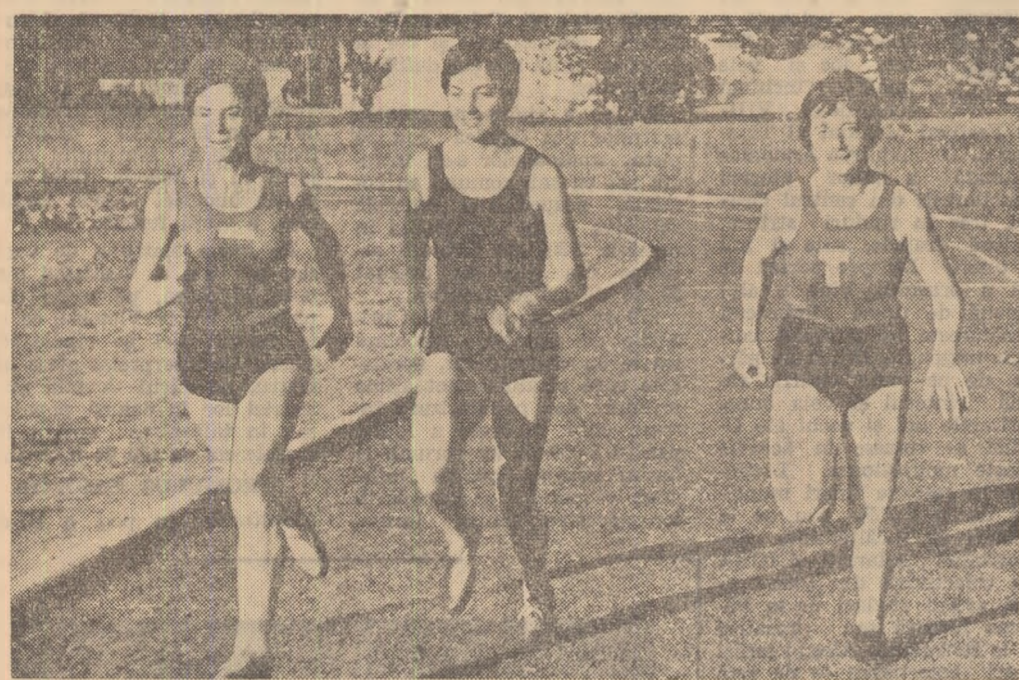
Un grup de atlete timișorene în timpul unui recent antrenament.

Nu se poate trece însă cu vederea că în întreprinderi U.T.M. care subapreciază însemnătatea studiilor literare de specialitate și nu întreprind acțiuni