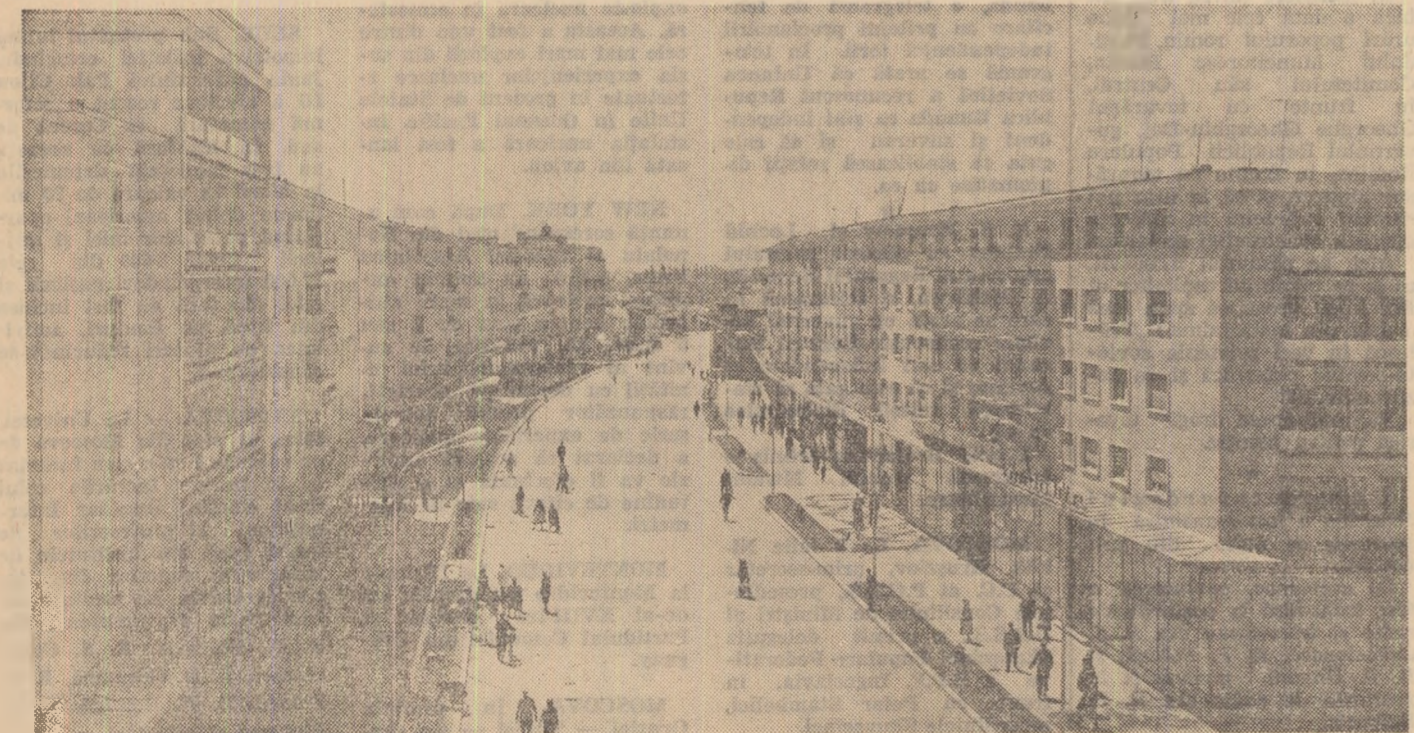
Noi blocuri de locuințe date în folosință la Bacău.

În zilele de sîmbătă și duminică, participanții la cea de-a 27-a Reuniune generală a Comisiei Electrotehnice Internaționale au făcut o vizită la Constanța și în stațiunile Mamaia și Eforie de pe litoralul Mării Negre. La Constanța, oaspeții au vizitat șantiere de construcții ale noulor blocuri de locuințe, muzeul arheologic și acvariumul. Luni au fost reluate lucrările Reuniunii generale a C.E.I. (Agerpres)