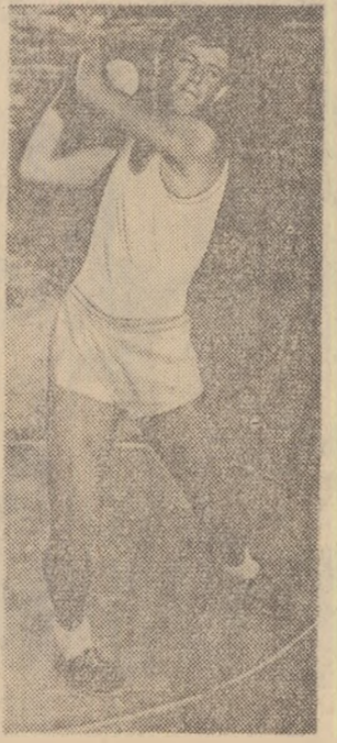
Vă prezentăm două imagini din întrecerile Sparachiadei de vară a tineretului la care și-a disputat înfrîntele membrii C. S. școlar „Banatul”.