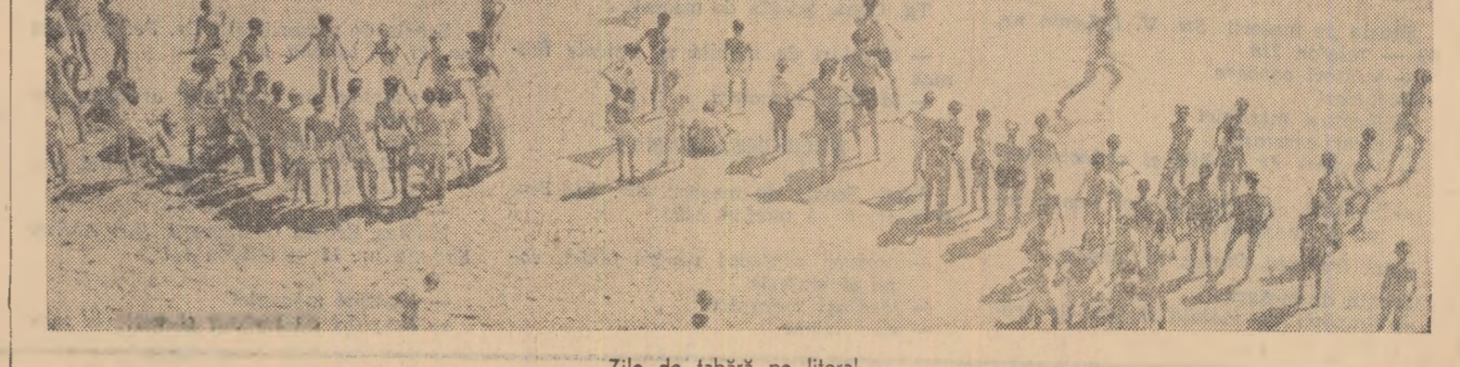
Zile de fabrică pe litoral.

Anul acesta, petroliștii din sectorul de foraj au forat peste prevederile planului 58 de sonde. Obținerea acestui succes de seamă se datorează dezvoltării întrecerii socialiste pentru foraj rapidă și economică a sondelor și extinderii în toate regiunile petroliere ale țării a forajului cu turbina. Aproximativ jumătate din volumul total de foraj a fost efectuat în acest an cu ajutorul turbinelor. Aplicarea acestei metode înaintate de lucru a permis sondorilor să depășească simțitor viteza de lucru planificată și să reducă în acest fel durata de săpare a unei sonde. (Agerpres)