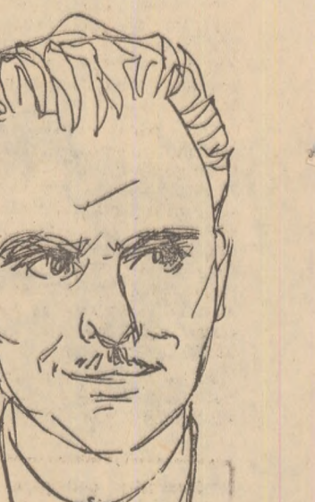
ONEA ION, operator chimist, Săvinești