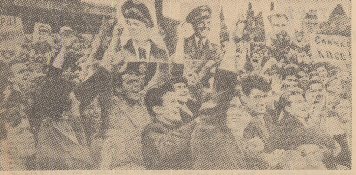
Plaja Roșie — Moscova. Oamenii sovietici salută cu entuziasm zborul în grup al cosmonauților Nikolae și Popovici.

BERLIN 14 (Agerpres). După cum relatează agențiile de presă, provocatorii care operează în Berlinul occidental sub protecția autorităților occidentale de ocupație au întreprins la 13 august noi acțiuni dușmănoase. În unele sectoare ale frontierei cu R.D.G. se adunaseră pîlcuri de huliganți fasciști. Ei au aruncat cu pietre în grînicerii R.D.G. și au proferat injurii. În regiunea punctului de control de pe Friedrichstrasse, a fost atacat un autobuz în care se aflau soldați sovietici și a fost spart cu pietre parbrizul acestui autobuz. Pe Oliverplatz a fost spart o vitrină a clădirii reprezentanței organizației sovietice „Inturiat”. Și în sectorul căii ferate orașenești din Berlin care se află sub administrația R.D.G. au avut loc provocări, care au pus în primejdie întreaga circulație la nodul feroviar din Berlin. În cursul acestor zile, poliției din Berlinul occidental și de la Bonn au rostit numeroase delacursuri, calomnii R.D.G. și celelalte țări socialiste. Un asemenea discurs l-a rostit la 13 august în Berlinul occidental și președintele R.F.C.G., Lubke. Toate aceste fapte demonstrează încă o dată cu toată evidența că menținerea în continuare a Berlinului occidental ca „oraș de front” — cap de pod al N.A.T.O., implică o mare primejdie pentru pace în Europa.