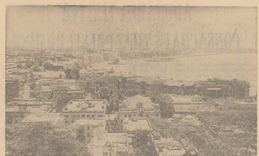
Vedere din orașul Bombay (India)

La 14 august, ora 8 (ora Moscovei), cosmonauții se aflau deasupra emisferei australe. Nava satelit „Vostok-3” efectua cea de-a 47-a revoluție în jurul Pământului, iar nava-satelit „Vostok-4” — cea de-a 31-a revoluție. La bordul navelor continuă observațiile științifice în cadrul programului stabilit. Cosmonauții înregistrează rezultatele acestora în jurnalele de bord și pe benzi de magnetofon și transmit aceste rezultate cu regularitate pe Pământ. Andrian Nikolaev a observat și a filmat Luna. Cosmonauții se simt excelent și sînt bine dispuși. Datele rezultate din observațiile medicale confirmă că ei suportă perfect condițiile zborului. La bordul navelor-satelit a fost transmis un mesaj de salut din partea grupului de zăriași care a condus pe cosmonauți la plecarea în raidul lor cosmic. A. Nikolaev și P. Popovici au mulțumit pentru caldăle felicitări și au transmis un salut cosmic pe Pământ. La ora 13.04 cosmonauții au raportat poporului sovietic, Comitetului Central al P.C.U.S., guvernului U.R.S.S. și lui N. S. Hrușciov personal despre încheierea cu succes a trez zile de zbor cosmic. Ei au mulțumit pentru grija pă-