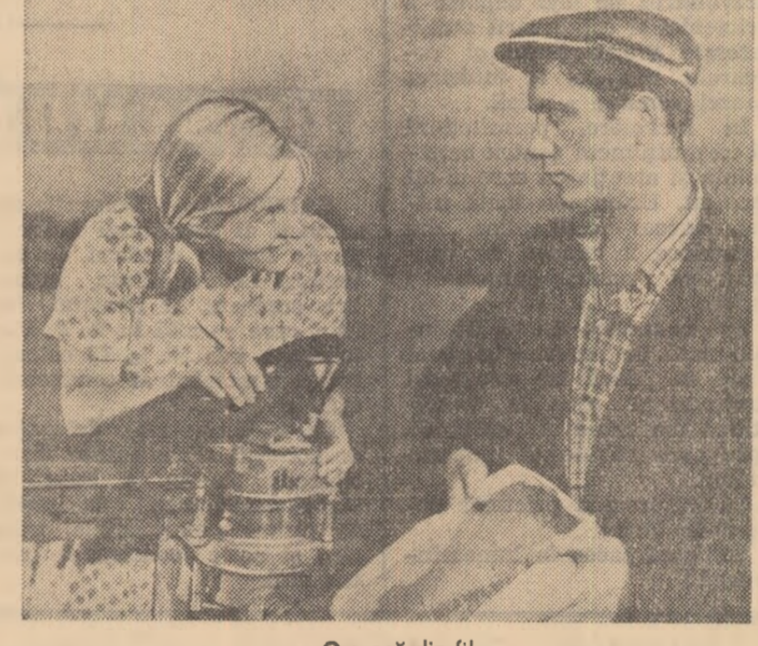
O scenă din film