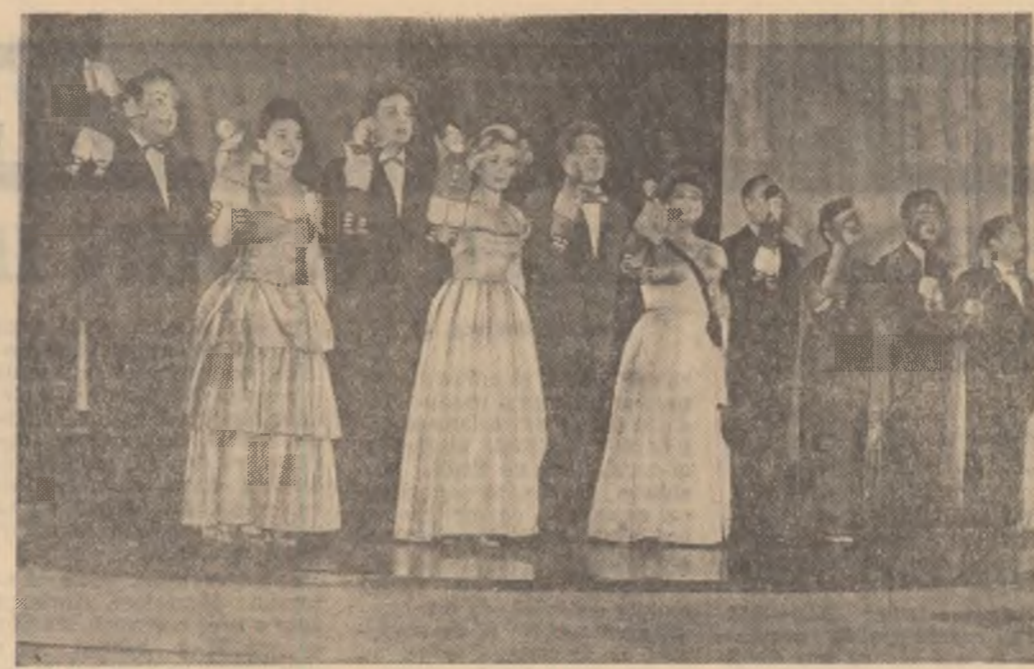
Arcadi Raikin și membrii Teatrului de miniatuiri din Leningrad, pe scena Teatrului C.C.S. din Capitală

Este de datoria comitetelor regionale și orașenești U.T.M. să se ocupe cu toată răspunderea de sprijinirea birourilor și comitetelor organizațiilor de bază U.T.M. nou alese. Încă din prima zi după alegeri ele trebuie ajutate îndeaproape să și organizeze munca, să și întocmească planul de activitate, să mobilizeze la realizarea sarcinilor organizației pe toți utemiștii și, în jurul lor, să atragă masa largă a întregului tineret.