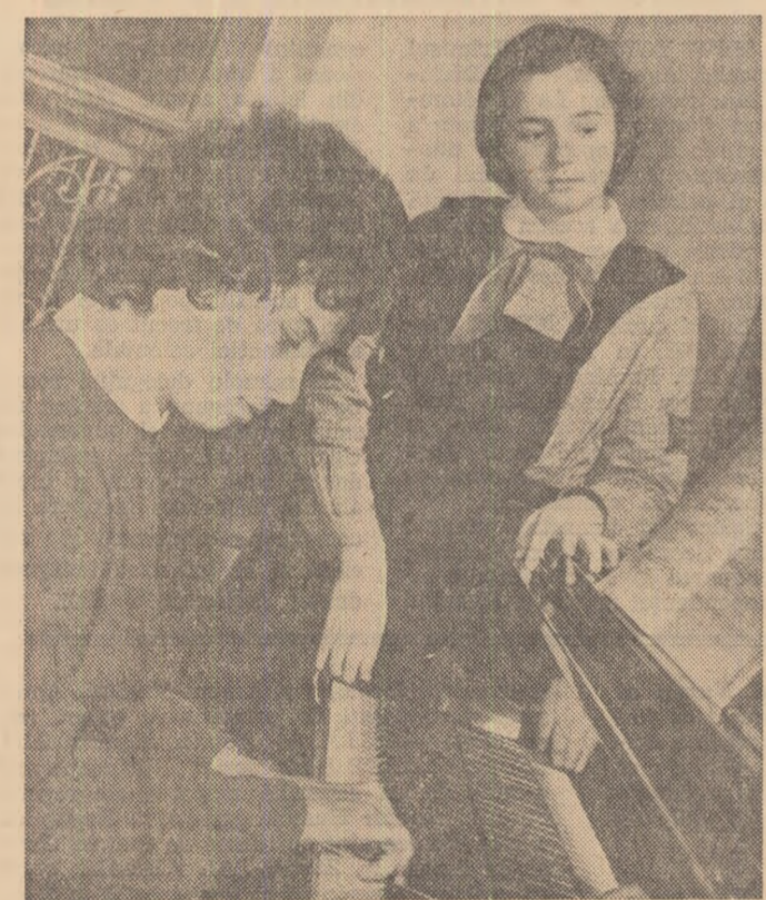
Oră de pian la Școala de muzică și arte plastice „Octav Băncilă” din Iași

PE TOATĂ DURATA ȘCOLARIZĂRII, CANDIDAȚII REUȘIȚI LA CONCURS PRIMESC BURSĂ DE 500 LEI LUNAR.