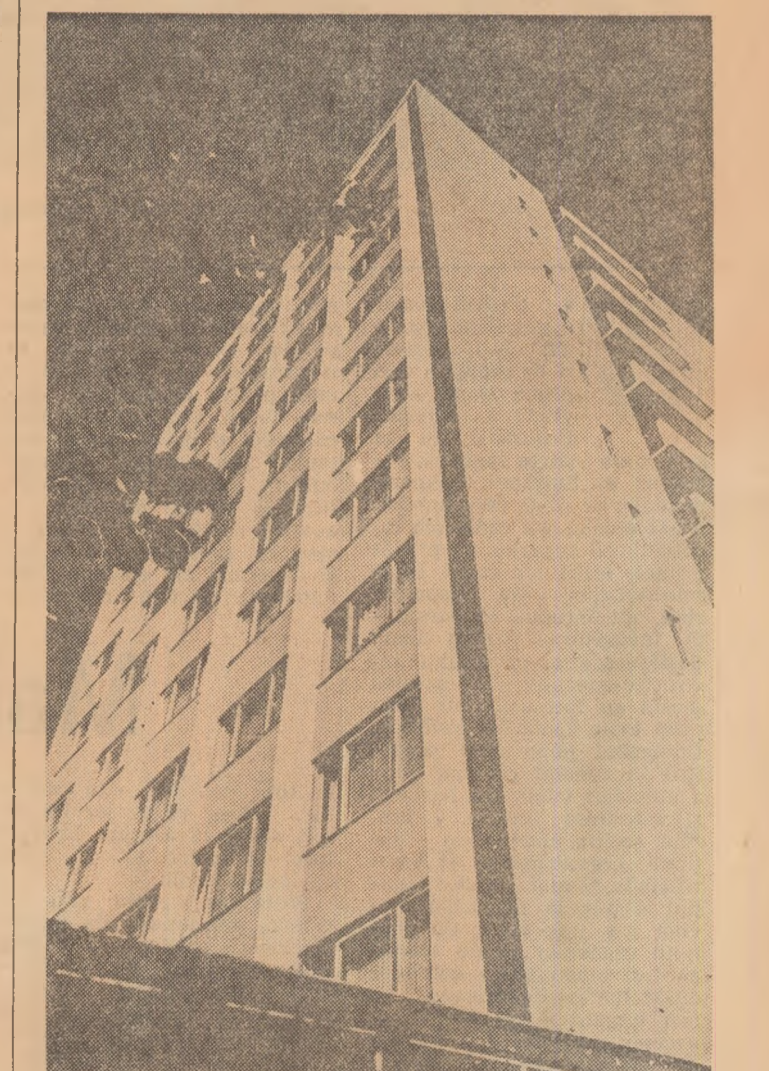
Din noul poistaj clujean.