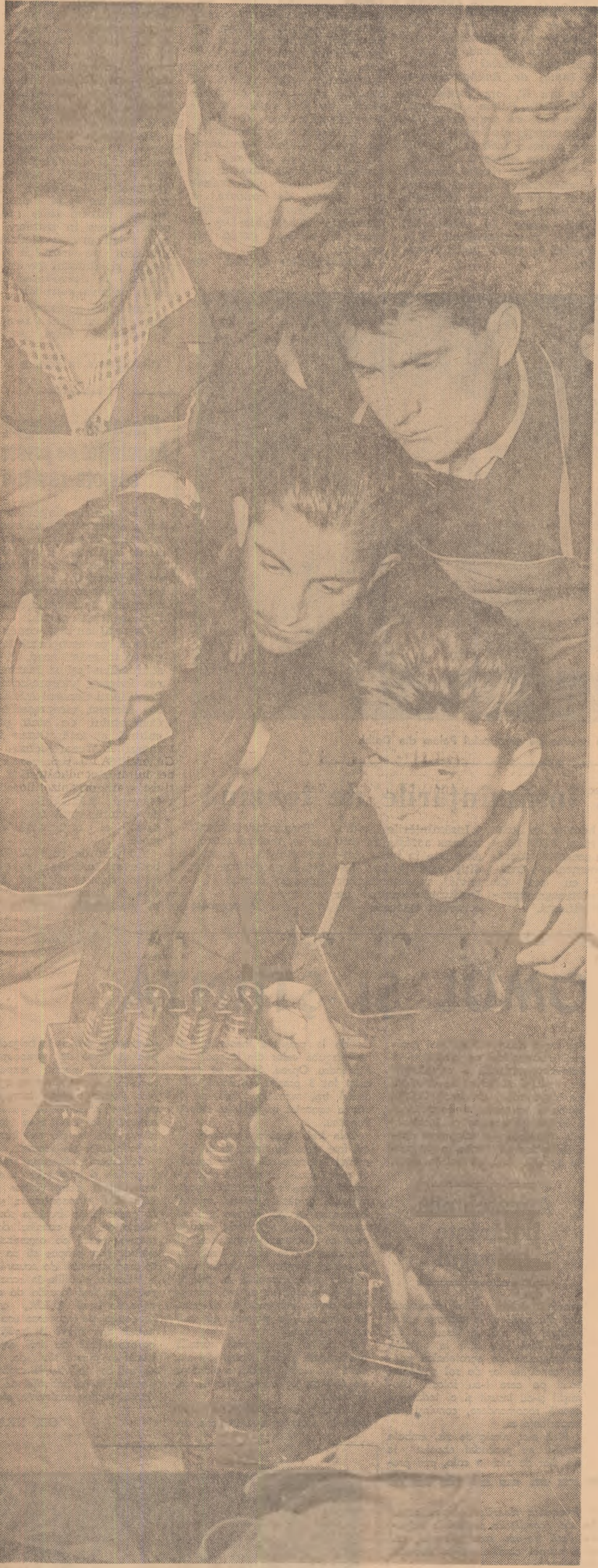
La o oră de practică a viitorilor mecanici agricoli

Raidul nostru, întreprins prin unele școli profesionale și tehnice, a scos însă la iveală faptul că nu peste tot au fost rezolvate toate sarcinile privind buna desfășurare a învățămîntului în școlile agricole, buna gospodărire a fondurilor alocate, precum și folosirea judicioasă a resurselor locale, ceea ce reclamă o preocupare sporită pe viitor din partea conducătorilor acestor școli, a organelor locale ale sfaturilor populare, și consiliilor agricole. De asemenea se cere comitetelor raionale și orașenești U.T.M. o sporită preocupare pentru îndrumarea concretă, permanentă a organizațiilor U.T.M. din școlile agricole în vederea desfășurării unei activități politice educative susținută în rîndul elevilor.