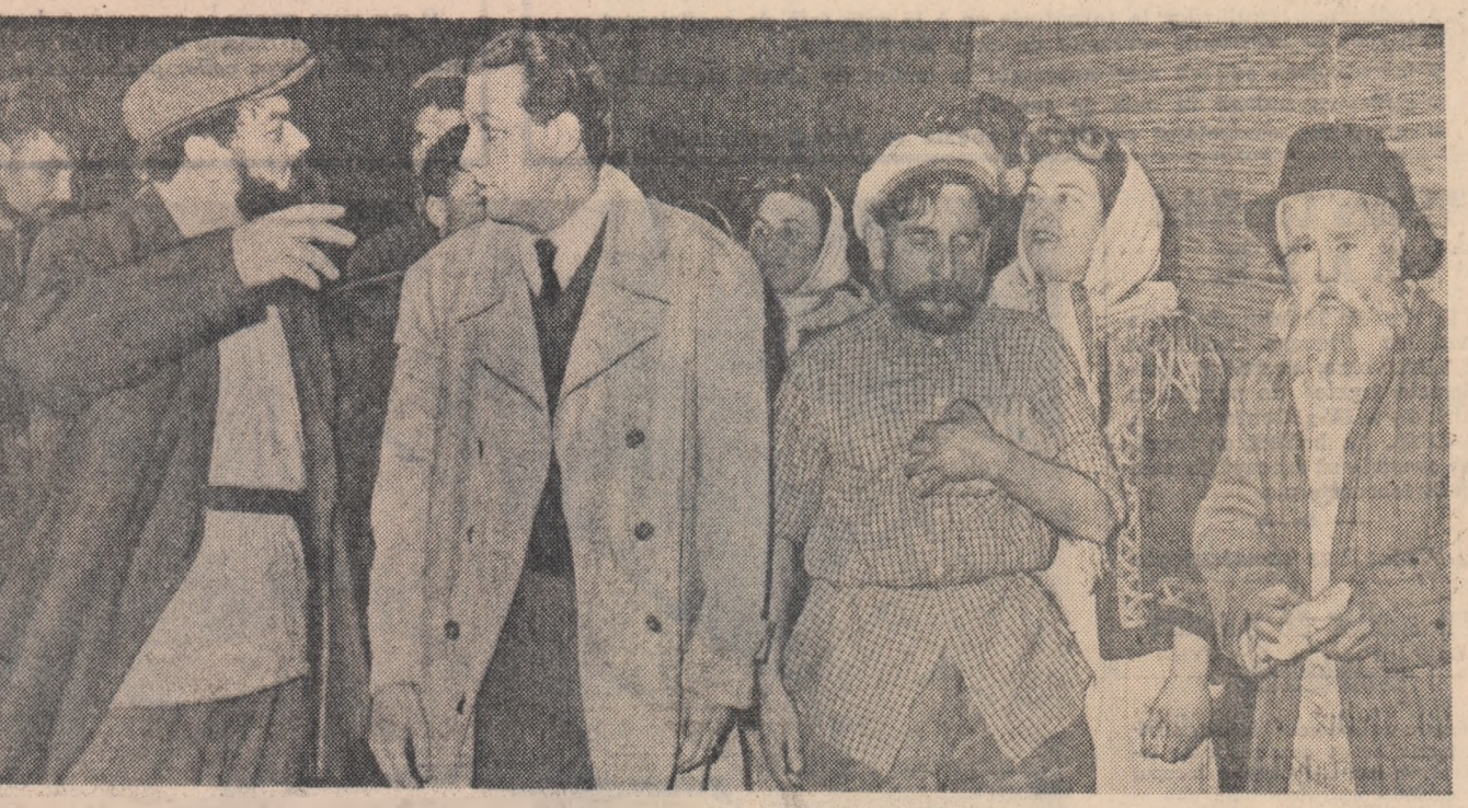
Scenă din spectacolul cu piesa „Frestel” de Horia Lovinescu prezentat de formația sîndicatalui C.F.R. Fetești.

Într-un muncitor din gura de exploatare forestieră, cabana este căminul unde lucrurile cea mai mare parte din timpul anului, este locul său de odihnă, dar în același timp este și locul de îmbogățire a orizontului său cultural. La întreprinderea forestieră Moldovița, regiunea Suceava, s-au asigurat pentru muncitorii de la gurile de exploatare forestieră 33 cabane. Pe lângă cele necesare unui trai civilizată, fiecare cabană a fost dotată cu cite un aparat de radio, cu bibliotecă volante care cuprind peste 2.500 volume. Sub îndrumarea comitetului de partid, comitetul U.T.M., în colaborare cu sindicatul, a organizat pentru muncitorii din gurile de exploatare forestieră unele activități culturale. Interesante. Astfel, în anul trecut cele 3 brigăzi artistice de agitație de la fabricile de cherestea Delia, Moldovița, Vama, ce aparțin I. F. Moldovița, au prezentat 30 programe în deplasare la gurile de exploatare forestieră. La une-