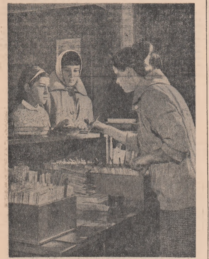
Biblioteca Ana Rațiu recomandă cititorilor cele mai noi cărți soșite la biblioteca raională din Turda.