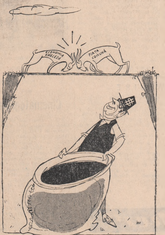
Poveștea celor două capre în variantă occidentală. Desen de V. VASILIU