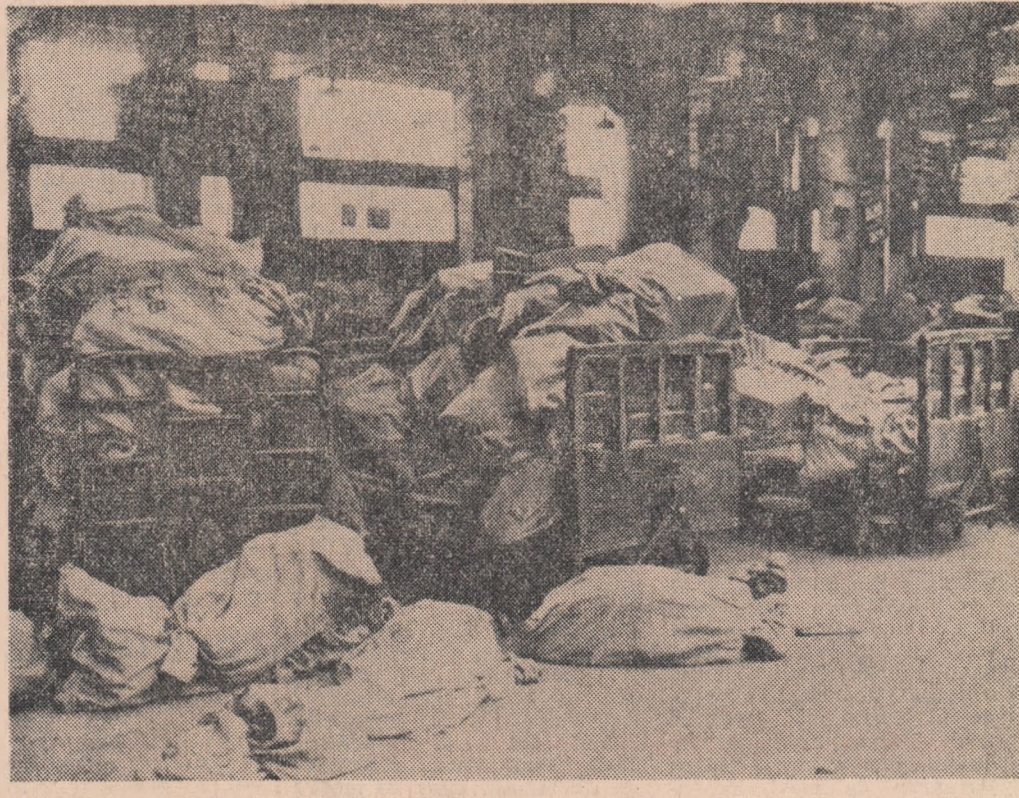
În mai multe centre din Franța, personalul oficiilor poștale a declarat grevă cerînd mărirea salariilor și îmbunătățirea condițiilor de muncă.

Reacțiunea americană a făcut încă un pas pe calea înlăturării libertăților democratice din țară. Robert Kennedy, ministrul Justiției din S.U.A., a cerut oficiului de control asupra activității subversive să investigheze în baza legii fasciste McCarran, organizația progresistă de tineret „Înainte” ca „organizație a frontului comunist”.