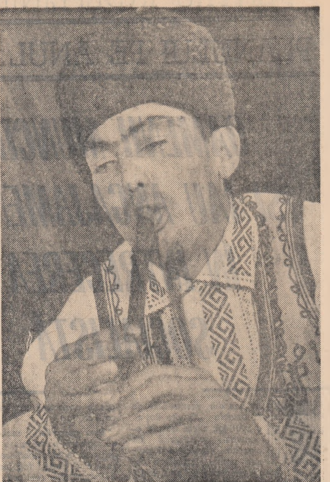
„Cîntă fluerașul Otocol!” — Tînărul interpret de muzică populară din comuna Cetate, raionul Calafat, contribuie cu talentul său la reușita spectacolelor prezentate pe scena căminului cultural.

atele activității lor frumoase. Tinerii din raion participă acum cu și mai mult interes la mișcarea artistică de amatori. Complexitatea sarcinilor muncii cultural-educative în satul colectivizat presupune operativitate și evitarea împrăștiării în munca de îndrumare. Desăvârșita doar de la o comună la alta, îndrumarea metodică n-ar putea înțe pasul cu femele mereu noi ce se cer dezbătute la cămin și care trebuie popularizate în timp scurt pe întreg cuprinsul raionului. Necesitatea acțiunilor eficiente și prompte pentru răspîndirea