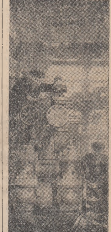
Hotărârea muncitorilor Uzinelor „1 Mai” din Ploiești este de a trimite petriștii instalații de foraj de bună calitate realizate la nivelul tehnicii moderne...