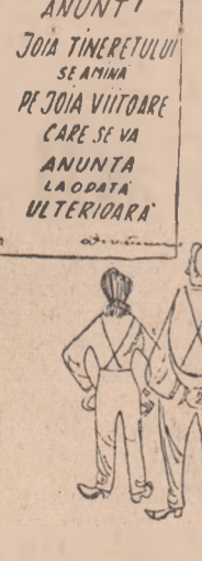
ANUNȚ! JOIE Tineretului sĂrĂINA PE JOIA VIZIONARE CARE SE VA ANUNȚA LA OPORTUNITĂȚI ULTERIOARE

— Ce se întîmplă în aceste zile la club? De pildă la sfîrșitul săptămîinii trecute, după terminarea zilei de muncă a primului schimb. În clădirea modernă nu găsim pe nimeni. Deschidem ușa sălii de spectacole: scena este cufundată în întuneric. Ce tristă e o sală de spectacole goală! Alături, în sala de conferințe, scaunele, frumos aranjate ca într-o expoziție, stau într-o incremen-