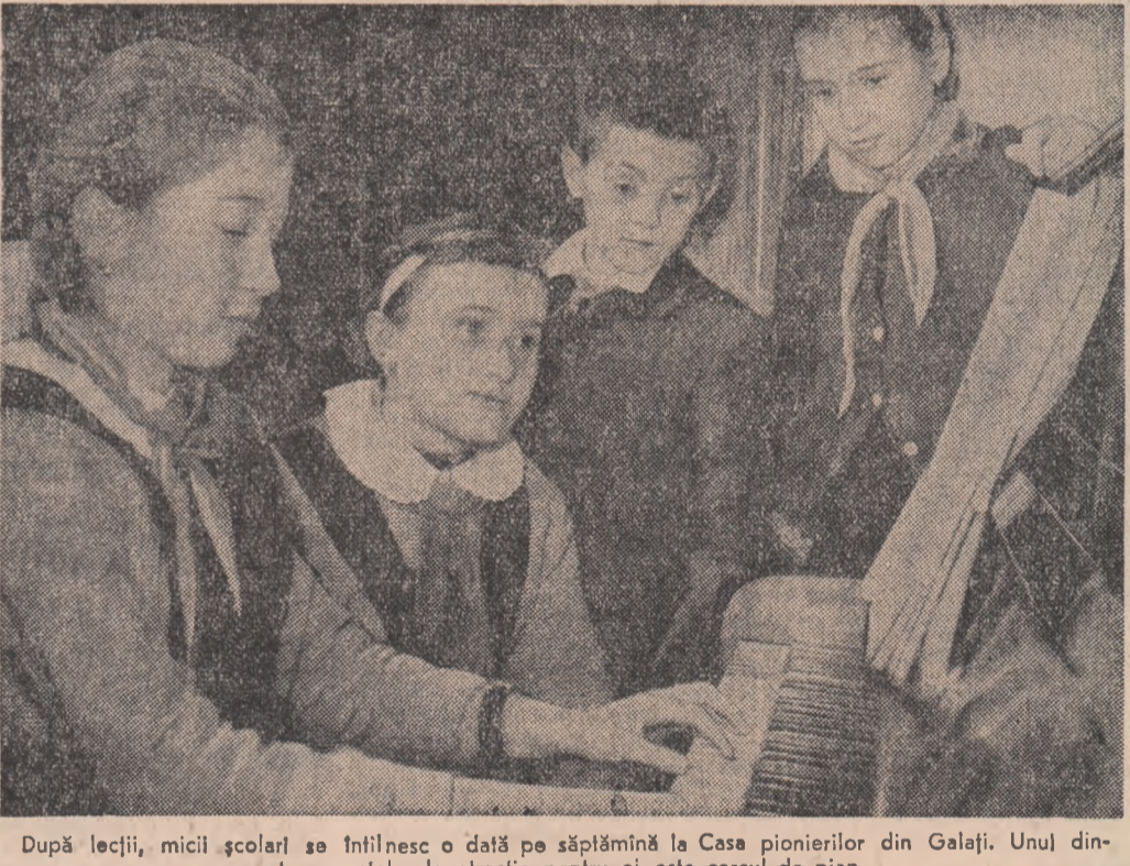
După lecții, micii școlari se întînesc o dată pe săptămîină la Casa pionierilor din Galați. Unul dintre punctele de atracție pentru ei este cercul de pian.