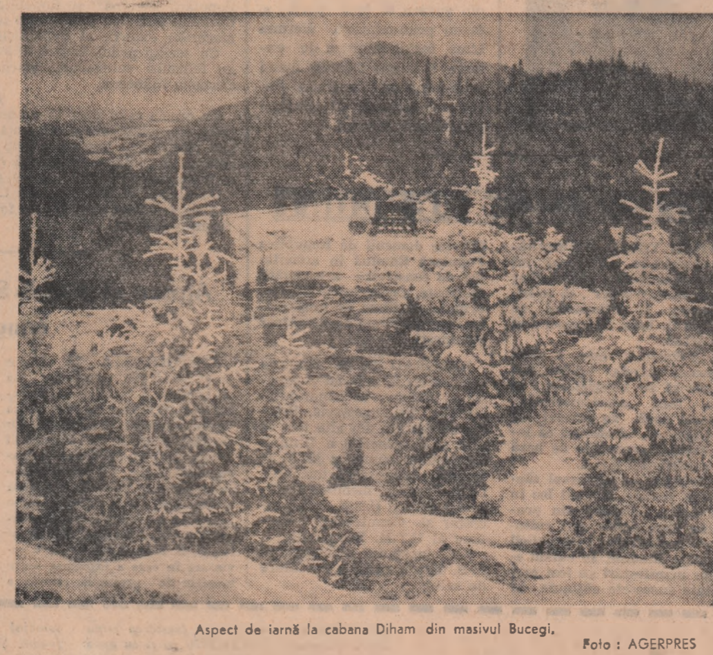
Aspect de iarnă la cabana Diham din masivul Bucegi.

TIMIȘOARA. — Artiștii amatori din întreprinderile și instituțiile din Timișoara, Arad, Reșița, Lugoj, Oțelul roșu, au pregătit noi programe artistice pe care le prezintă în campania electorală. Pe scenele căminelor culturale din Dumbrăvița, Pitești, Cărpiniș, Săcălaz și Moșia, a căminele artiștilor amatori de la Uzinele „Fehrmann”, Clubul C.F.R., 16 Februarie, întreprinderea textilă „Ada” Marinescu din Timișoara și de la Șfulul popular regional au prezentat programe artistice.