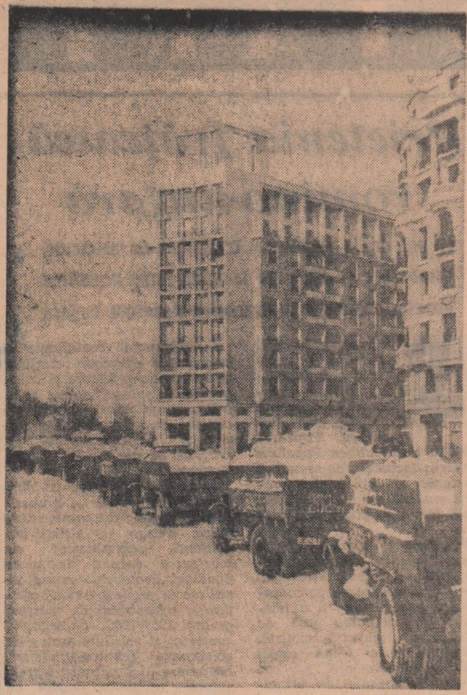
Acțiunea de dezpozire a Capitalei se face într-un ritm susținut.