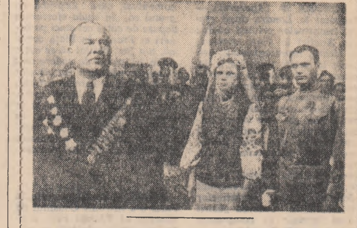
Pe ecrane noul film românesc