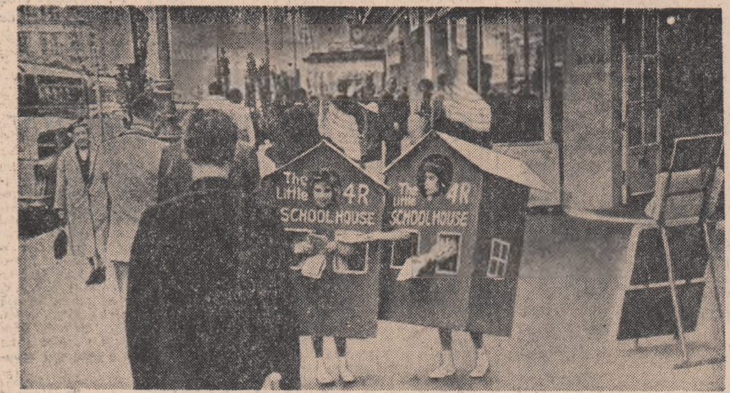
San Francisco: Pichele de elevi împart manifeste prin care cer sporirea fondurilor pentru construirea de școli.

GENEVA. — La 28 ianuarie, la Geneva s-a ținut încheierea lucrărilor cea de-a 31-a sesiune a Consiliului executiv al Organizației Mondiale pentru Sănătate (O.M.S.). În timpul sesiunii — care a durat două săptămîni — au fost dezbătute o serie de probleme care privesc activitatea acestui for mondial și a fost aprobat bugetul organizației pentru anul 1964.