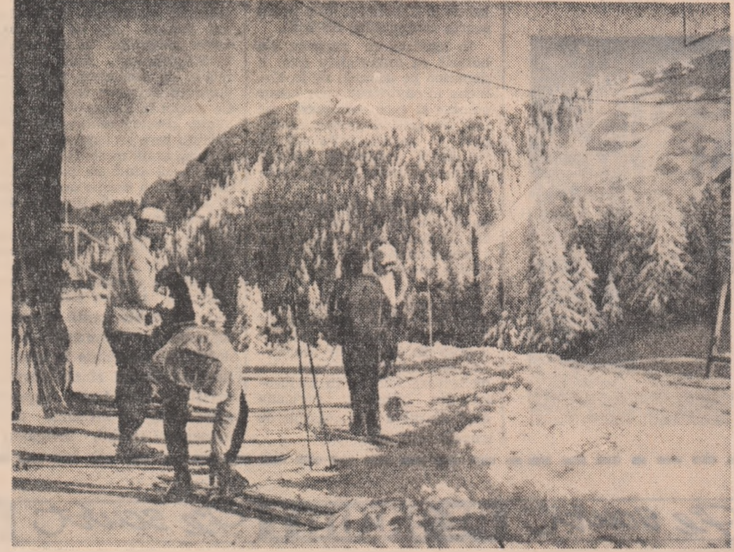
La cabana Cristianul Mare.