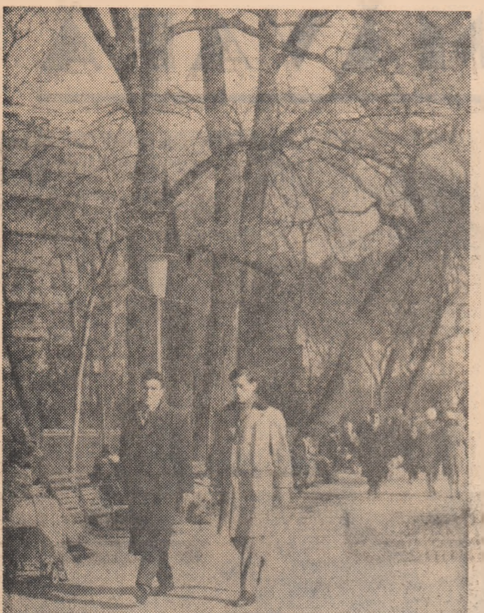
Zi de primăvară în Cișmigiu.

La Institutul de cercetări științifice pentru mașini matematice din Praga a fost dată în exploatare de probă o parte din utilajul noi mașini electronice de calcul, cu cifre — „Epos”. Aceasta este o mașină de calcul cu comandă automată, destinată în primul rînd pentru evidență și efectuarea de calcule tehnico-științifice. Ea poate efectua pînă la 17 000 operații pe secundă, iar modelul cu tranzistori electrice pînă la 30 000 de operații pe secundă.