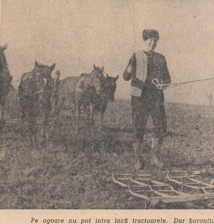
Pe ogoare nu pot intra încă tractoarele. Dar boronitul nu poate întîrzi!