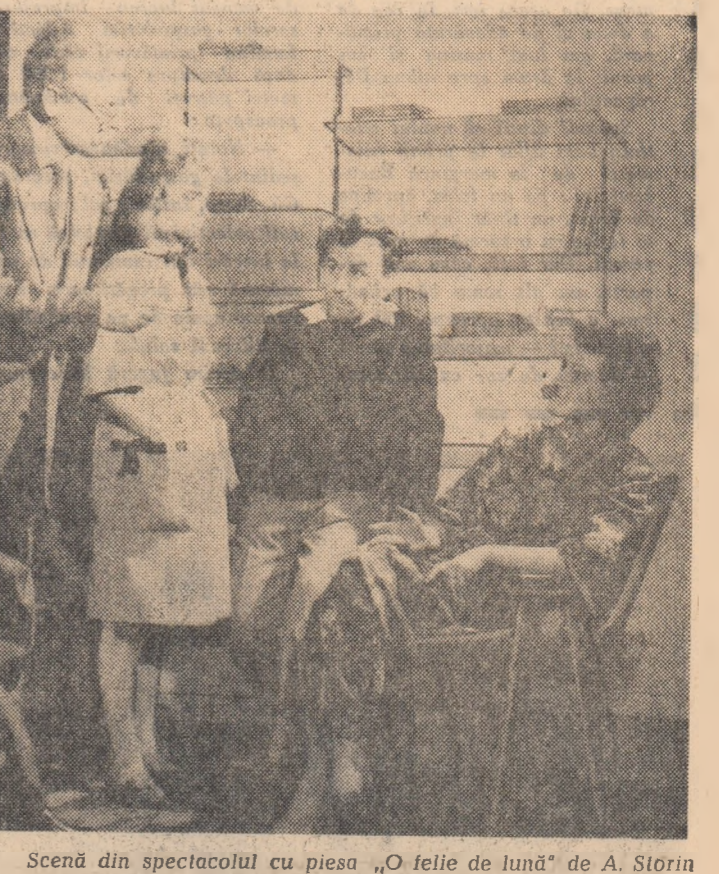
Scenă din spectacolul cu piesa „O feișe de lună” de A. Storn prezentat de colectivul artistic al clubului muncitoresc „Construcător” din Hunedoara.

Avînd din ce în ce mai puțini admiratori chiar și în țările occidentale, artiștii abstractioniști sînt în căutare de noi idei trănite, menite să e-pateze publicul. Asa de pildă, pictorul Yaacov Agam a creat picturile care nu trebuie atrinse pe pereți. Asemenea picturi stau într-un echilibru precar pe pedestalele special turnate. Artiștii motivează noul mod de expunere a tablourilor prin aceea că ar în-