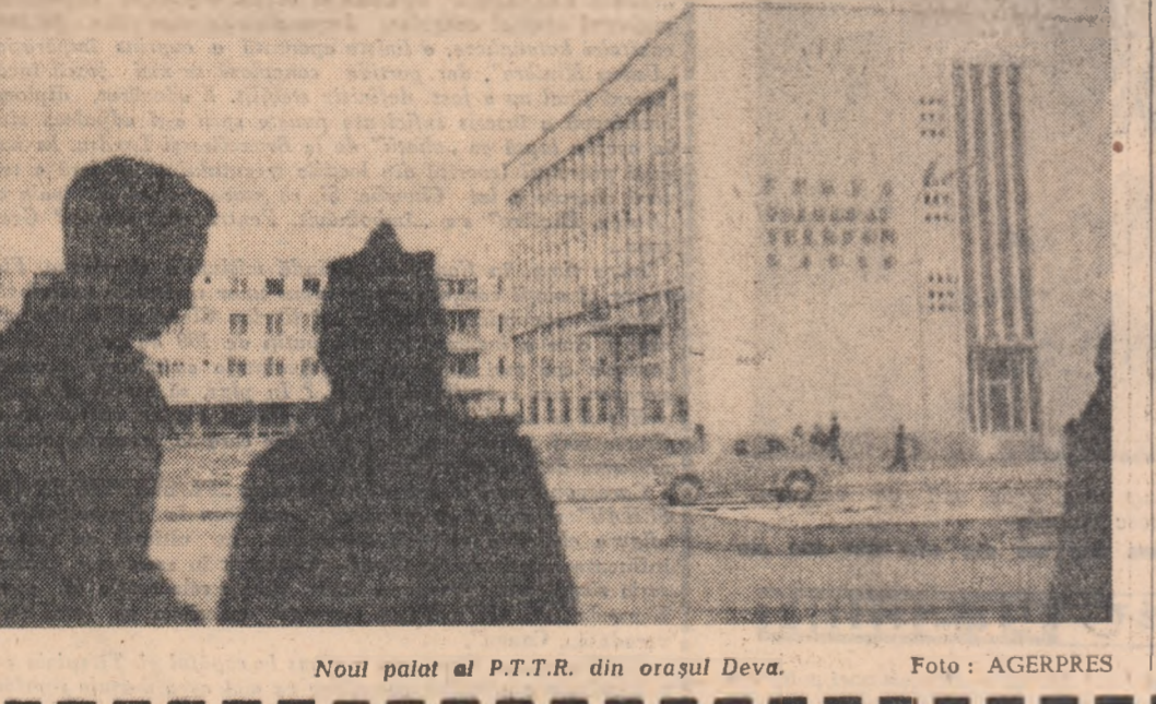
Noul palat al P.T.T.R. din orașul Deva.