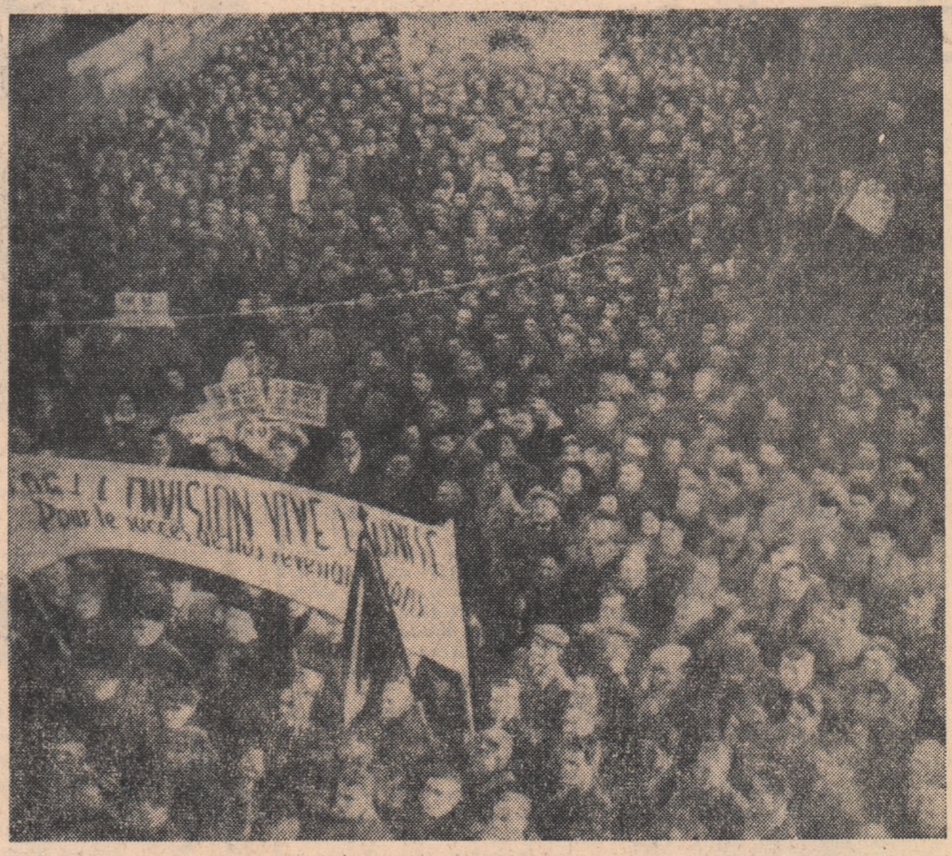
Un aspect al luptei revendicative a muncitorilor francezi: mare demonstrație la Lens

Raportul prezentat la Conferință de un reprezentant vest-german subliniază că muncitorii și funcționarii vest-germani social-democrați, creștini și comunisti din toate colțurile R. F. Germane s-au întrunit la Leipzig pentru a discuta cu oamenii muncii din R. D. Germană problemele luptei pentru menținerea păcii, pentru realizarea înțelegerii reciproce.