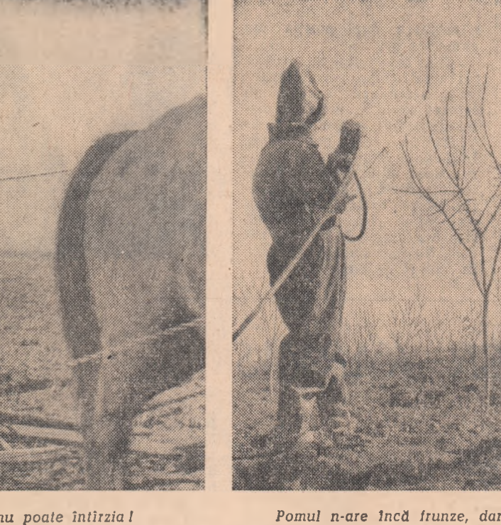
Pomul n-are încă frunze, dar ei se gîndesc la fructe.