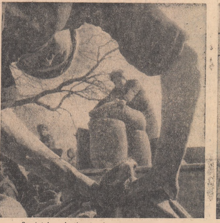
Semințele selecționate sînt transportate pe ogoare.