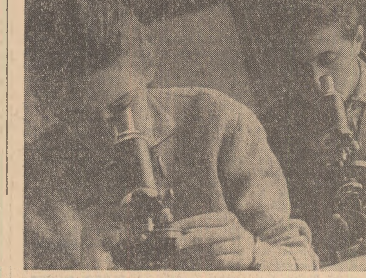
Studenții anului I exploatare, studiind într-unul din laboratoarele Facultății de silvicultură din Brașov.

În raza ocoalelor silvice Sebes, Gurahoni, Beius și Oradea au fost date în exploatare noi drumuri forestiere. Acestea asigură condiții de deschidere a unor noi parchete cu importante cantități de masă lemnoasă. În prezent se lucrează intens la construirea noului drum forestier Remeș-Stina de Vale pe o distanță de aproape 40 km. El va asigura o bună legătură atit cu exploatarea forestieră de pe Valea Iadului cit și cu stațunea climaterică Stina de Vale. În acest an se prevede construirea de noi drumuri forestiere pe o lungime de aproape 60 km. (Agerpres)