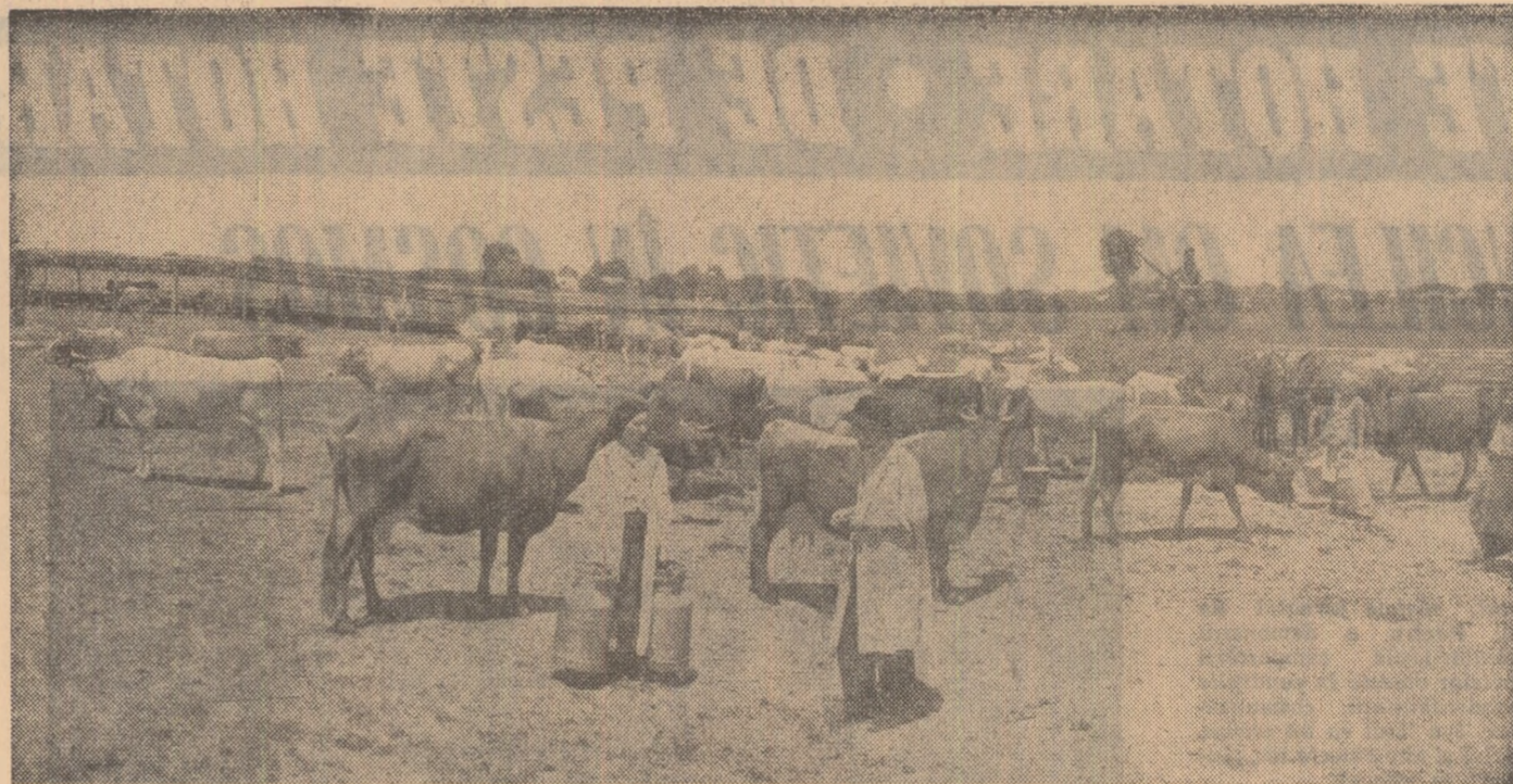
Colectivii din satul Dirvari, regiunea București, acordă o deosebită atenție fermelor de vaci. Acum, în timpul verii, au fost amenajate tabere unde vacile primesc o îngrijire corespunzătoare și furajul din belșug.