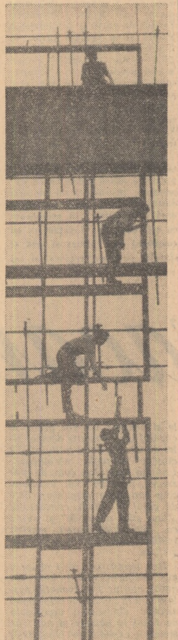
Deocamdată sînt numai rame, dar în curînd prin gemurile mari, lumina va pătrunde din belșug în noua hală ce se construiește la Întreprinderea de poduri metalice și prefabricate din beton-Pitești