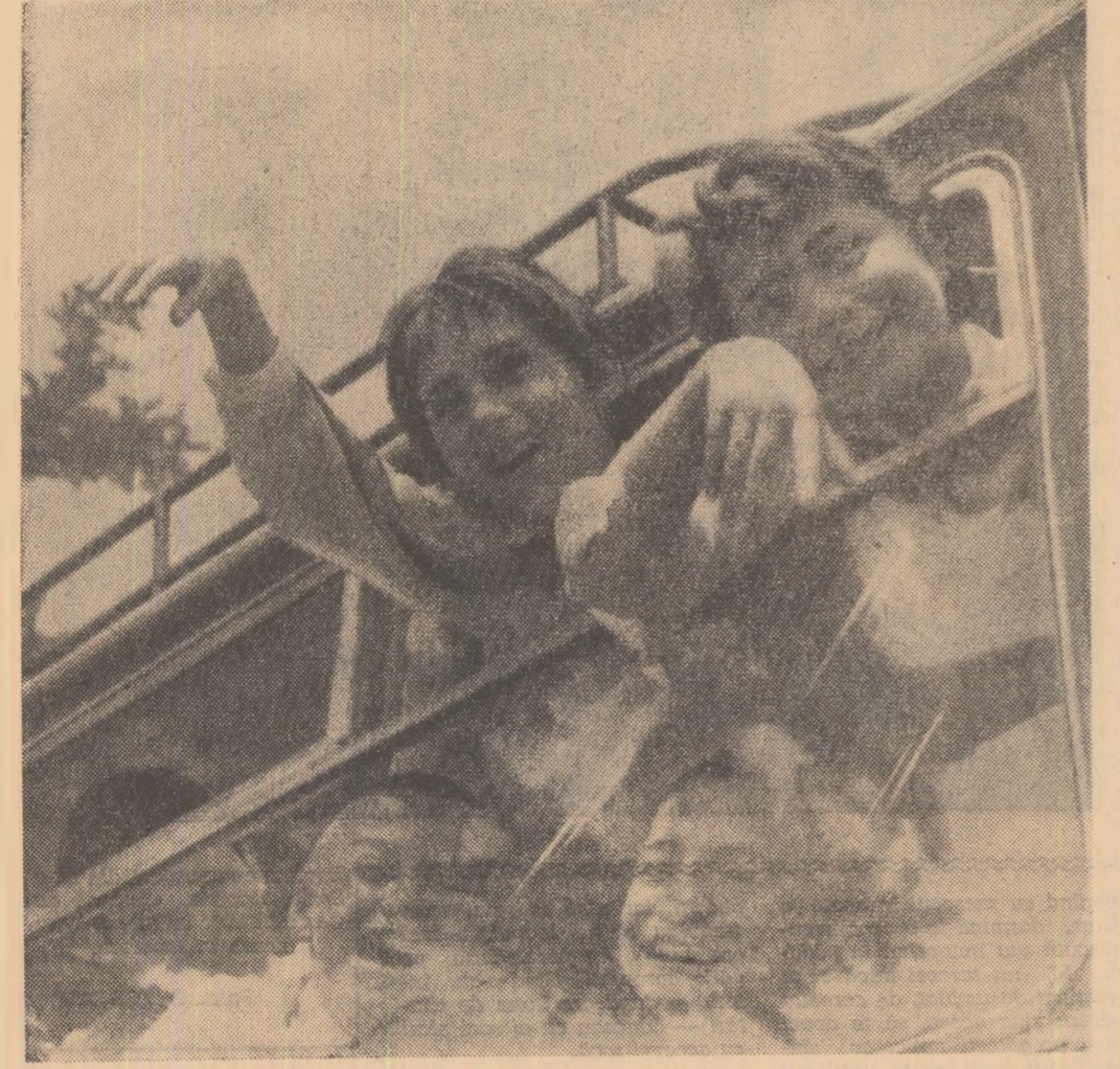
Copiii au pornit în primele drumetii din vacanță. În fotografiile: elevi de la Școala medie „I. L. Caragiale”

„Critică făcută de ziar este justă. Articolul a fost preluat cu toți muncitorii, inginerii și tehnicienii întreprinderii noastre. Întregul colectiv a apreciat că intră-devăz ușile livrate de noi nu au fost de calitate așa așteptată.