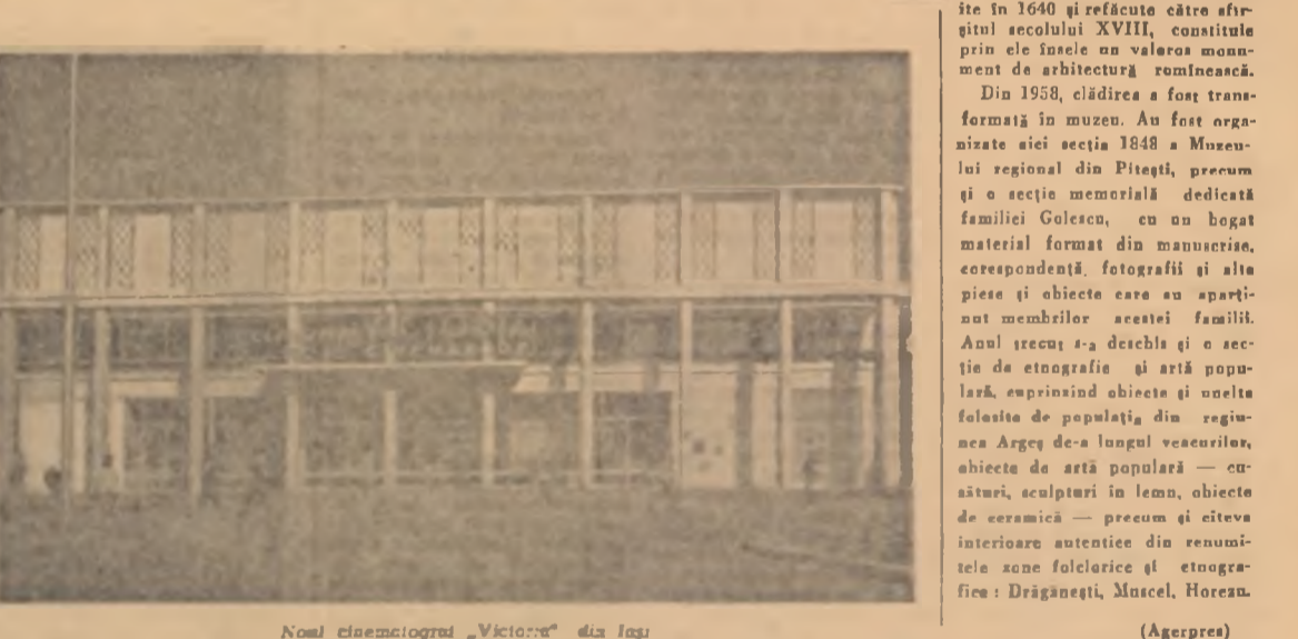
Nomul cinematografului „Victoria“ din Iași

La Muzeul din Golești, posesor al unei colecții de obiecte etnografice și de artă populară, se desfășoară activități culturale și științifice.