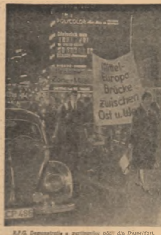
R.F.G. Demonstratie a partinitorilor poști din Dusseldorf.

ministru. Cu ocaziunea acestei aniversări, Comitetul de Muncă și Relații Industriale din Algeria a organizat o serie de manifestări în onoarea lui Ben Bella. KUALA LUMPUR. La 15 septembrie a fost deschisă la Kuala Lumpur o sesiune de lucru în care se discută deciziile și recomandările Comitetului de Cooperare și înțelegere reciprocă dintre Malaysia, Guvernul și biroul său permanent în Kuala Lumpur. NEW YORK — Într-o sesiune a Comitetului de Securitate al O.N.U. din 17 septembrie, s-a discutat despre situația din Congo și în special despre activitatea grupurilor armate în această țară.