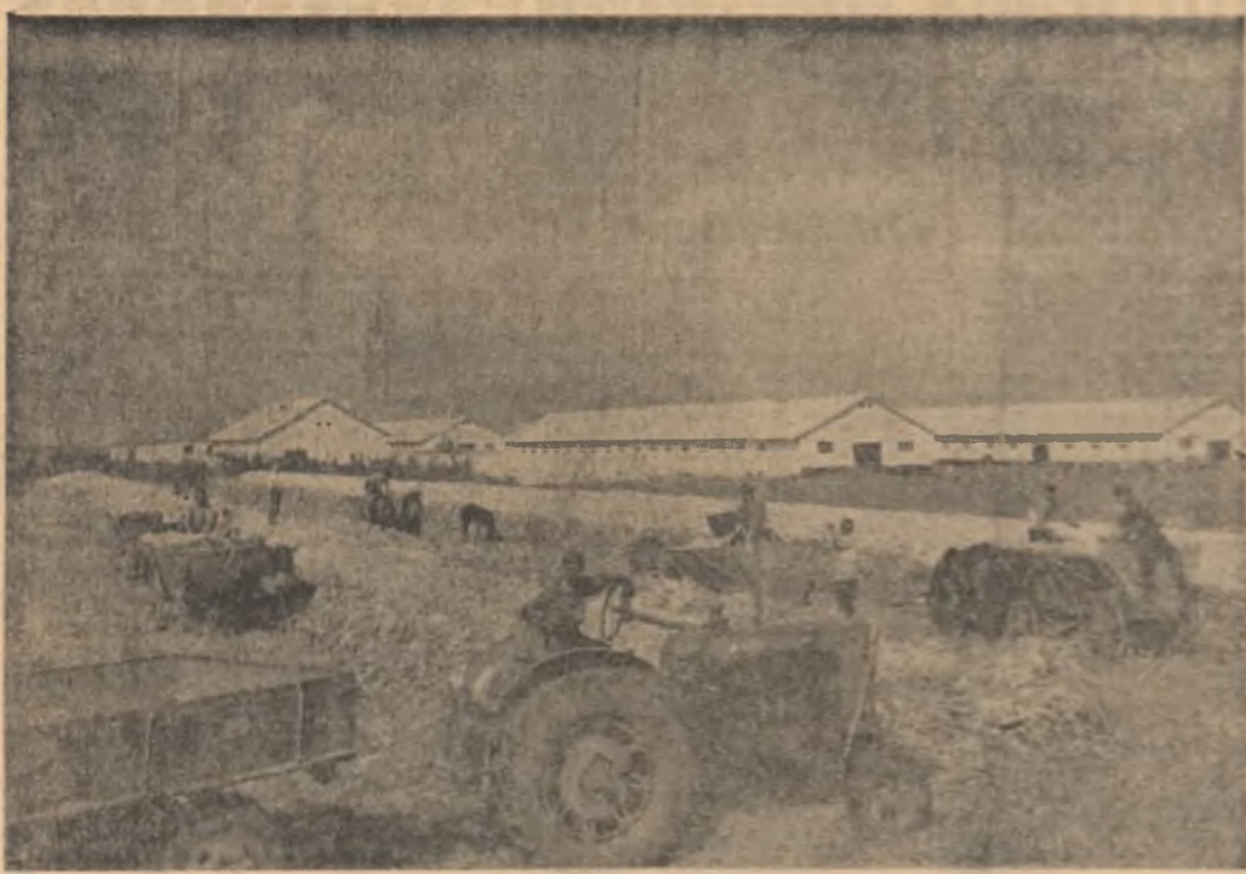
Colectiviștii din comuna Munteni-Buzău, raionul Slobozia, au recolat până în prezent peste 800 de hectare de porumb din totalul suprafeței de 1120 de hectare. Partea cu recoltarea și transportul porumbului, colectiviștii se preocupă și de izolarea cocenilor. Ei au înslăozit până în prezent peste 420 tone.

După spectacol, color prezentați la premieră în vorbii regizorul filmului, Henri Colpi. Primit cu un viu interes de publicul brăilean, filmul s-a bucurat de o frumoasă apreciere.