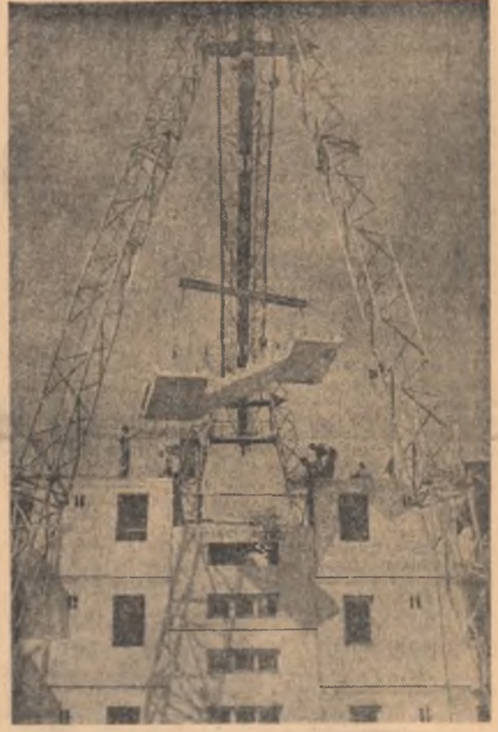
Construcții bune și letine, date la timp în folosință — lăid loznică echipa de montori condusă de Ștefan Roșca de pe șantierul 501 construcții locuințe din cartierul Steagul Roșu-Brașov. Această echipă a terminat în 20 de zile mai devreme blocul nr. 32, Toată fierăria folosită la acest bloc, provine din economii.