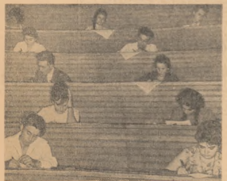
Ieri a început cea de a doua etapă a concursului pentru admiterea în învățământul superior. În fotografie, un aspect de la concursul de admitere desfășurat la Institutul de medicină și farmacie din București.