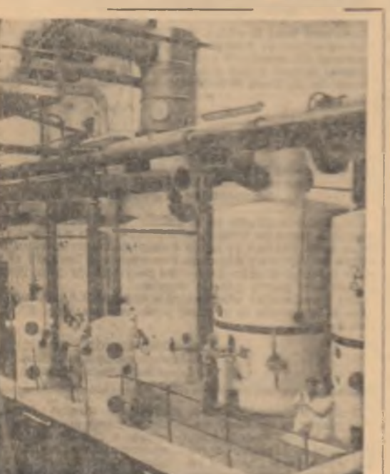
Fabrica de zahăr Chitila-București. Vedete parțială a stăilei de evacuare și concentrare a zăburilor pentru prepararea aștopurilor ce urmează a fi cristalizate.

Acțiunea cinematografică se concentrează în deosebi pe relațiile — complicate și contradictorii, și ele — dintre cei doi tineri care, amîndoi, se facare orbește într-un viciu