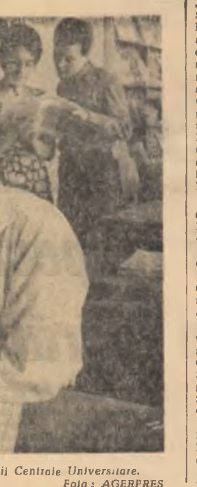
În sala de lectură a Bibliotecii Centrale Universitare.