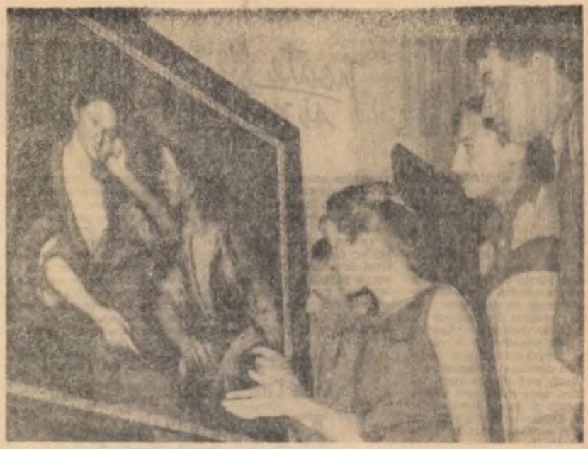
Tinerii sibiieni la Muzeul Brukenthal

Filmul documentar românesc „Primăvară obișnuită”, producție a studioului „Al Sahia”, în regia ing. Sergiu Nicolaescu, a fost premiat pentru a doua oară, peste hotare. În cadrul Festivalului filmului, organizat cu prilejul Tîrgului internațional de la Salonic, filmul românesc a fost distins cu premiul III. Anul trecut, cu ocazia concursului internațional de tehnică cinematografică de la Moscova, filmul „Primăvară obișnuită” realizat în culori prin microfilmări pe flori și plante, a fost distins cu „Premiul de excelență” al Uniunii (Agerpres).