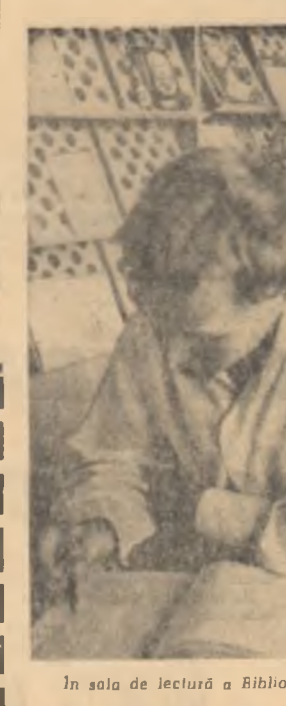
În sala de lectură a Bibliotecii Centrale Universitare.

Artiștii tineri au o mare dificultate în a stabili o legătură între ceea ce văd și ceea ce simt. Ei sunt încă în mare măsură subiecți ai condițiilor în care trăiesc, în loc să fie actorii și creatorii lor. Acest lucru se vede în multe lucrări care sunt pur și simplu reproduceri ale ceea ce văd în jurul lor, fără să aibă o viziune proprie asupra lumii.