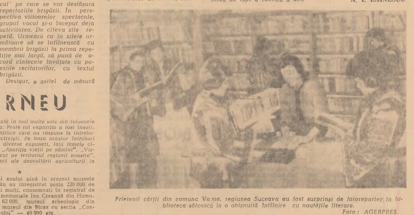
Președintele cărții din comuna Vama, regiunea Suceava a fost surprins de fotoreporter în bibliotecă sătească la o obișnuită întîlnire cu nouățile literare.

De la începutul anului pînă în prezent muzeul din regiunea Bacău au înregistrat peste 220.000 de vizitatori. Cel mai mult, consemnat în registrul de evidență al casei memoriale Ion Creangă din Humulești: aproape 62.000, muzeul etnologic din P. Neamț, 42.000, muzeul din Blăzeș cu secția „Construirea socialismului” — 40.000 etc.