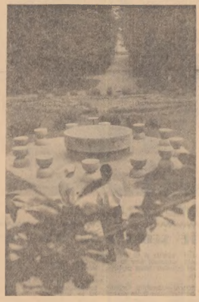
Din operele lui Brîncuși: „Masa lăcării” în Grdina publică a orașului Tg. Jiu.

Sporirea de la o zi la alta a volumului producției de țesături, constituie o preocupare permanentă a colectivului de muncă din Întreprinderea textilă „Ardeleana”-Satu Mare. În acest an, la „Ardeleana” se produce de peste 3 ori mai multe țesături în comparație cu producția anului 1960. Aceasta se explică în primul rînd prin folosirea mai completă a mijloacelor de producție de mare randament cu care este dotată întreprinderea și prin aplicarea unor metode de muncă mai eficiente. Anul acesta colectivul a produs peste plan aproape 180.000 m.p. țesături.