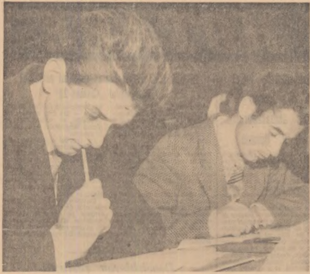
Duminică s-a desășurat finala pe țard a Olimpiadei studențești de matematică. În fotografie, un aspect de la olimpiadă.