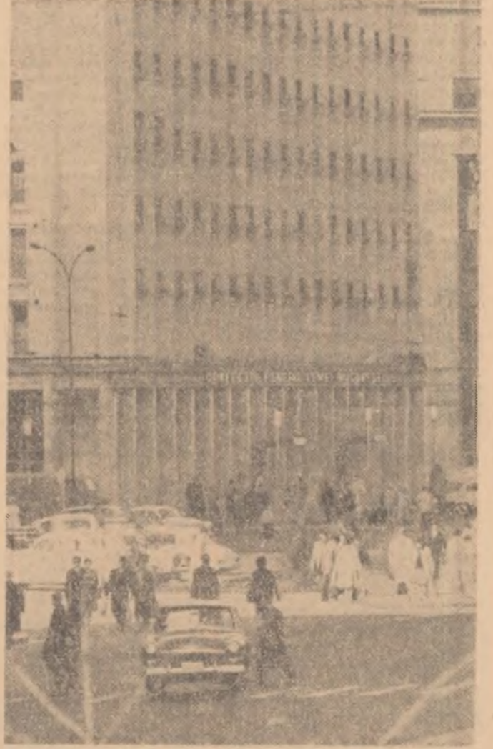
Instantaneu de pe Bulevardul Magheru din Capitală