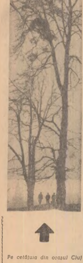
Pe cetățuia din orașul Cluj