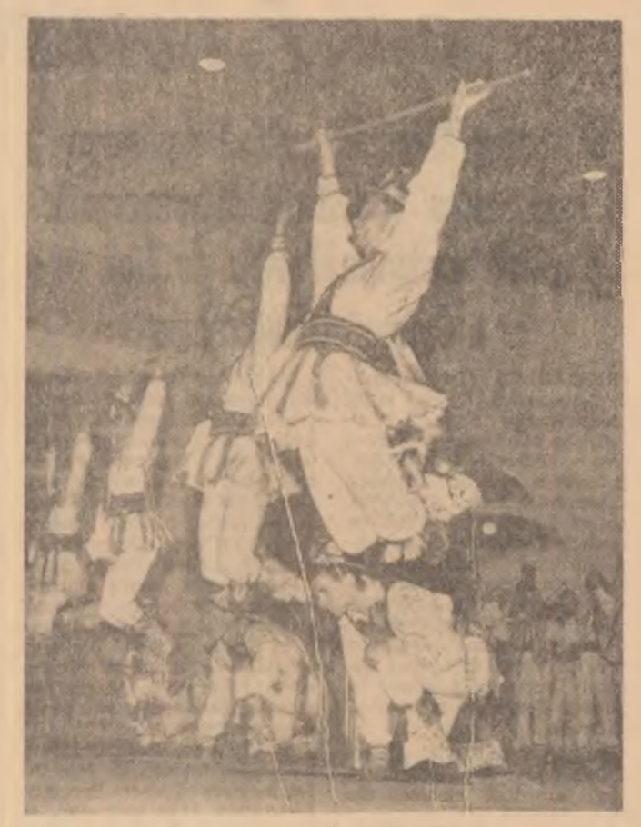
Jocul „Călușul” în interpretarea formației de dansuri a Casei de cultură a studenților din București.

La Casa de cultură din Predeal oferă oamenilor muncii veniți la odihnă și locuitorilor orașului, posibilitatea petrecerii în mod plăcut și recreativ a timpului liber. În fiecare seară, sala destinată auditiilor muzicale, sala de lectură, bibliotecă, devin neîncăpătoare. Nu de mult peste 700 de oameni ai muncii veniți la odihnă au asistat la medallionul literar-muzical cu tema: „Înainteai ai muzicii românești — Ciprian Porumbescu și Gheorghe Dima”, organizat de Casa de cultură în colabora-