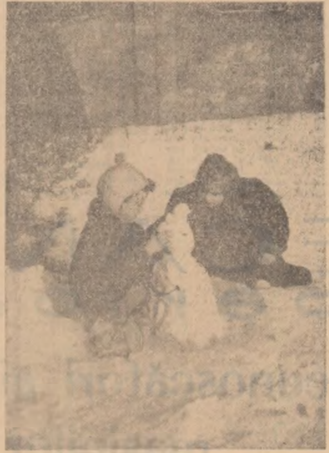
Concentrați ca niște „virtuoși maeștri” preocupați să dea expresivitate „operei” lor, cei doi nu se arată încă pe deplin mulțumiți de primul om de zăpădă. În primul rînd, pentru că, deocamdată, din lipsă de materie primă, omul de zăpădă este doar un... omuleț. Poate mine...

MIRCEA GEORGESCU (Continuare în pag. a IV-a)