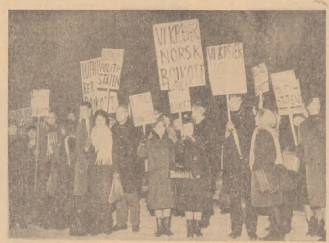
NORVEGIA — Recent a sosit în portul OSLO un vas cu mărluri din Republica Sud-Africană. În timpul descărcării vasului, numeroși membri ai Grupului norvegian de acțiune împotriva discriminării rasiale au organizat în port o demonstrație, cerînd boicotarea mărlurilor din R.S.A. În fotografie: Aspect din timpul demonstrației.

Luînd cuvîntul în fața corespondenților de presă, ministrul afacerilor externe al Republicii Yemen, Mustafă Yacubi, a declarat că guvernul Yemenului va adresa Consiliului de Securitate o notă de protest în legătură cu această situație.