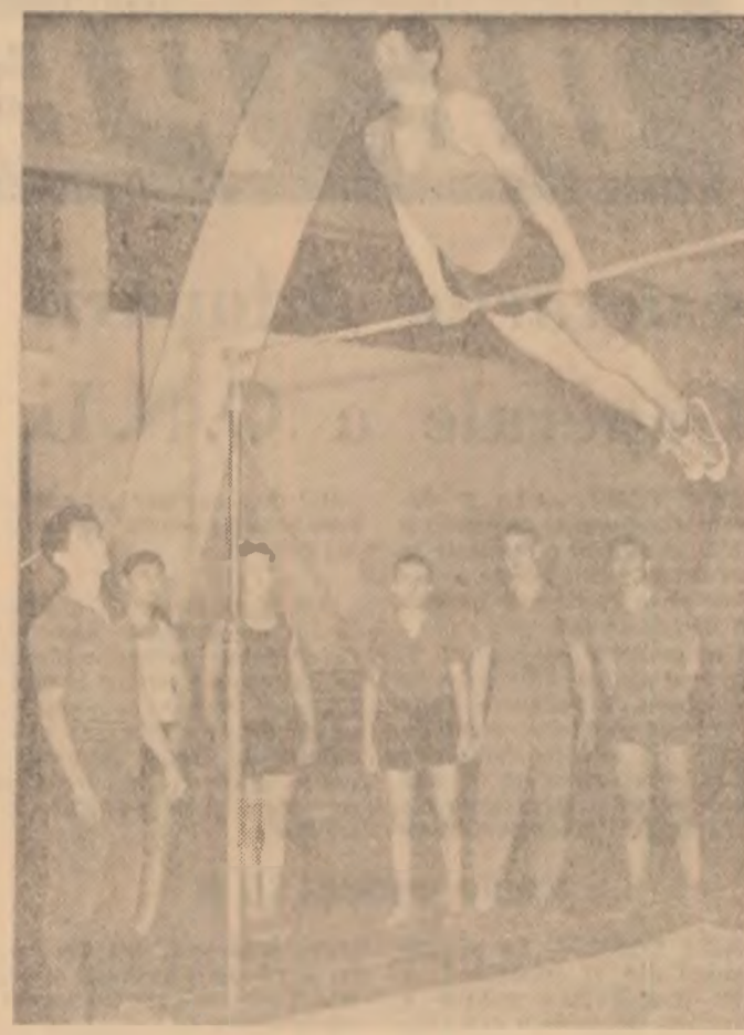
Tineri muncitori de la „Industria Sirmie” Cimpia Turzii în timpul unei întreceri de gimnastică în cadrul Spartachiadei de iarnă a tineretului