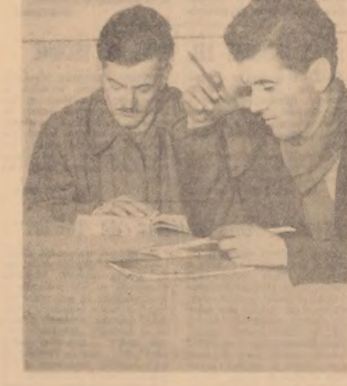
La S.M.T. Cocioi, raionul Răcari, s-a predat o nouă lecție la învățămîntul agrozootehnic. Pentru a da răspunsuri cit mai bune la seminarii, mecanizatorii studiază cu mult interes materialul bibliografic recomandat de lector.