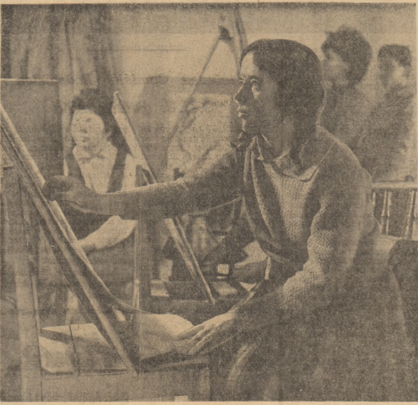
La secția de arte plastice a Școlii de artă populară din Ploiești.

depășit, cum era și firesc, cadrul romanului, făcîndu-se apel la cunoștințele dobîndite la învățămîntul politic, în cadrul cărui tinerii studiaseră cuvîntarea tovarășului Gheorghe Gheorghiu-Dej — la a 40-a aniversare a creării U.T.C. La baza organizării unor serii tematice: „Realizările obținute sub conducerea partidului în desăvîrșirea construcției socialismului”, a stat interesul tinerilor de a cunoaște mai temeinic viața noastră nouă. A fost însă și un prilej de a populariza cartea care ogîndește aceste mari prefaceri. Cum am alcătuit-o? Mai întii, un jurnal vorbit. Realizatorii lui au fost cîțiva tovarășii din uzină care vizitaseră obiectivele industriale din Hunedoara, Reșița, Moldova. Mulți tineri citiseră și volumele de reportaje, „Paralela 45” de Pop Simion, „400 de zile în orașul flăcărilor” de V. Nicorovici și altele. Imaginea patriei în viitor a fost reconstituită de tinerii pe baza cunoașterii rapoartelor tovarășului Gheorghe Gheorghiu-Dej prezentate la cel de-al III-lea Congres al P.M.R. și la Sesiunea Extraordinară a Marii Adunări Naționale din 1962. Programul artistic — care a urmat — a fost o selecție a celor mai frumoase poezii și cîntecuri despre patria noastră. A urmat apoi un concurs „Uzina noastră ieri și azi”, și, în încheiere, cîteva filme documentare care au contribuit la fixarea și prin imagini a celor discutate la această seară tematică.