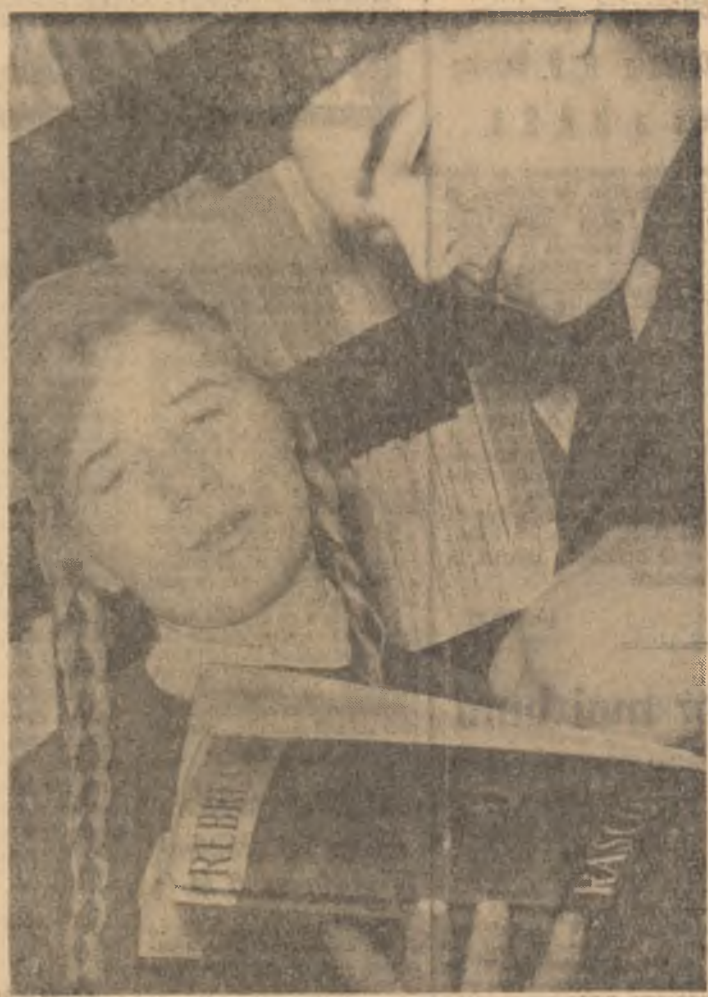
Se consultă cărțile noi așite la bibliotecă.