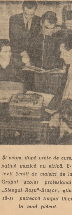
Și acum, după orele de curs, puțîn muzică nu strică. E-levei Școlii de mîștri de la Grupul școlar profesional „Steagul Roșu”-Brașov, știu să-și petreacă timpul liber în mod plăcut.

ELENA HAITĂ bibliotecară la Uzinele „Republica”-București