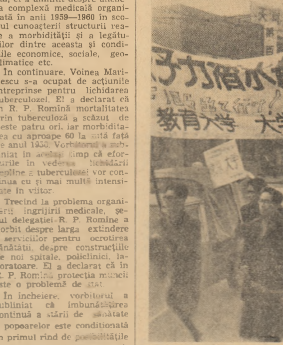
JAPONIA: La Tokio a avut loc recent o demonstrație pentru interzicerea armelor nucleare. Participanții au cerut poporului japonez să-și strîngă rîndurile în lupta pentru interzicerea armelor nucleare. În fotografie: Aspect de la demonstrație.

ADDIS ABEBA — Ministrul informațiilor al Etiopiei a anunțat în cadrul unei conferințe de presă organizată ieri dimineața la Addis Abeba, că la frontiera cu Somalia au reîncăput ciocnirile militare. Au fost semnalate atacuri somaleze la posturile de frontieră din Debo și alte localități. Ministrul etiopian a anunțat că „guvernul său a luat toate măsurile necesare pentru a respinge atacurile somaleze”. După ce a arătat că guvernul somalez nu a răspuns încă cererilor formulate cu cîteva zile în urmă de Etiopia de a se începe tratative directe pentru soluționarea conflictului de frontieră dintre cele două țări, ministrul informațiilor etiopian a reînnoit această cerere arătînd necesitatea urgentă a negocierilor directe.