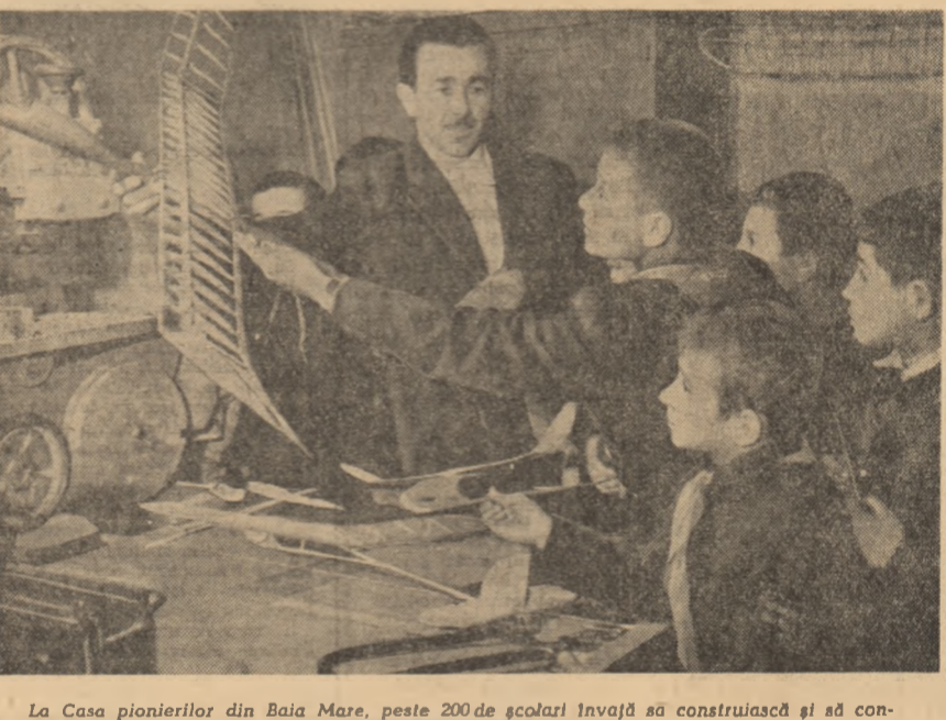
La Casa pionierilor din Baia Mare, peste 200 de școlari învață să construiască și să conducă aeri și nave modele.