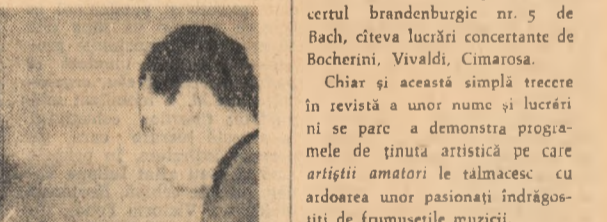
Pregătire pentru o nouă audiere într-una din clasele de vioară de la Școala de muzică din Craiova.

Munca (16; 18,15; 20,30). A TREIA REPRIZA: Popular (16; 18,15; 20,30). ERA NOAPTE LA ROMA — ambele serii: Arta (15,30; 19). O ZI CA LEII: Măstilor (15,30; 18; 20,30). TOTUL RAMINE OAMENILOR: Aurora (10,15; 12,30; 16; 18,15; 20,30). Cotroceni (16; 18,15; 20,30). CĂLĂTORIE ÎN APRILIE: Cosmos (16; 18; 20). VALEA MĂȘII: Vitorul (15; 17; 19; 21). TAUNUL: Colentina (16; 18; 20). FOTO HABER: Progresul (15,30; 18; 20,15). VI-L PREZINT PE BALUEV: Flamura (10; 12; 16; 18; 20). HAIDUCUL DE PE CEREMUS: Ferentari (16; 18; 20). CAVALERUL PAR-DAILLAN: Pacea (11; 14; 16; 18; 20). TURNUL FEATRUȘII DE CRĂBIE: ÎN U.S.S.R.: RĂDĂCINILE ORASULUI: RITMURI POTRIVITE: ÎNTECUL AMINTIRII: ADEVĂRATA PUTERE; PIONIERIA NR. 2/1984: Timpu noi (de la 10 la 21 în continuare).