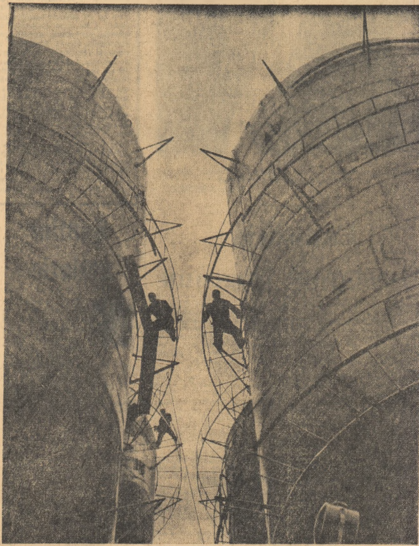
Pe șantierul uzinei de alumina din Oradea