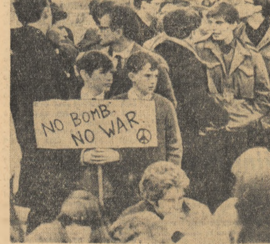
Aspect de la o manifestație împotriva înarmării nucleare, ce a avut loc în apropierea Londrei