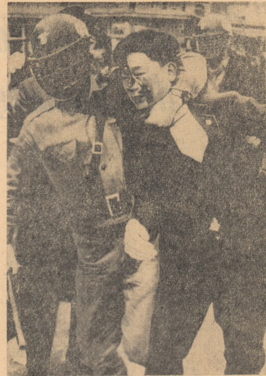
SEUL: un student rănit în cursul ultimelor demonstrații antigovernamentale este arestat de poliție.

Agnar Kl. Jonsson, secretar general al Ministerului Afacerilor Externe, a oferit un dejun în cinstea ambasadorului român.