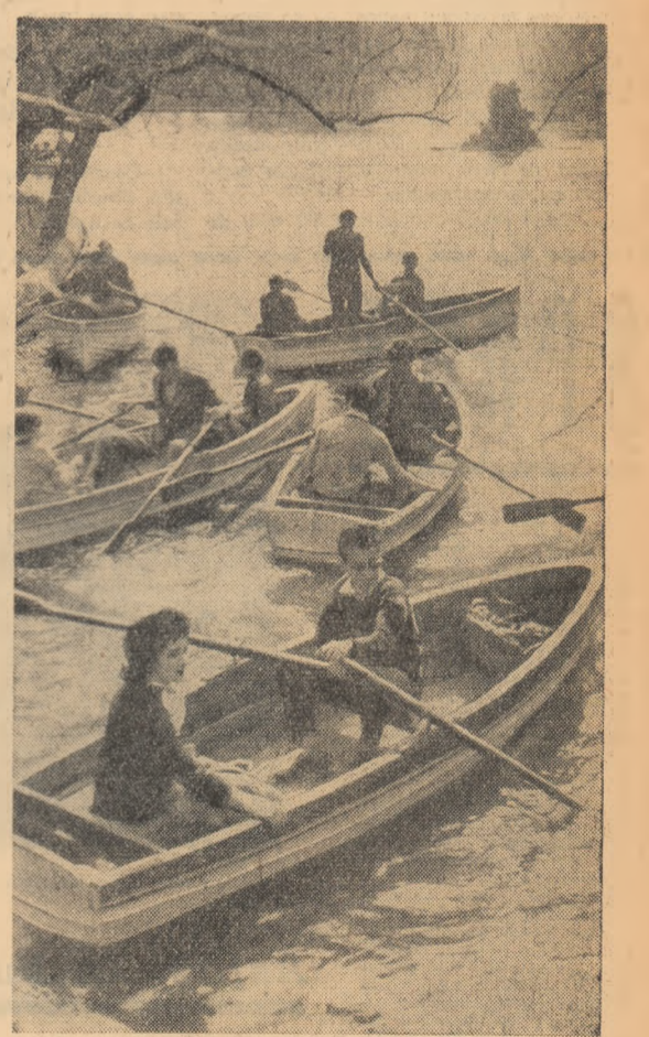
Din nou aglomerație pe lacul Cîșmigiu

Zilele acestea în cadrul secției a II-a prelucrării mecanice de la Atelierele de reparat material rulant Floiești, au fost montate și date în funcțiune două noi strunguri SN 630X 2000 soșite de la Uzinele de strunguri din Arad și o mașină de rabotat. Este în curs de montare un strung Carusel nou, care împreună cu utilajele de acest fel existente va asigura în sectorul rotării o ritmicitate mai bună a producției. În momentul de față se lucrează la instalarea și punerea în funcțiune a unui compresor de 15 m.c. care va asigura debitul de aer necesar secțiilor turnătorie, cazangerie etc. Paralel cu acestea, colectivele de muncitori, ingineri și tehnicieni din fiecare secție se preocupă în permanență de ridicarea calificării profesionale pentru creșterea continuă a randamentului mașinilor.