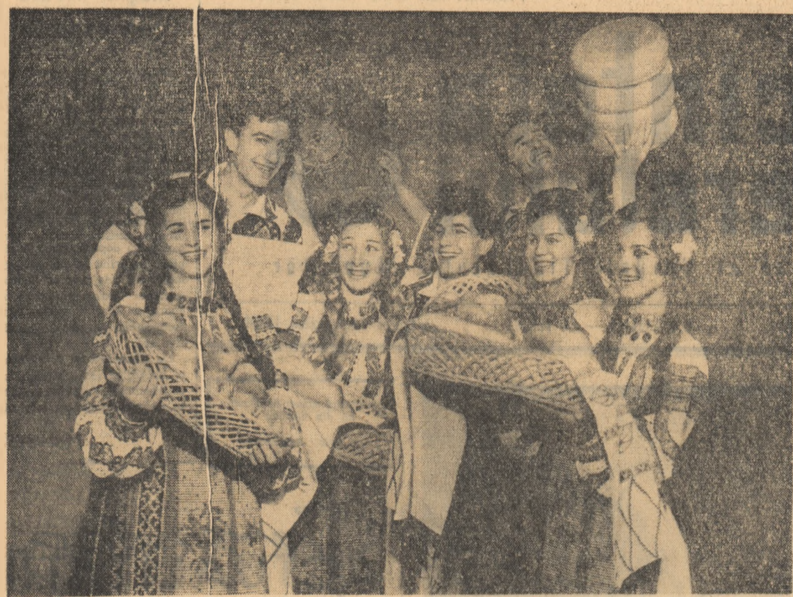
Ansambllul de cîntec și dansuri „Ciprian Porumbescu” din Suceava pregătete un nou spectacol.