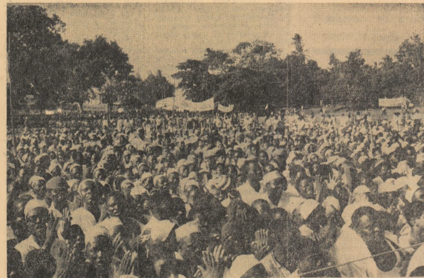
Miting al populației din Zanzibar în sprijinul politicii guvernamentale